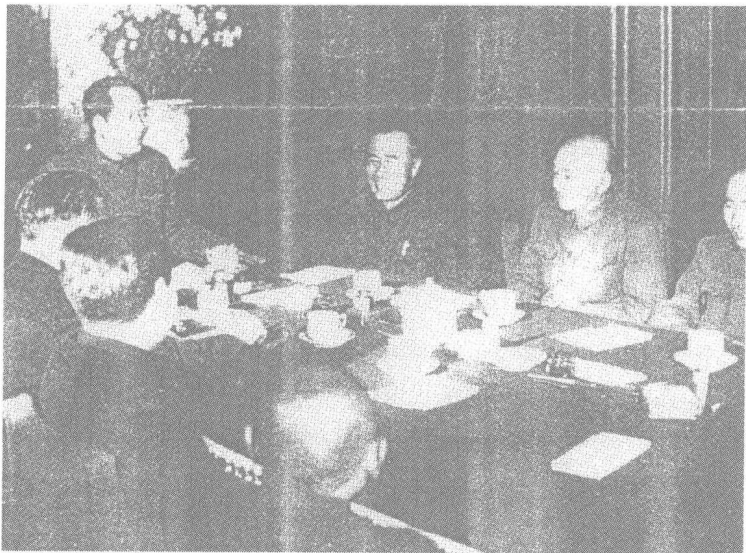
毛主席大胆决策 彭德怀临危受命