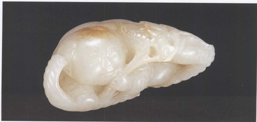
清中期 白玉秋叶童子