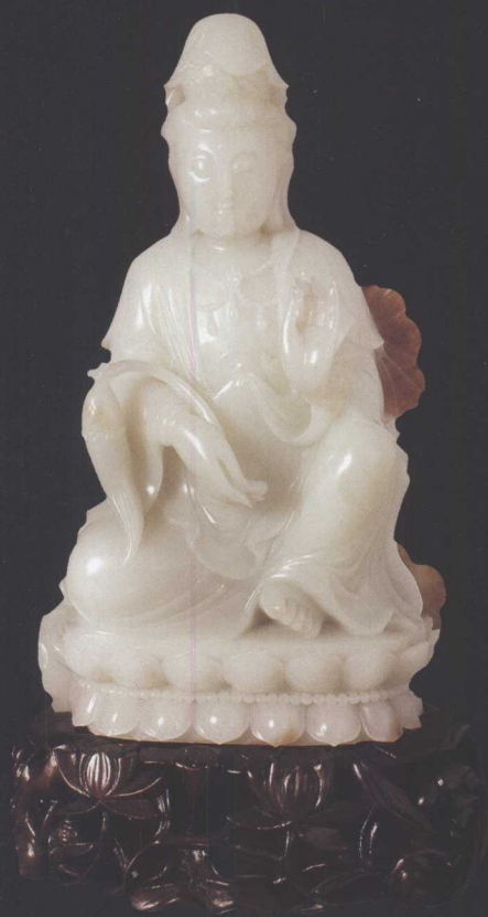
清中期 白玉观音坐像