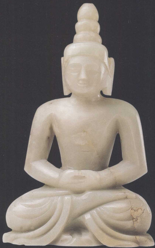
明 青白玉雕阿弥陀佛像