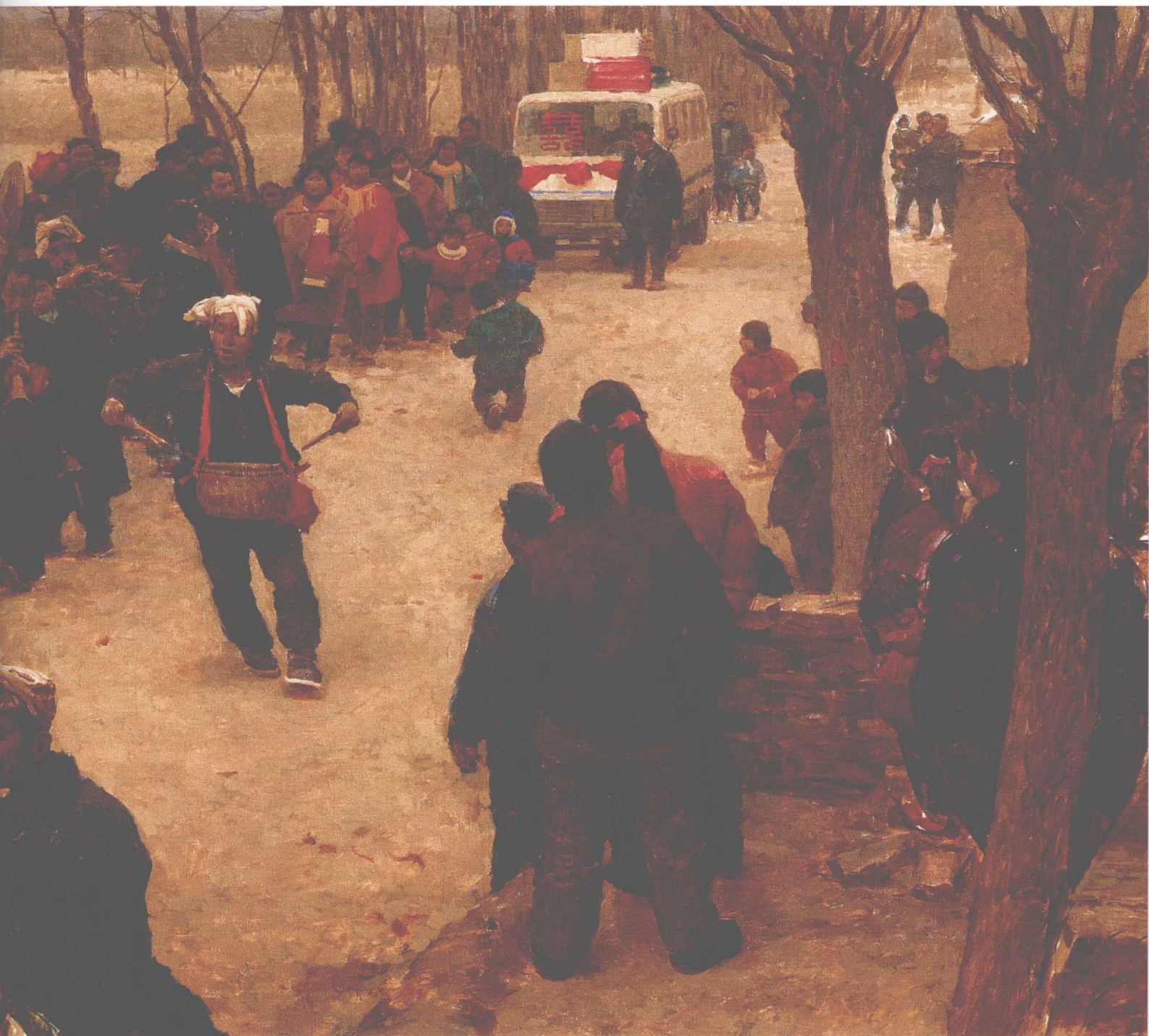
迎亲 70 × 160cm 1995年 布面油画