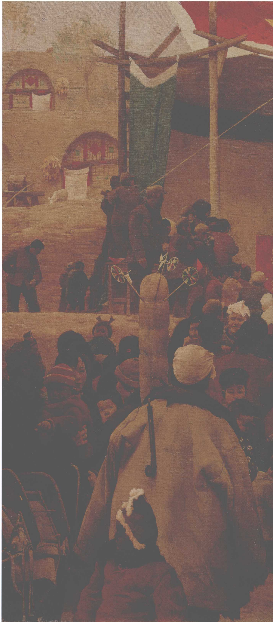
乡戏 65 X 80cm 1992年 布面油画