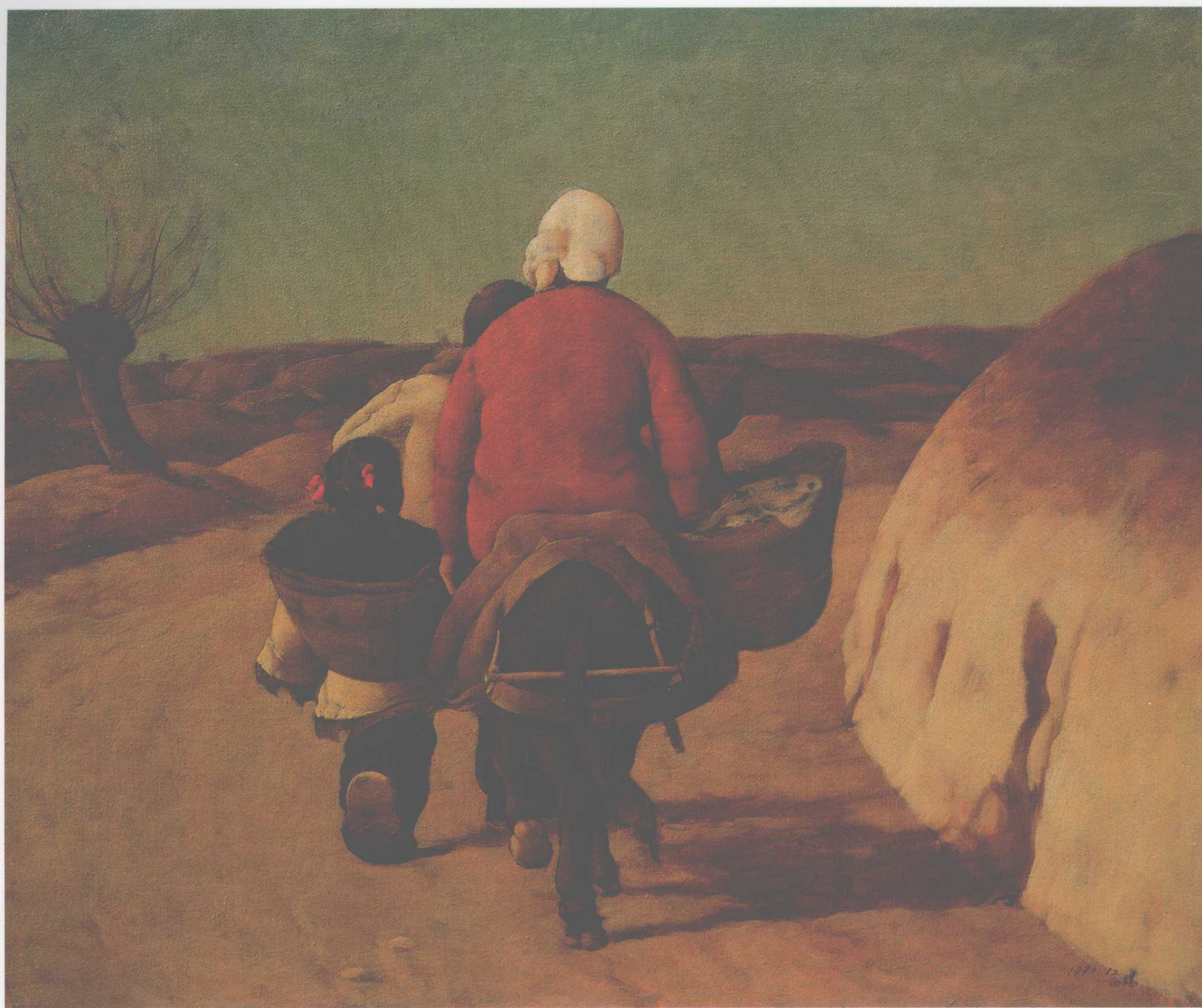
山路湾湾 50cm×60cm 布面油画 1991年