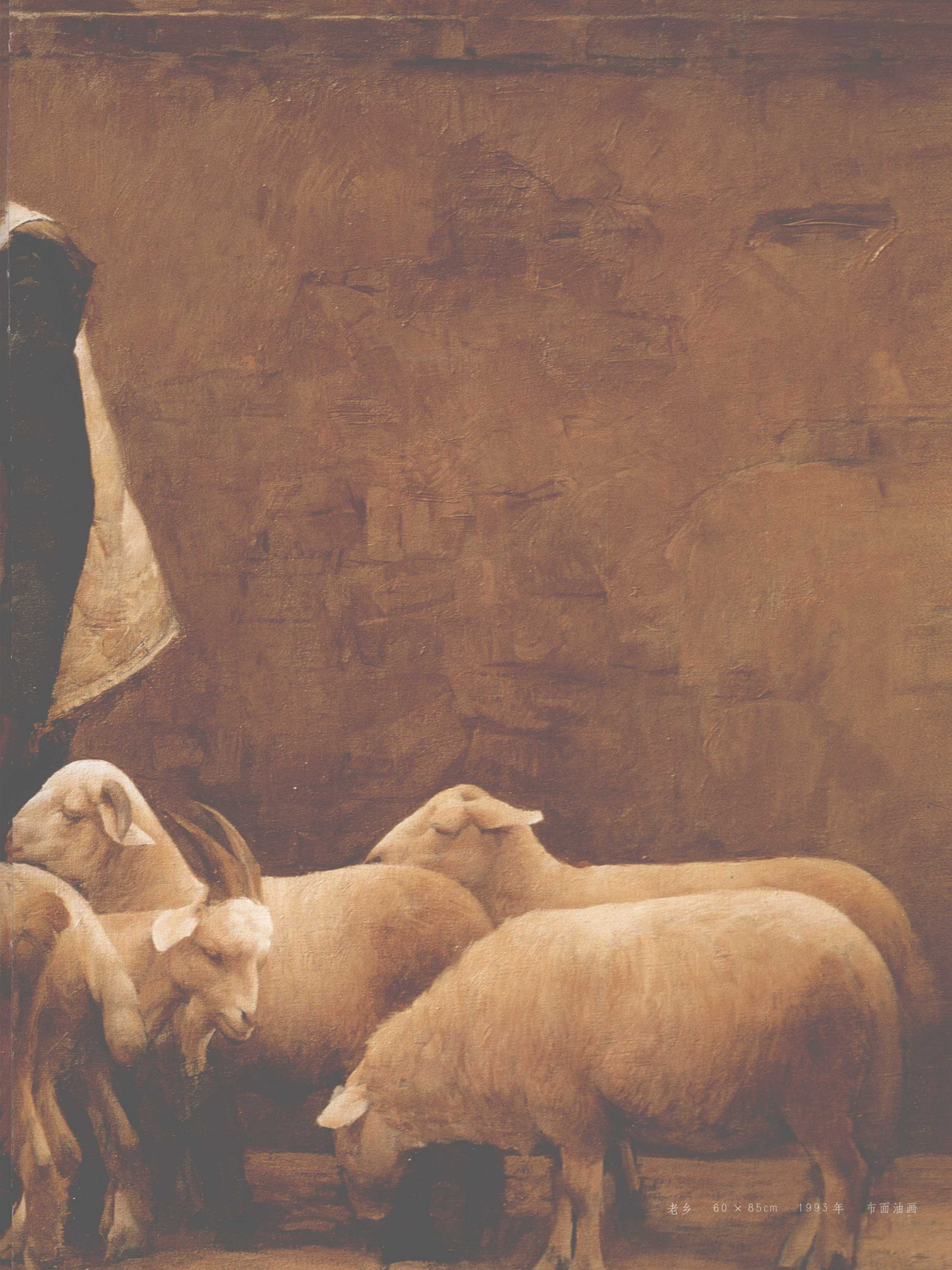
老乡 60 × 85cm 1993年 布面油画