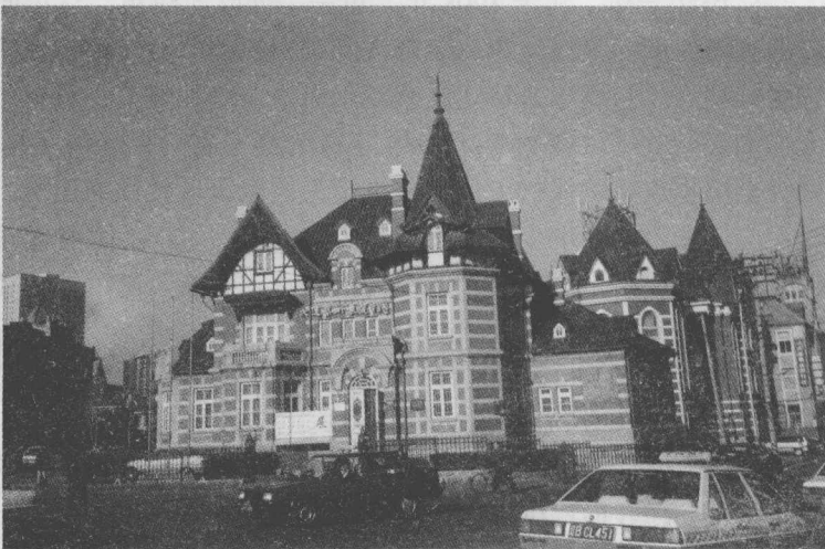
大连艺术博物馆（东清轮船公司旧址）

在胜利桥北，还有建于1900年的一处老建筑，它已经有105年的历史了。1902年，沙俄在远东强行建立的俄属租借地“达里尼市”，就在这处老建筑前面挂上了市政厅的牌子。日俄战争结束，战败的沙俄撤退时烧毁了这处建