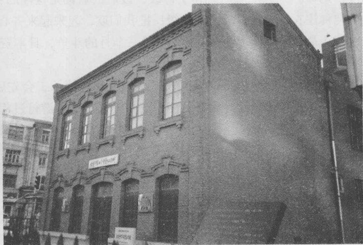
大连中华工学会旧址

工学会会长傅景阳当时有过这样的讲演，非常启发和震动人心：“当今不是笔战的世界，而是日本侵略我们中华民族的世界，是侵占我们大连的世界，是掠夺中华民族物资和资源的世界，我们工人靠