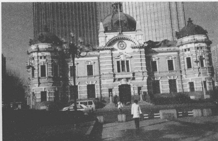
横滨正金银行大连支店旧址

某种启发。并不是外国的东西都那么无可挑剔，要一概兼收并蓄，而是取其先进的东西，借鉴合理的成分，来发展我们自己的事业。我们不妨取下几个百年老建筑的镜头，看看它们的“底蕴”吧。