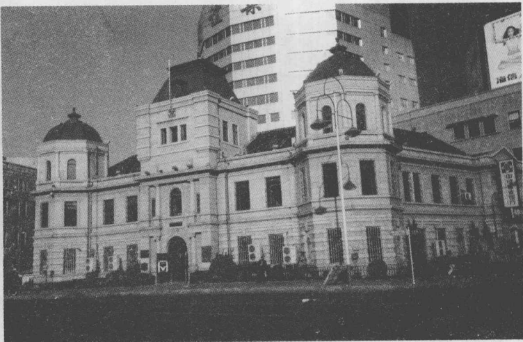
大清银行大连分行旧址

伴着优美、流畅的轻音乐，在中山广场徜徉，环顾四周，仿佛是走进了欧洲的名城，欣赏着国外的建筑特色，浏览着那些风格不尽相同的欧式老建筑，可以窥视到欧洲的建筑文化，从中得到