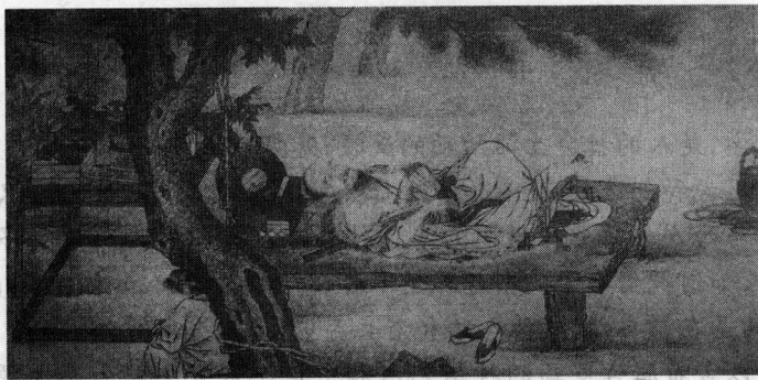
图 1-1-2 庄子梦蝶图

至于道家,诚如李约瑟在其《中国科学技术史》中所言,“中国如果没有道家思想就会像是一棵某些深根已经烂掉了的大树”。道家对于自然的向慕甚至在某种程度上决定了中国文学艺术的审美取向,而在这种“自然为本位”的观念中最为核心的其实是对“天人合一”的强调,而所谓的“天人合一”,追求的便是人与自然的距离的消泯,是人化迹于自然、山水,在自然中安顿灵魂,为浮沉于世的个体生命找到一个出口。