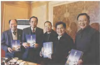
◀ 2007年2月2日，中共云南省委副书记李纪恒（右二）对《云南特色文化》研究成果给予充分肯定。