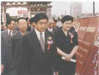
► 2002年6月2日，中共云南省委副书记王学仁（前），省委常委、省委宣传部部长滕友琼（右）参观云南省首届社会科学普及周展览。