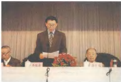
► 1999年9月9日，中共云南省委书记令狐安（中）出席中国延安精神研究会在昆明召开的庆祝“中华人民共和国成立五十周年暨第三次各地延安精神研究会经验交流会”并在会上作重要讲话。