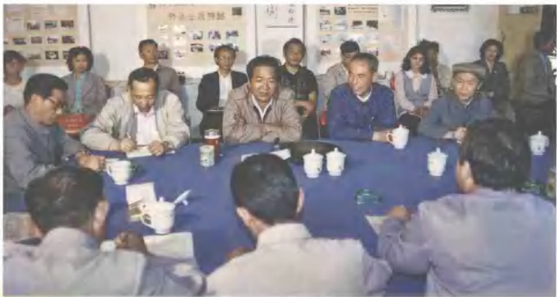
▲ 1989年5月4日，云南省省长、云南省社科联名誉主席和志强（上中）与社科专家座谈。

▲ 1987年7月，中共云南省委副书记高治国因为云南省第二届社会科学工作者代表大会暨社会主义研究现实问题优秀论文评选活动专题词祝贺。