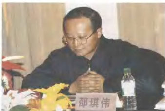
► 2003年1月30日，云南省副省长邵琪伟到云南省社科联调研、指导工作。