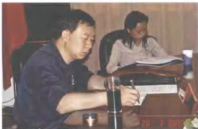
◀ 2005年7月20日，云南省副省长刘平到云南省社科联调研，听取工作汇报。