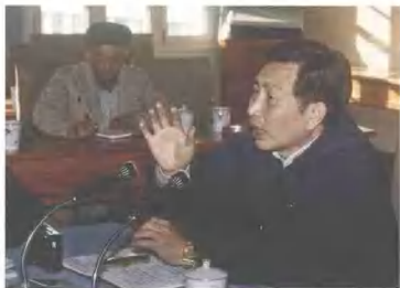
▲ 1989年12月18日，中共云南省委副书记聂安贤在云南省社科联二届三次全委会上作重要讲话。

▲ 1987年7月，中共云南省委副书记高治国因为云南省第二届社会科学工作者代表大会暨社会主义研究现实问题优秀论文评选活动专题词祝贺。