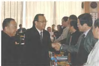
▶ 2007年2月9日，中共云南省委常委、省委宣传部部长张田欣在云南省哲学社会科学界2007新春茶话会上和与会专家学者切磋手。