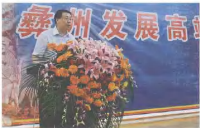
▶ 2007年5月28日，中共云南省委常委、中共楚雄彝族自治州委书记曹建方在彝州发展高端论坛专家咨询会上作重要讲话。