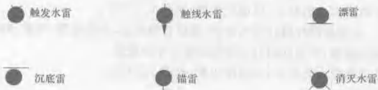
图 1.3 零散水雷标示