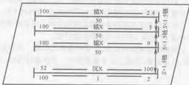
图 1.2 水雷幕标示