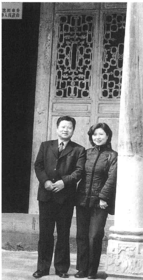
故乡出了个国防部长张爱萍，舒淳偕妻寻访其故居。