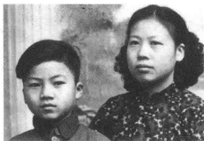
舒淳少年时代与母亲的合影。