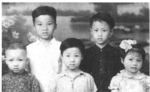
舒家5兄妹虽处平民杂院，仍显高贵与不凡。