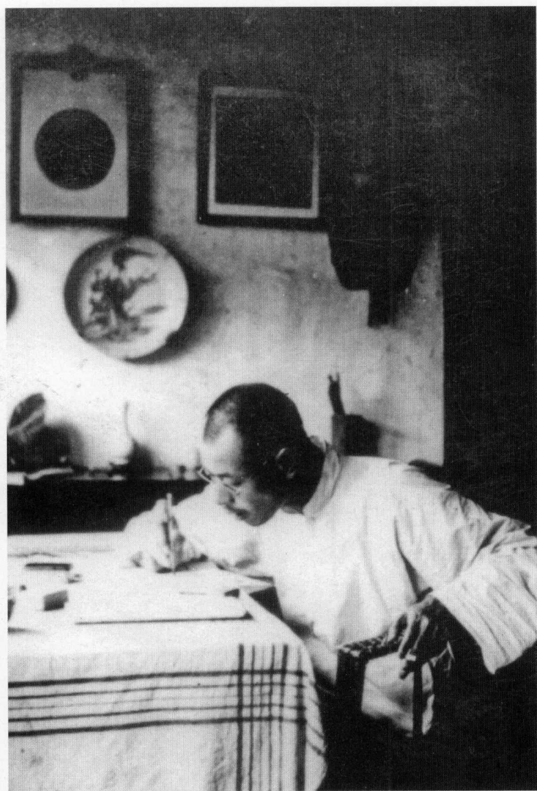
上个世纪 30 年代的邓之诚