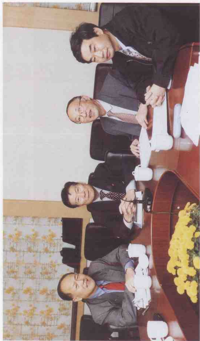
中国地质大学现任领导合影