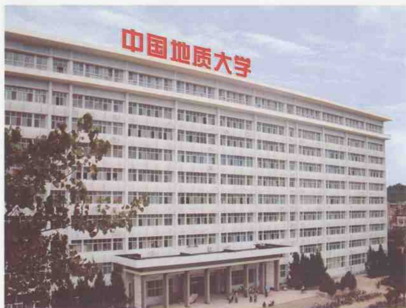
中国地质大学(武汉)