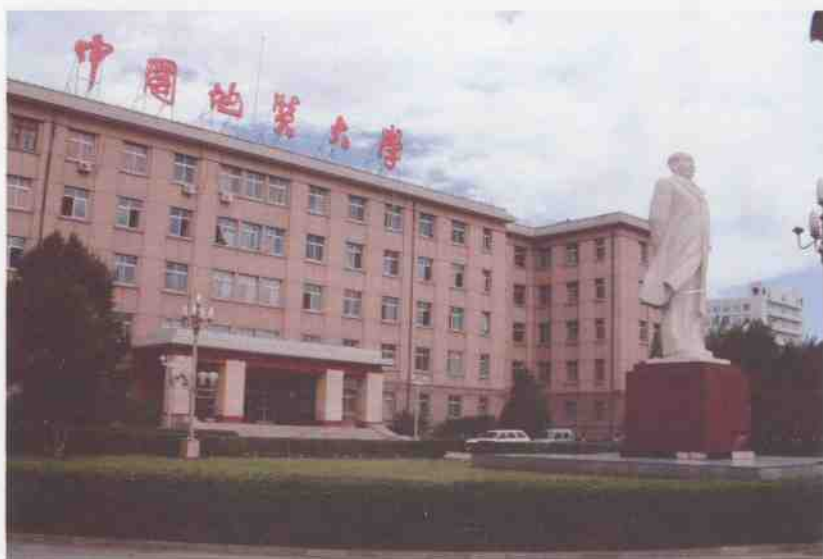
中国地质大学(北京)