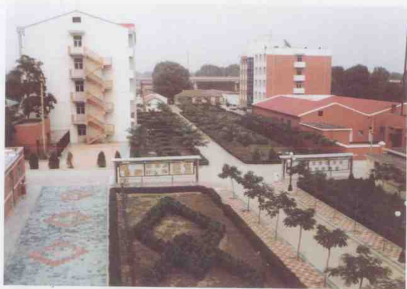
中国地质大学秦皇岛实习基地