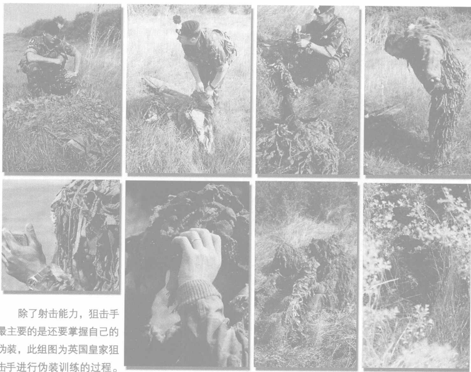
除了射击能力，狙击手最主要的是还要掌握自己的伪装，此组图为英国皇家狙击手进行伪装训练的过程。

如果说一场战役的成败取决于狙击手的使用，那无疑是一种夸大的说法，但狙击作战对交战双方的作战发挥的确意义重大。1863年美国南北战争中的葛底士堡战役期间，两名隐藏在一座小山头的南军神射手接连击毙两名北军军官并重伤一名，此外还击毙另外4名北军高级军官。这在当时的北军军营中立即引发了恐慌，后者很快调集炮兵向狙击手可能藏身之地猛轰一气，但毫无收效。狙击手在战争中的出现随即给世界各国陆军带来两个新的问题，一是如何发现对方狙击手，二是如何将其消灭。俗话说，解铃还需系铃人。“反狙击”的出现，就是为解决寻找并消灭敌狙击手而生，这也成为各国陆军部队重要的训练科目。只要首先让对方的狙击手消失，才能有效执行侦察和情报搜集任务，而这也是狙击手最重要的战术使命之一。虽然前文提到狙击手们在自己军中多少有些不受欢迎，但有趣的是，反制对方狙击手的最好方法就是出动自己的狙击手——这个道理所有士兵都明白。这使得普通士兵们