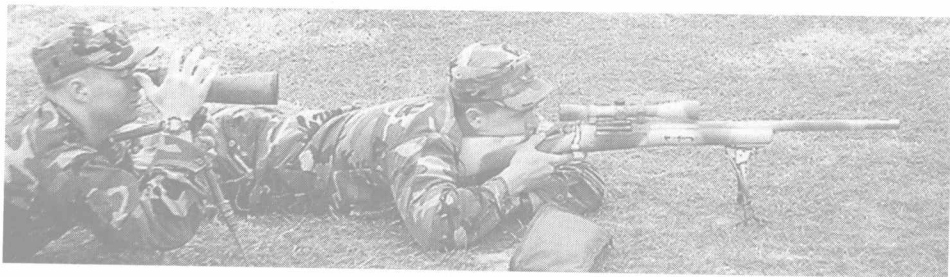
在美国陆军狙击手学校学习的美军士兵