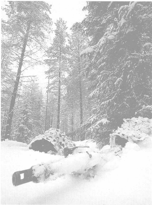
优秀的狙击手必须具备在恶劣环境下长期作战时所必需的出众耐力和韧性。

一名真正意义上的狙击手所应具备的专业技能是多方面的，所经受的训练也是高强度的。以美军为例，在正式成为一名军中狙击手前，超过三分之一的学员将会在训练和选拔中被淘汰。反过来说，要想最终通过选拔，必须熟练掌握一系列复杂的作战技能，具备包括野外生存、伪装、转移、观测、