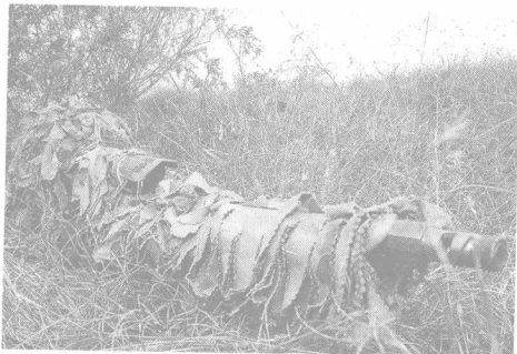
伪装良好的现代狙击手

在 20 世纪末期发生的几场军事冲突中，技术的进步使得狙击武器的射程和精确度较以往有了很大程度的提高，人们对于狙击手的期望值也随之提升。现代战争的作战呈现出多样化的趋势，融合了许多复杂的因素，单就步兵战