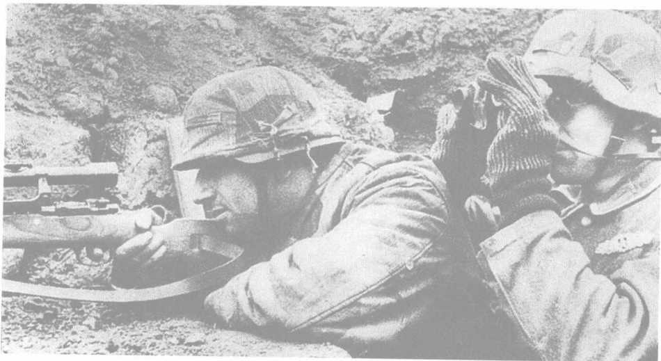
正在执行任务的德军狙击小组

识图、通讯、情报搜集以及精确射击等突出能力，使自己能够适应野战环境下（有时是在敌方战区）独自作战和生存的能力，还要求狙击手本人有良好的纪律性，具备在恶劣环境下长期作战时所必需的出众耐力和韧性。狙击手还要求掌握良好的测距技术，在 800 到 900 码距离上的估算偏差必须控制在数英尺内。除此之外，对风力风向、温度和湿度以及目标的移动状况的判断也同等重要。而在所有这些必要的能力中，射击技能更是首要的。