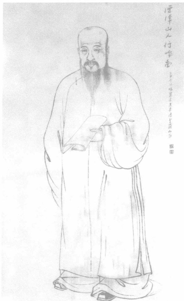
一代诗宗渔洋山人行吟图