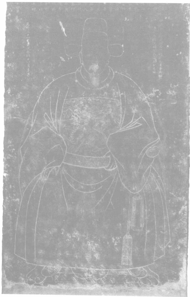
忠勤公王重光玉照