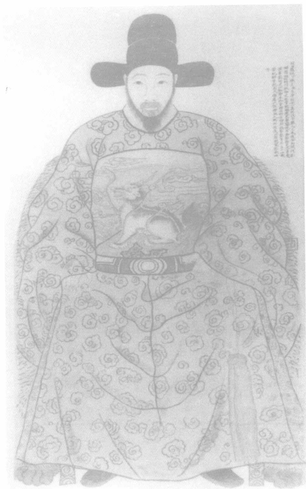
应天巡抚王象恒玉照