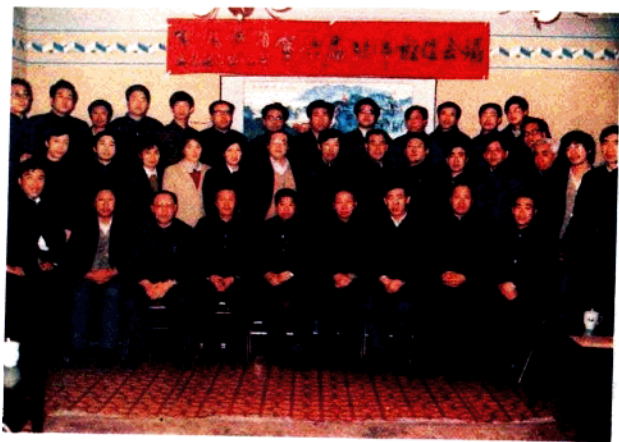
1987年1月，省工艺品进出口公司在绥化地区召开工艺系统的经理会。黑龙江省对外经济贸易厅吴镛副厅长（前排左5）。出席会议。