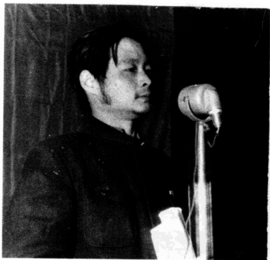
◀ 1953年8月12日 在天津市第二次 工会文教工作会 议上作报告。