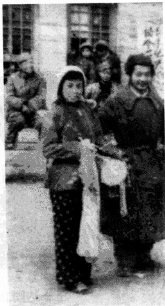
▼ 1946年在延安导演歌舞《新春花鼓》。