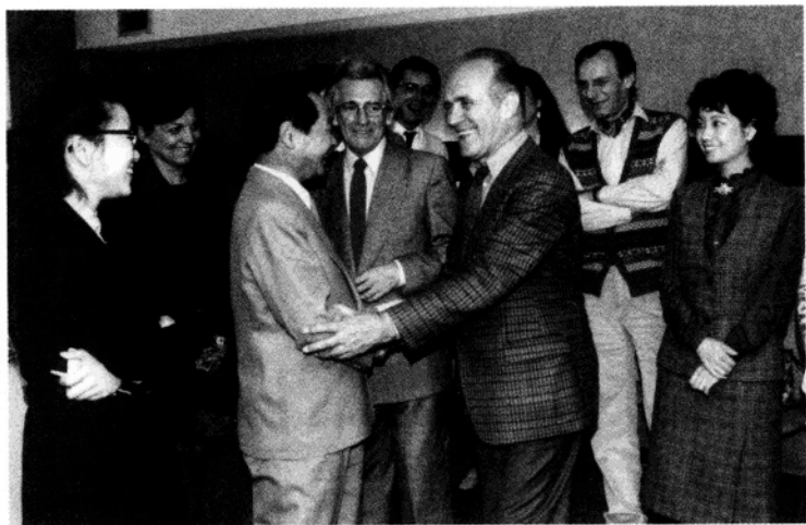
▲ 1983年3-7月率中国京剧院赴欧演出团出访欧洲四国。