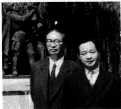
◀ 与郑振铎在保加利亚。