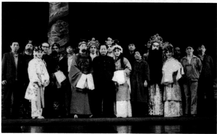
▼ 在京剧《大明魂》演出结束后 与演员合影（1982年）。