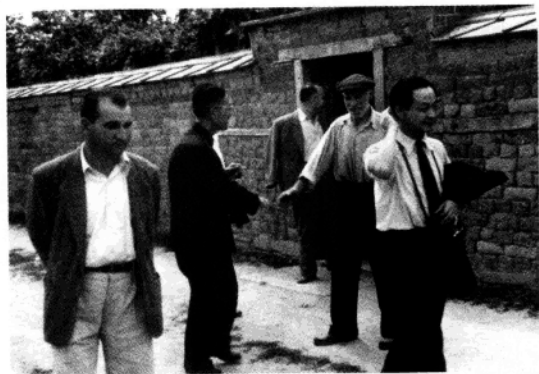
◀ 在保加利亚农村考察。