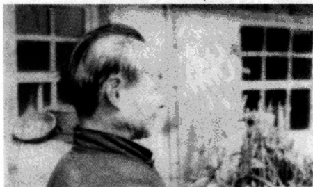
▶ 在东北农村插队时 患病头发脱落。