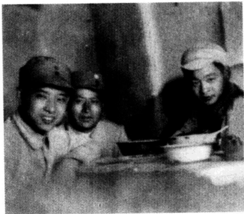
◀ 40年代在延安窑洞里。左起：胡耀邦、吴印成、王一达