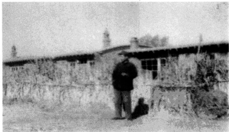
▲ 文革中孤身一人在 东北农村插队。