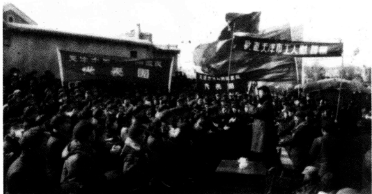
▲ 1954年2月任天津市工人访问农民代表团总团长下乡慰问农民时在广场演讲。