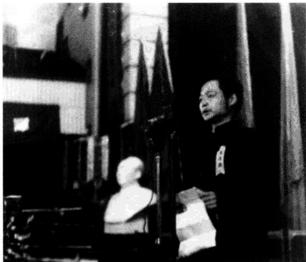
► 1954年2月3日在天津市工人业余艺术汇演大会开幕式上，以大会主席身份致开幕词。