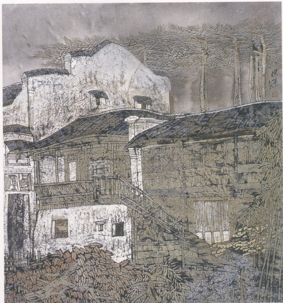
古翠 58×56cm 纸本设色