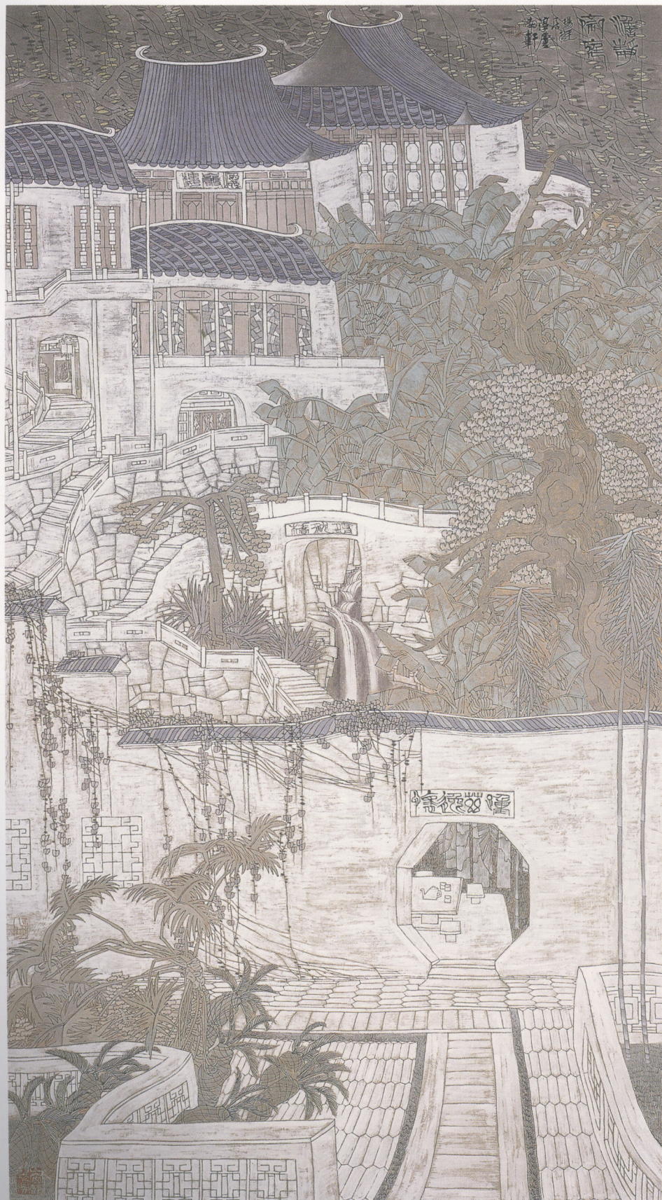
澹靜齋庭 180×96cm 紙本設色