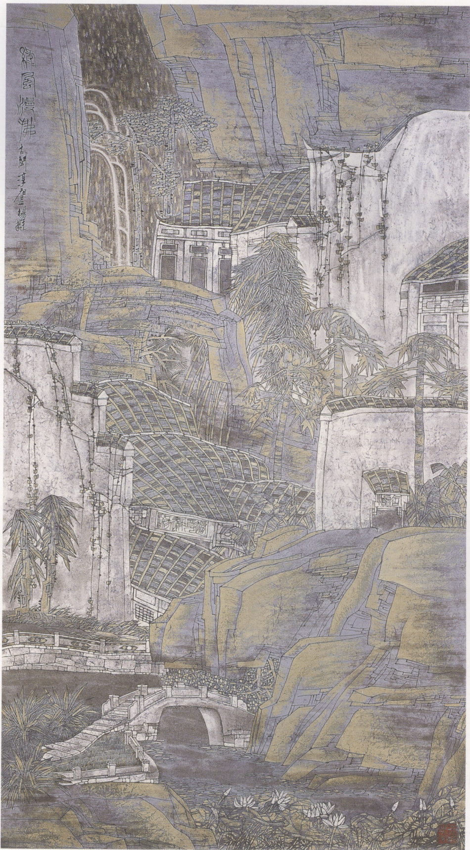
绿风漫拂 180×96cm 纸本设色