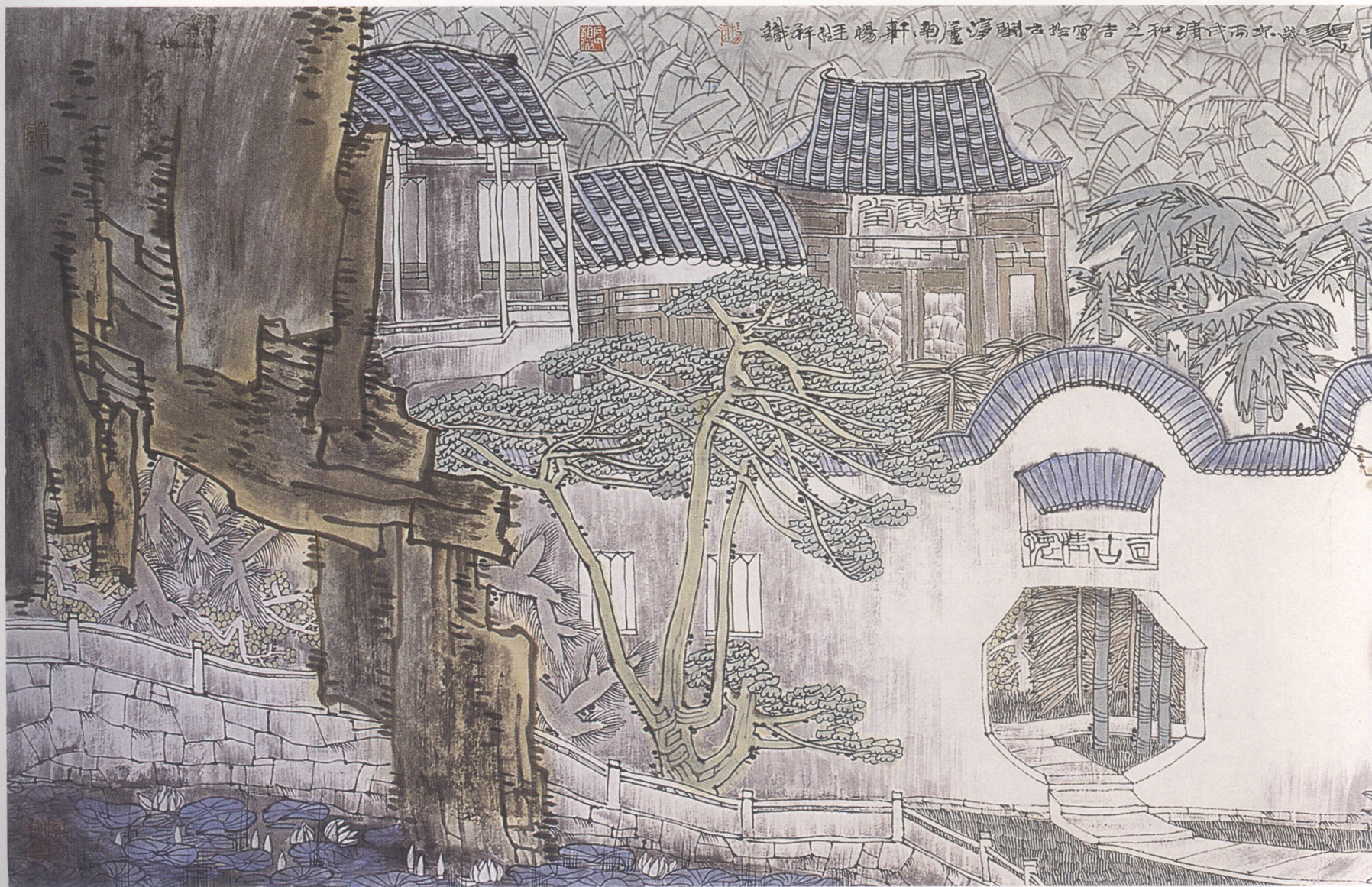
凝晖积翠 63×232cm 纸本设色