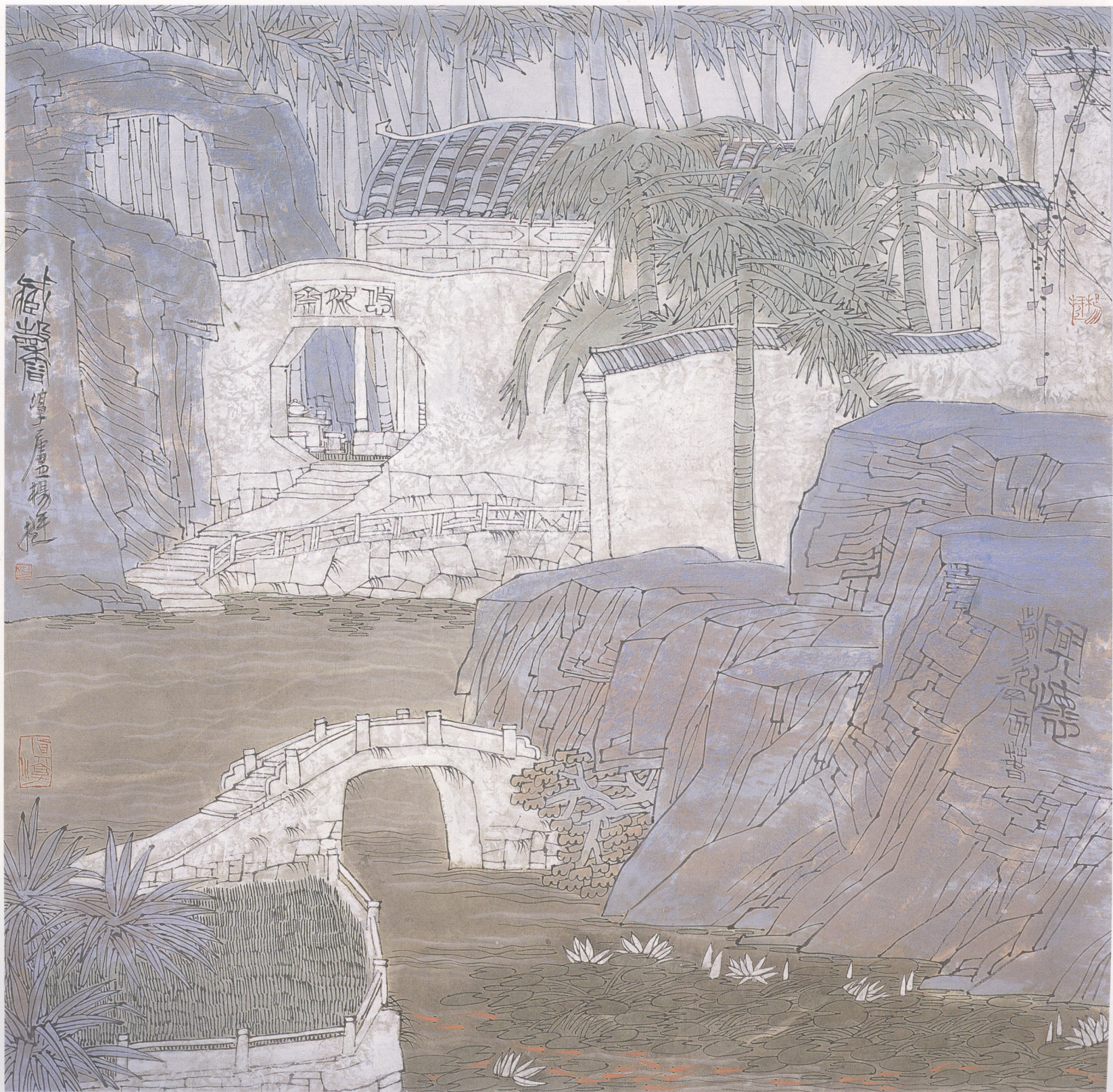
藏馨 68×68cm 纸本设色