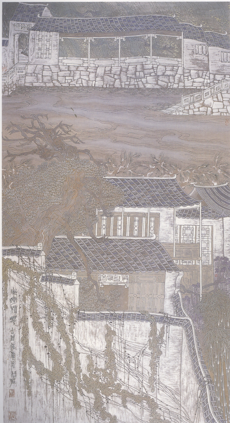
凝晖积翠 180×96cm 纸本设色