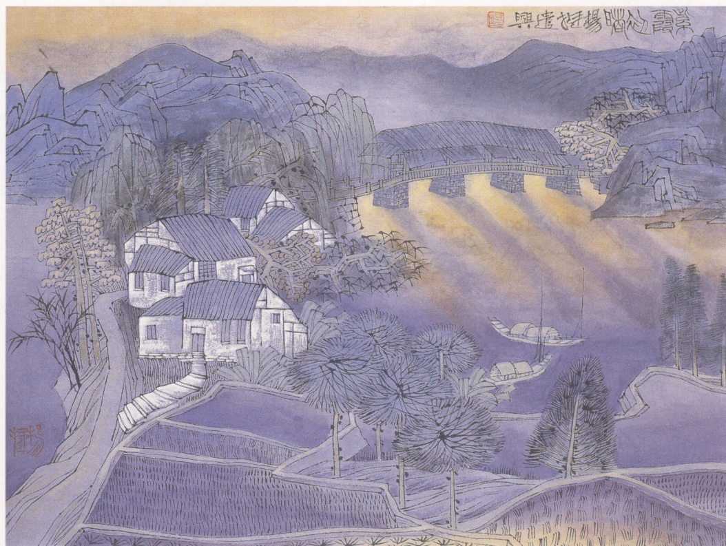
紫霞初曙 23×35cm 纸本设色