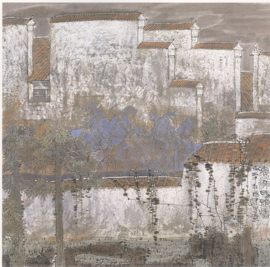
婺源马头墙 68×68cm 纸本设色