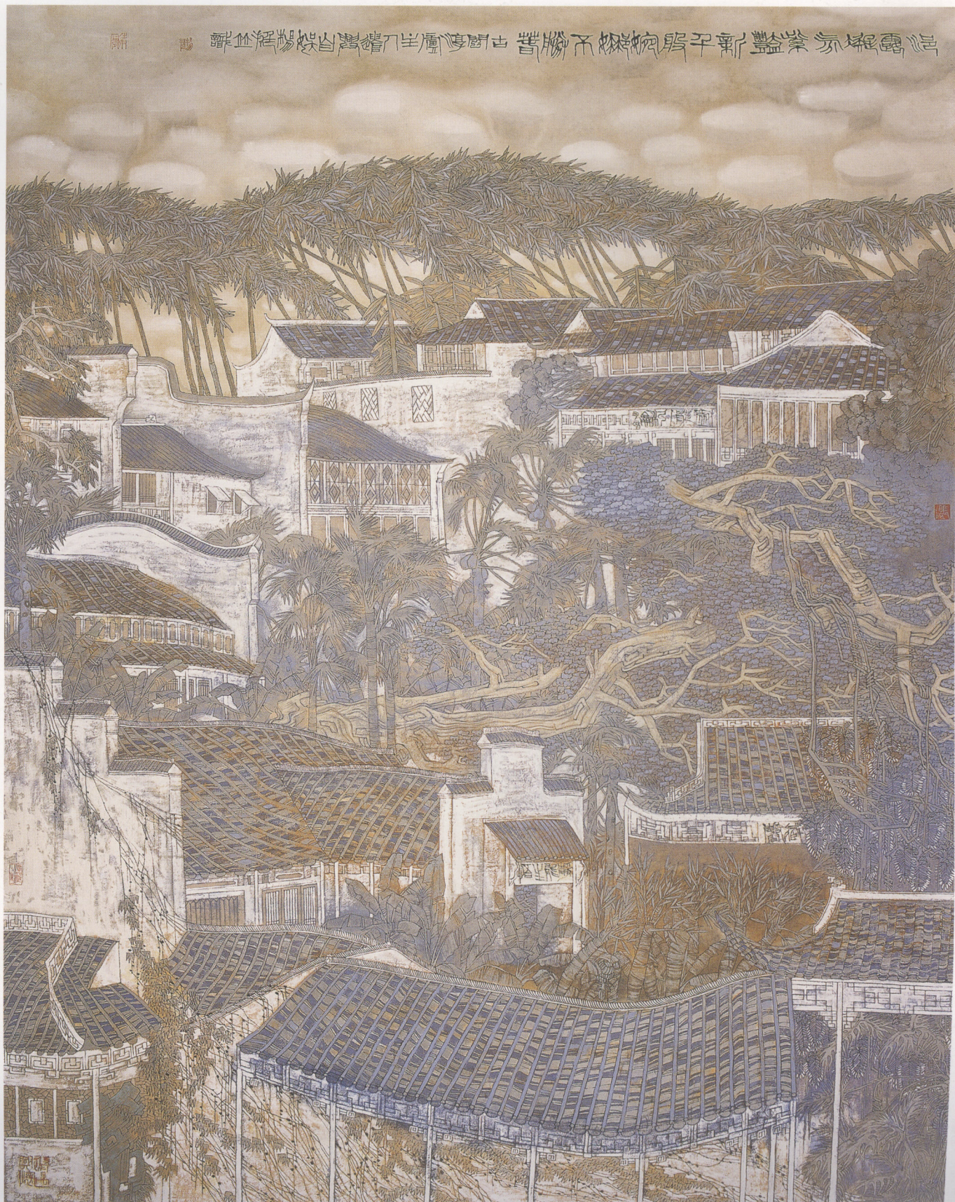
海露凝氛紫艳新 180×144.5cm 纸本设色