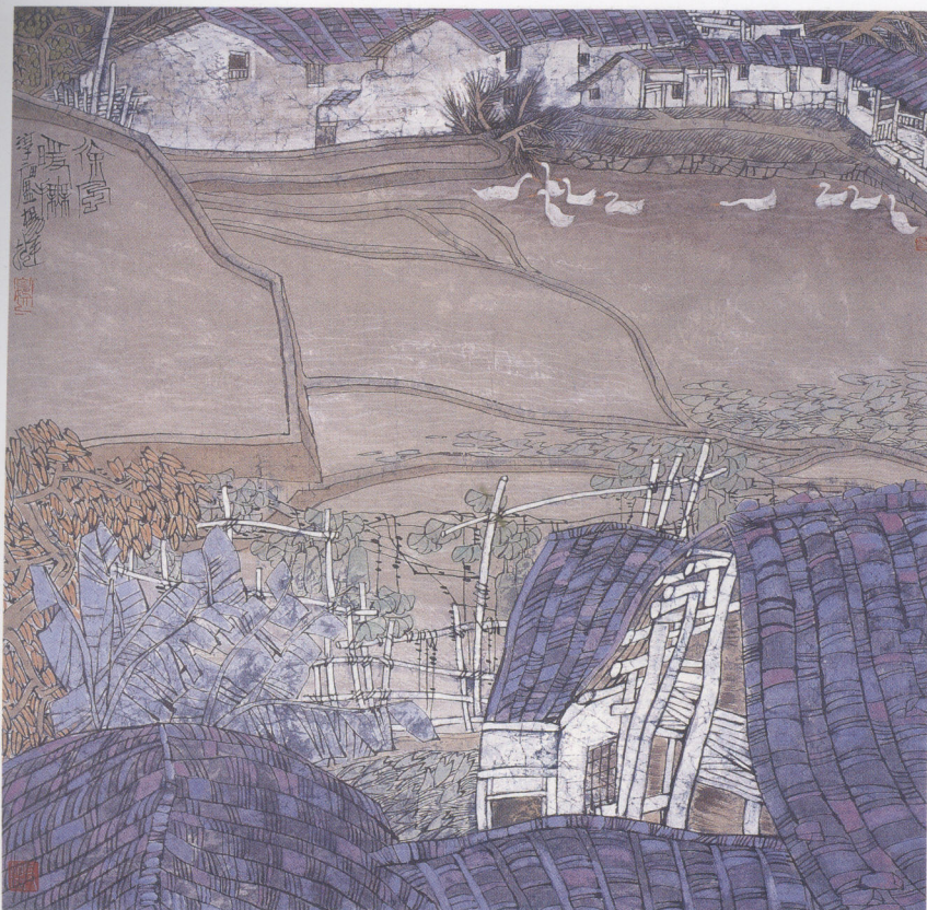
徐风暖抚 68×68cm 纸本设色