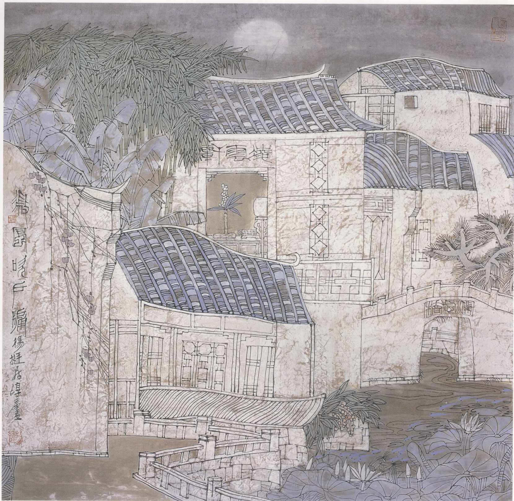
微风吹户牖 68×68cm 纸本设色