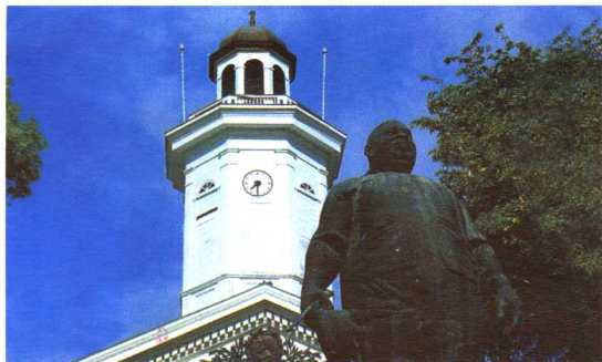
独立广场上的彭格 尔塑像和财政部塔楼