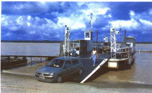
苏里南阿尔比纳和法属圭亚那圣洛朗之间的轮渡