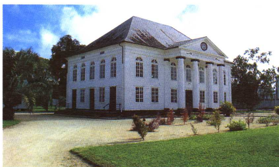
首都凯泽大街的犹太教教堂