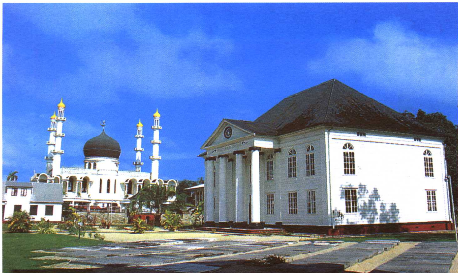
首都凯泽大街上比肩而立的犹太教堂（右）和伊斯兰教清真寺（左）