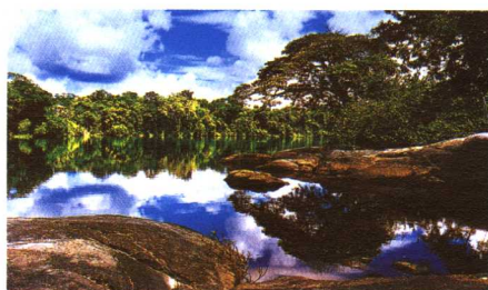
苏里南河上游热带雨林