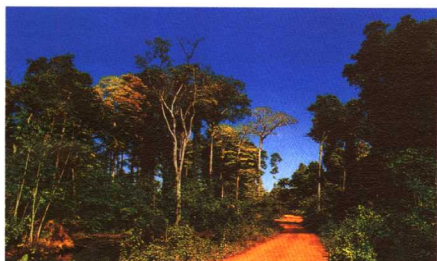
穿越热带雨林的道路