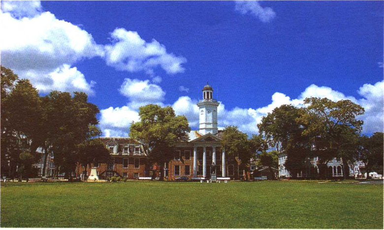
苏里南首都的独立广场（又称团结广场）