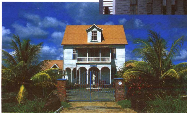
摩根斯通德种植园