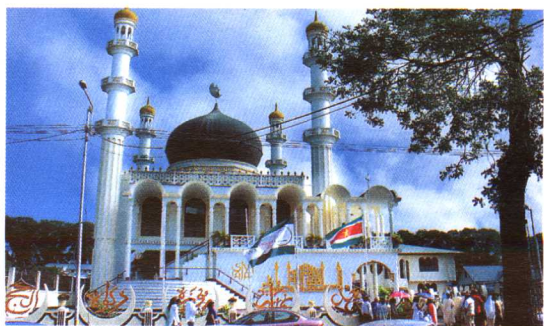
首都凯泽大街的伊斯兰教清真寺