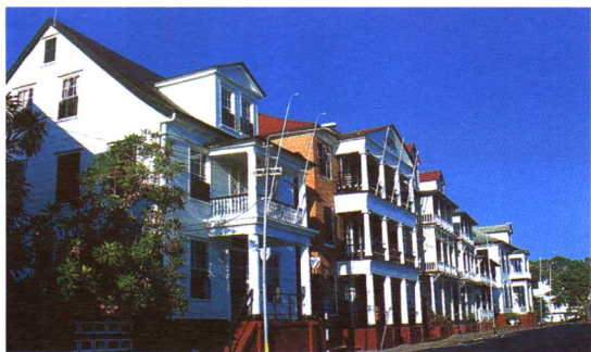
首都滨水大街街景