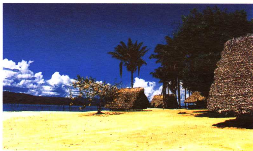
范布洛梅斯泰恩湖上小島一隅