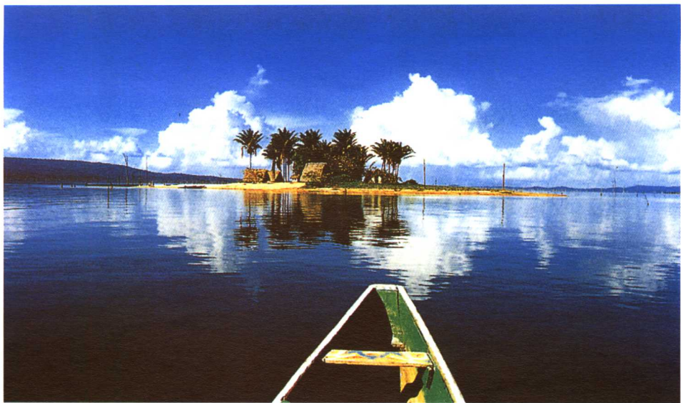
范布洛梅斯泰恩湖中的小島