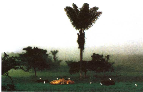
通往蒙戈城的路上