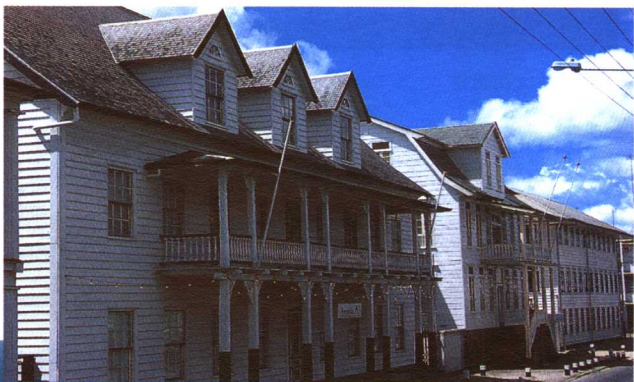
亨克·阿龙大街 (前格拉温大街) 一角