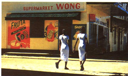
苏里南的华人商店