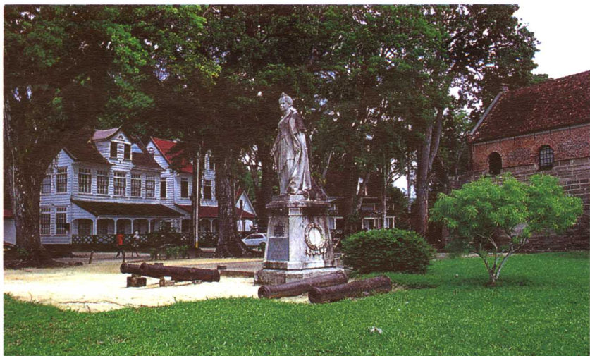
泽兰迪亚要塞的荷兰女王威廉明娜塑像