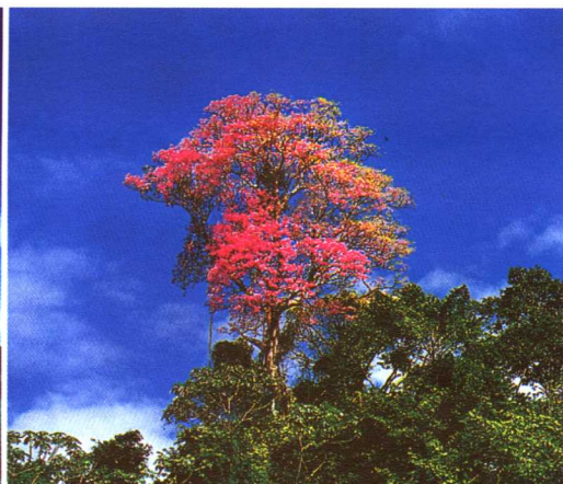
苏里南名贵树种绿心樟