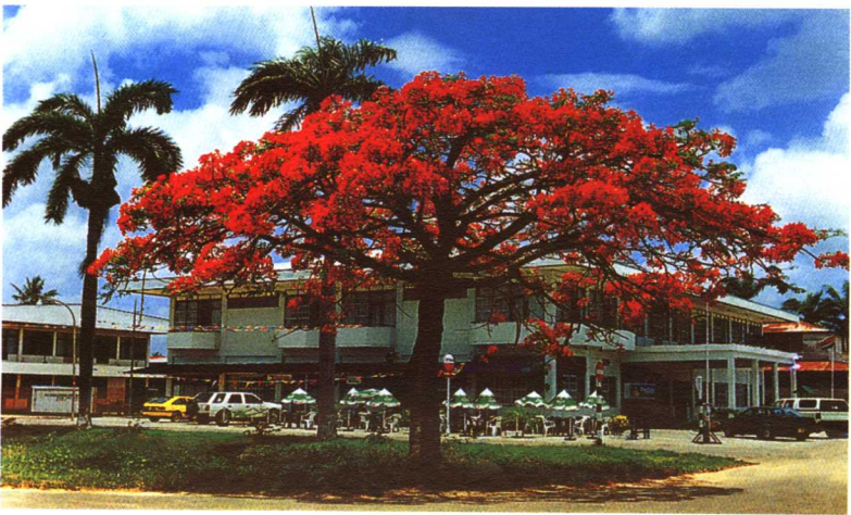
苏里南西部城市尼克里一景