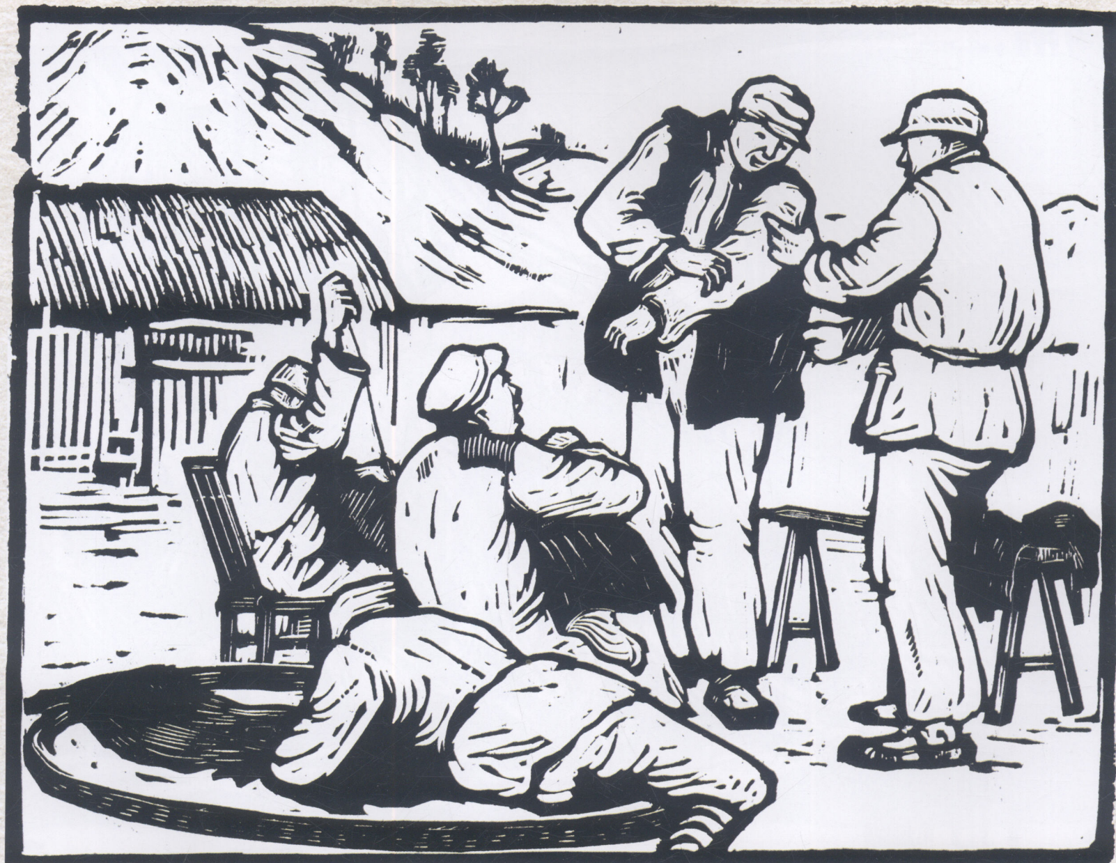
做寒衣 (大别山) 1947年