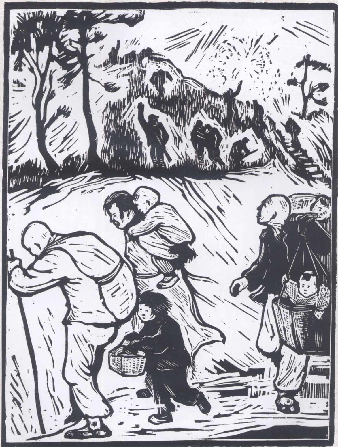
掩护转移（大别山） 1947年