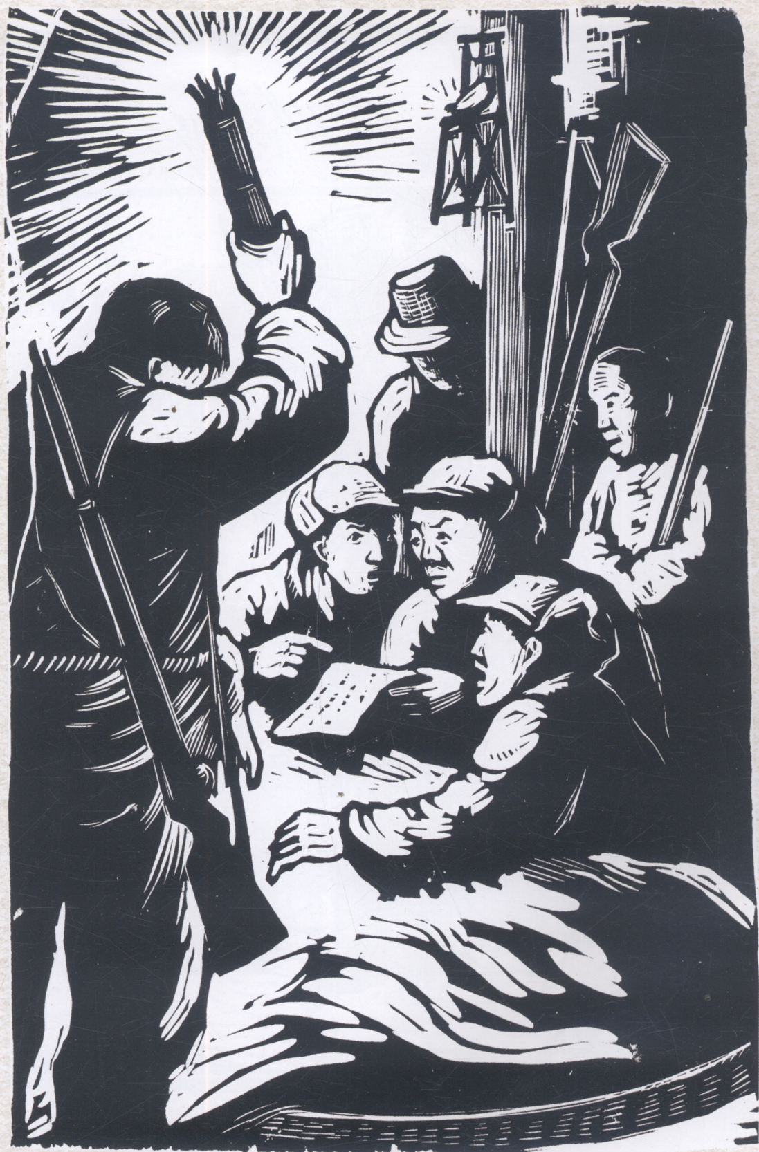
情报 (大别山) 1947年