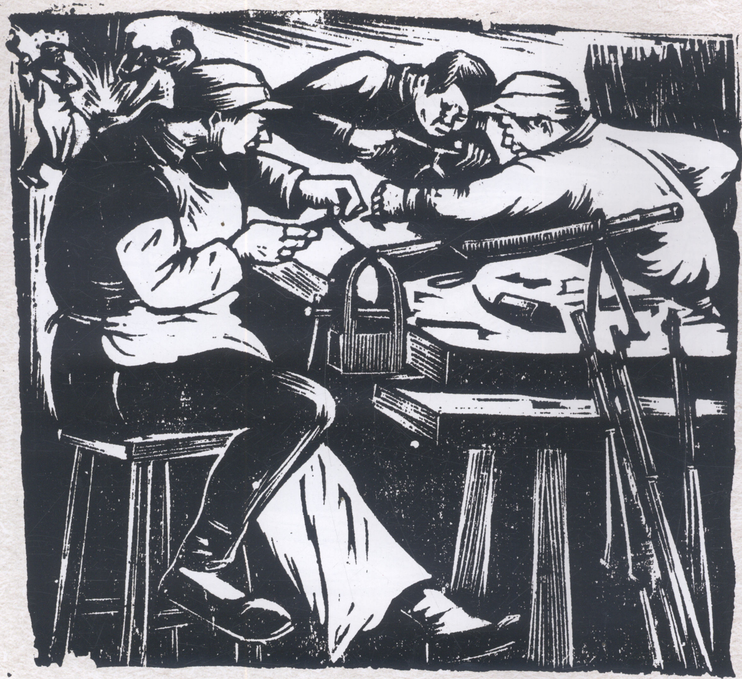
敌后修械所（太行山） 1939年