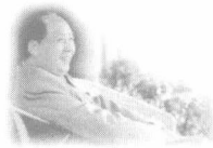
Mao Zedong Tan Mao Zedong

凭着这些第一手资料，斯诺离开陕北后写出了轰动中外的《西行漫记》一书，《西行漫记》第一次真实、广泛地介绍了中国共产党和红军、革命根据地，它的出版在世界上造成的影响非常之大，包括西方和国统区的人民，相当一部分人是通过《西行漫记》才知道红军和共产党的，知道中共的领导人毛泽东的，使当时“基本上不了解情况的外界大为惊讶”，感到“书中每一页都富有意义”。国外学者在论及这本书时认为它是“英文的关于中国苏维埃的最真