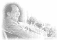
Mao Zedong Tan Mao Zedong