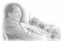
Mao Zedong Tan Mao Zedong