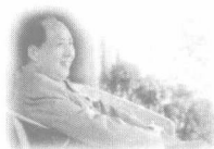
Mao Zedong Tan Mao Zedong