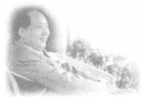
Mao Zedong Tan Mao Zedong