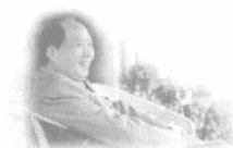
Mao Zedong Tan Mao Zedong

斯诺、萧三和其他人记录下的毛泽东的经历，相信会给读者了解毛泽东波澜壮阔的一生带来很大的帮助。