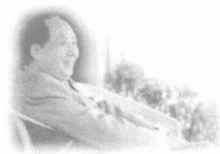
Mao Zedong Tan Mao Zedong

遗憾的是，毛泽东和许多伟人一样，都没有撰写，哪怕是口述过回忆录。有没有办法弥补一下这种遗憾呢？由后人撰写伟人的传记，这是办法之一。笔者以为，还有一种办法，就是将伟人平时的谈话、报告、文章、通信、闲聊之中谈论自己、评价自己的话收集起来，将这些看似零散的、不系统、不完整的话分门别类，归纳提炼，就会成为一部别具一格的自述。它就像将一群散落的珍珠用丝线穿好后制成的一副熠熠闪光的项链。