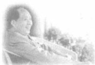
Mao Zedong Tan Mao Zedong