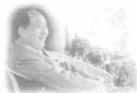
Mao Zedong Tan Mao Zedong