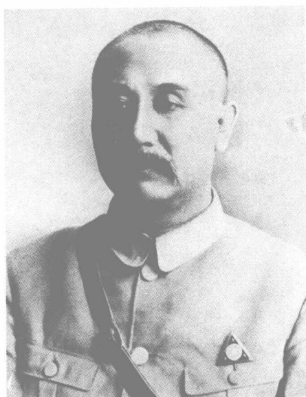
“山西王” 阎锡山 (1883—1960)