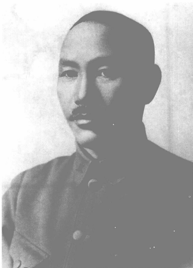
尽管在外表上跟军阀时期的军队不同，蒋介石（1887—1975）的军队仍然是军阀的军队