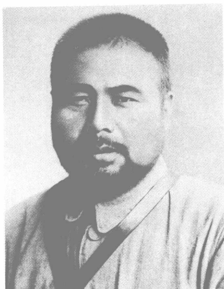
“布衣将军” 冯玉祥 (1882—1948)