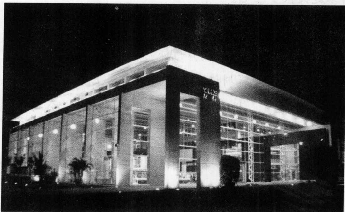
万科开发研究中心