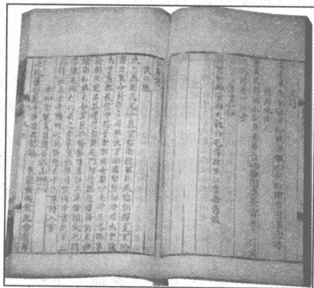
◁ 图 4-0-1 清武英殿刻本《全唐诗》 ▷

山水田园诗。这类诗虽创立于陶、谢，但陶诗多围绕个人生活而展开，写景成分较少，大小谢虽多写景，但模山范水，总体水平不高。唐人的山水诗