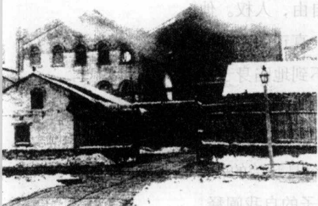
洋务派人物张之洞创办的湖北炼铁厂。

矿山，修铁路，废科举，兴学堂，派遣留学生出国，以及官员出洋考察，等等。马克思描述说：“与外界完全隔绝曾是保存旧中国的首要条件，而当这种隔绝状态在英国的努力之下被暴力所打破的时候，接踵而来的必然是解体的过程，正如小心保存在密闭棺木里的木乃伊一接触新鲜空气便必然解体一样。”解体太缓慢了。这种速度，不但不能满足少数先觉者的期待，而且实际上，也不可能使中国免受挨打的耻辱与覆亡的危险，这样，政治体制的改革便成了迫在眉睫的事情。然而，最高统治者对于死亡异常敏感。在大独裁者，长期垂帘听政的慈禧看来，政改如同玩火，其结局只能加速以其个人为中心的权势集团的崩溃，于是及时地把光绪帝及其政改计划给扼杀了。“百日维新”的悲剧，堵死了和平改革的道路。所有曾经为改革的浪潮所感召的人们，开始强烈地意识到：依靠目前的政府，是不可能把改革有效地进行下去的。正是这个专制腐败的政府，成了外国强权利益的保护者，成了民族独立、自由和进步的死敌。这时，法国大革命的电火，穿过时空的密云迅速来到东方，在日本东京的留学生群中开始酝酿暴风雨。