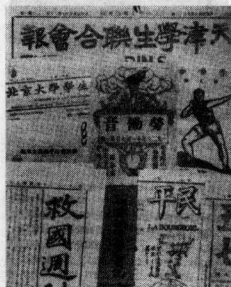
留日学生创办的刊物《青年学生联合会报》。