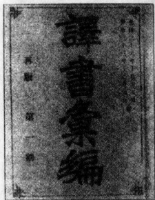
留日学生创办的刊物《译书汇编》。