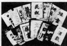
二十世纪初中国留日学生在东京创办的部分刊物。

以军事组织为基础的革命势力，坚持批判的精神和与政府相反的立场，以慷慨赴难般的热情，致力于破坏上等社会以护卫下等社会，传播自由、民主、科学，新人类解放的知识、观念和种种信息。“会时思思”里，五四一代知识分子的最大幸运，在于没有一个独裁而强硬的政府。民元以后，北京政权先后换过好几批人物，然而都因为立足未稳，而无暇或者无力顾及知识分子的存在。这样，他们仿佛生来就拥有言论、出版和结社的自由——人类最重要也是最基本的自由权利。这些权利有没有写到宪法上并不重要——在一个专制国度里，“法治”往往更糟，因为其立法的精神永远是敌视而不是确保自由的生存——重要的是实践的可能性；由于权力松弛，也就给思想在中国的传播造就了千载难逢的有利机会。从1919年起，新文化运动通过一本期刊和一所大学——陈独秀的《新青年》和蔡元培的北京大学——在全国迅速形成一个山鸣谷应、风起云涌的局面。这是一个探索的时代，争鸣的时代。哪里有知识分子，哪里就有他们的社团，有他们的报刊，有他们的各种各样的讨论。这些知识分子团体既是职业性的团体，更是精神性的团体；虽然散布很广，却为共同担负的变革的使命和崇仰的西方现代观念连结到一起。这种状况，颇有些类似法国历史学家科尚在论述雅各宾主义时使用的概