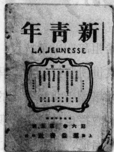
《新青年》，1915年在上海创刊，原名《青年杂志》，1916年更名，同年迁至北京。是五四新文化运动的中枢性刊物。