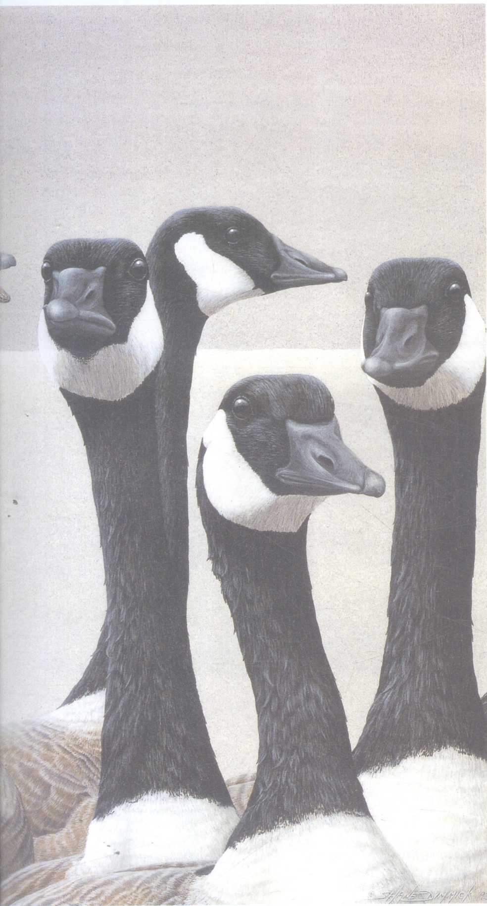
鹅群(加拿大鹅) 板上丙烯(41cm × 57cm)