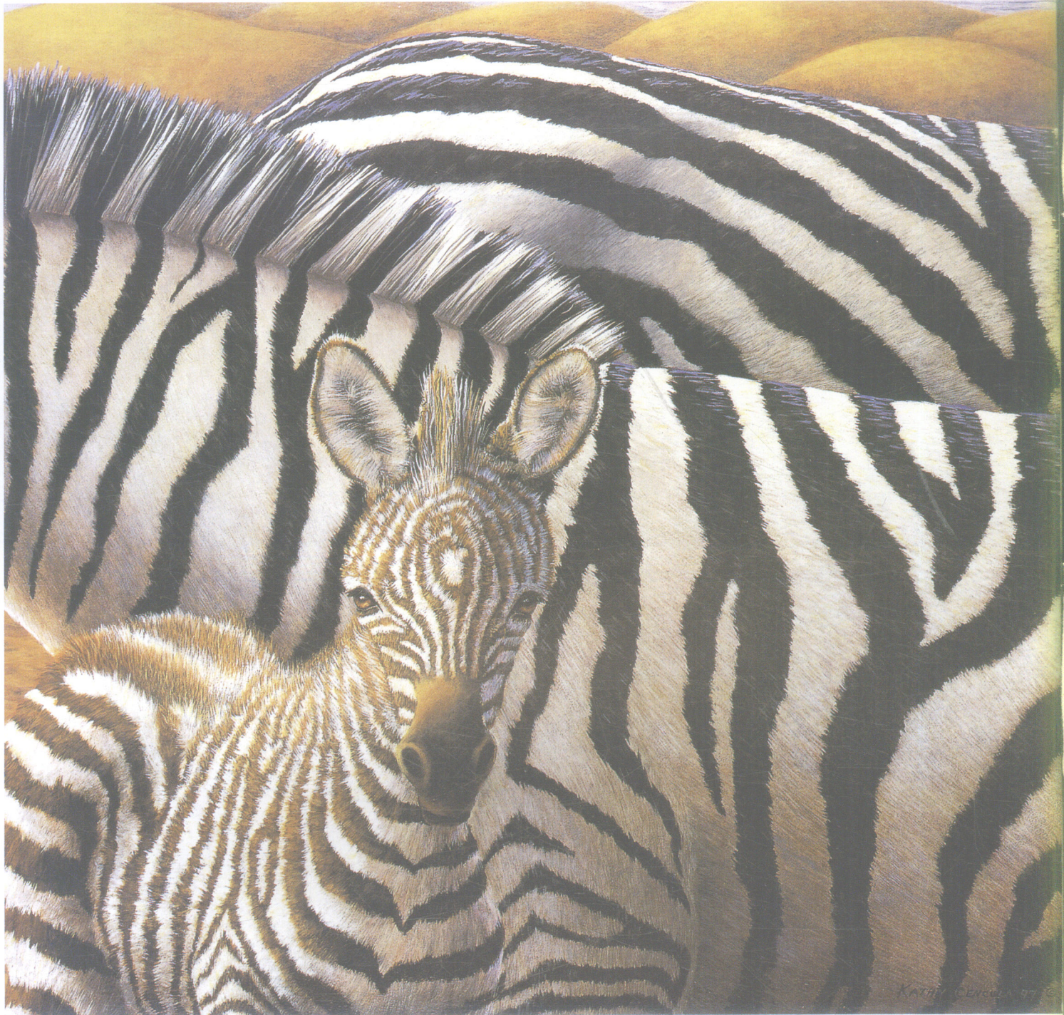
生命之线(格兰特斑马) 纤维板丙烯(43cm × 46cm)