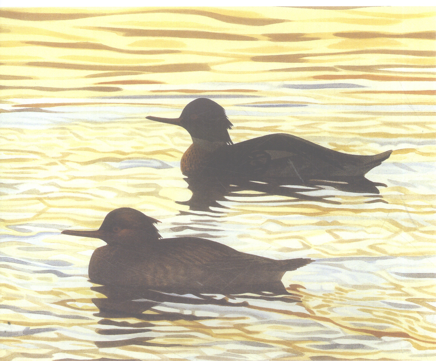
落日时的秋沙鸭(红胸秋沙鸭) 板上水彩(38cm × 48cm)