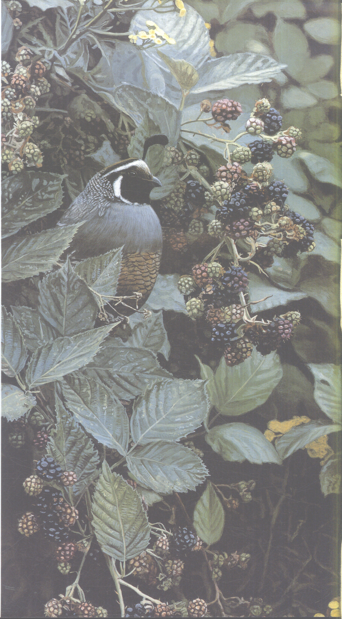
荆棘与铜扣(加利福尼亚翎管鸟) 特里·艾萨克纤维板油画(61cm × 23cm)