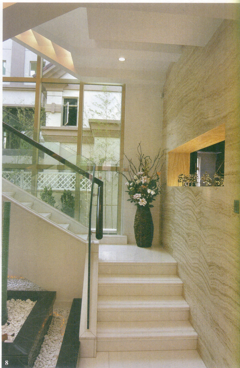
8 即使是楼梯拐角处，也有充足的自然光和灯光照明。 Natural and electric lights are sufficient even at the corner of the stairway.