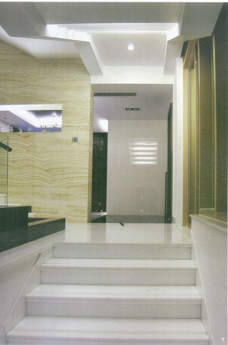
7 二层公共空间。 Common space on the second floor.