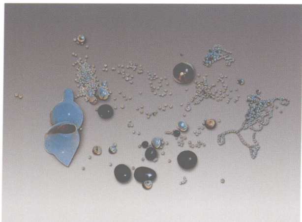
1. 明法门寺真身宝塔塔体龕内铜佛像内所藏珍珠、玛瑙串饰