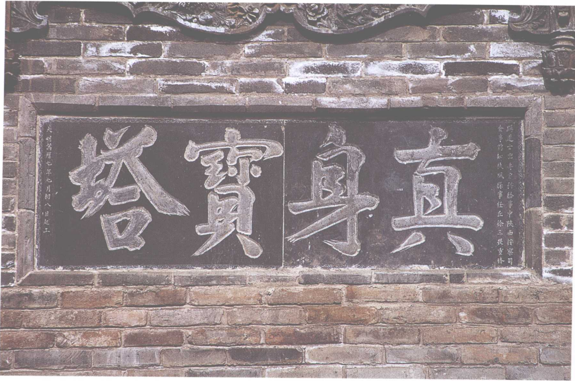
1. 明法門寺真身寶塔正南一層“真身寶塔”石匾