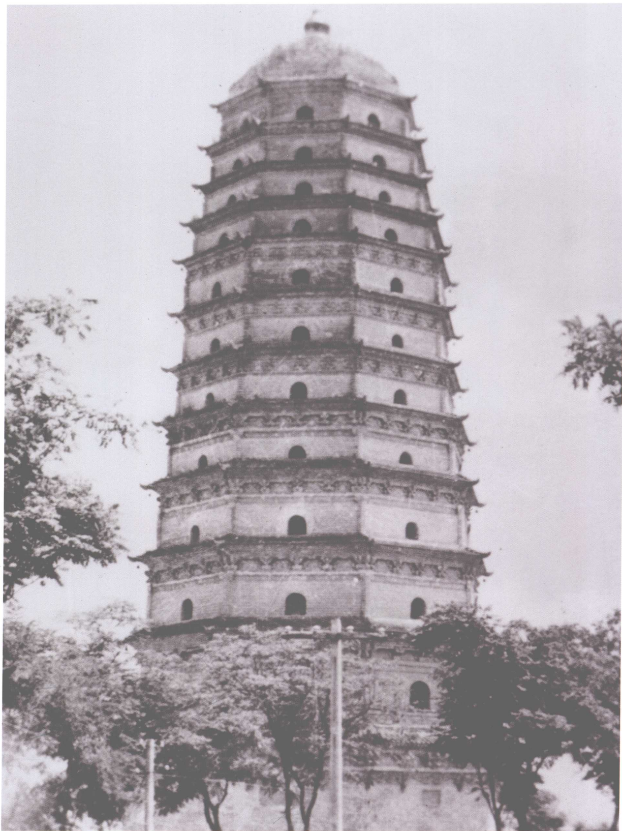
未倒塌前明法门寺真身宝塔近景（西南 - 东北）