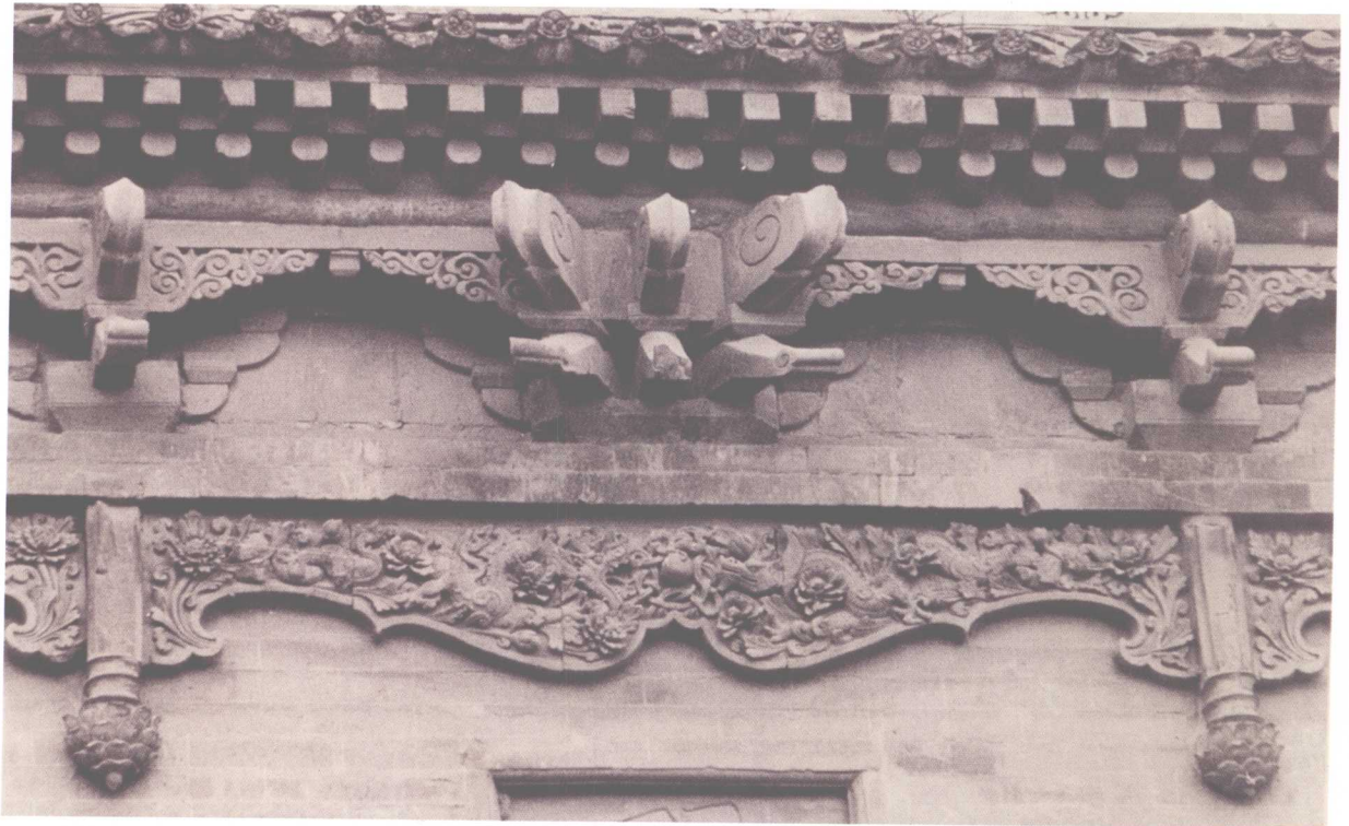
2. 明法門寺真身寶塔一層磚雕斗拱