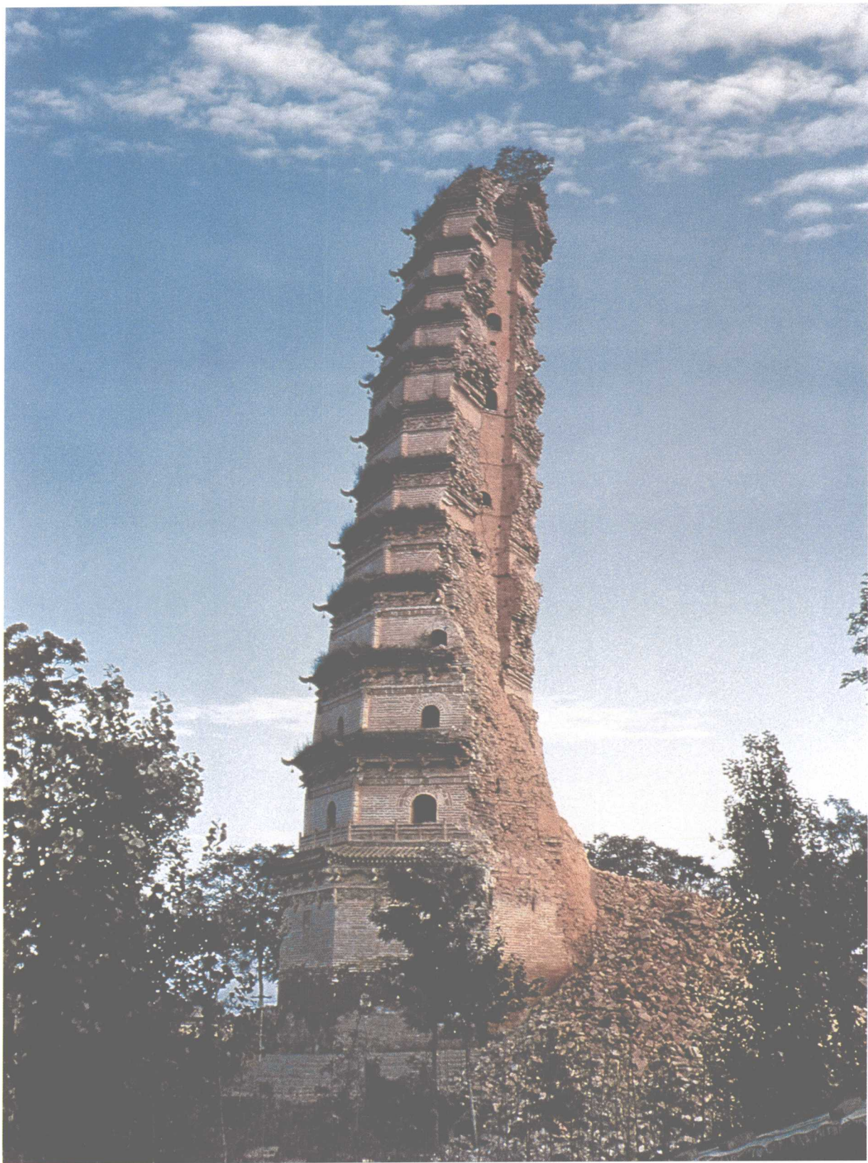
明法门寺真身宝塔崩塌情况（1981年）