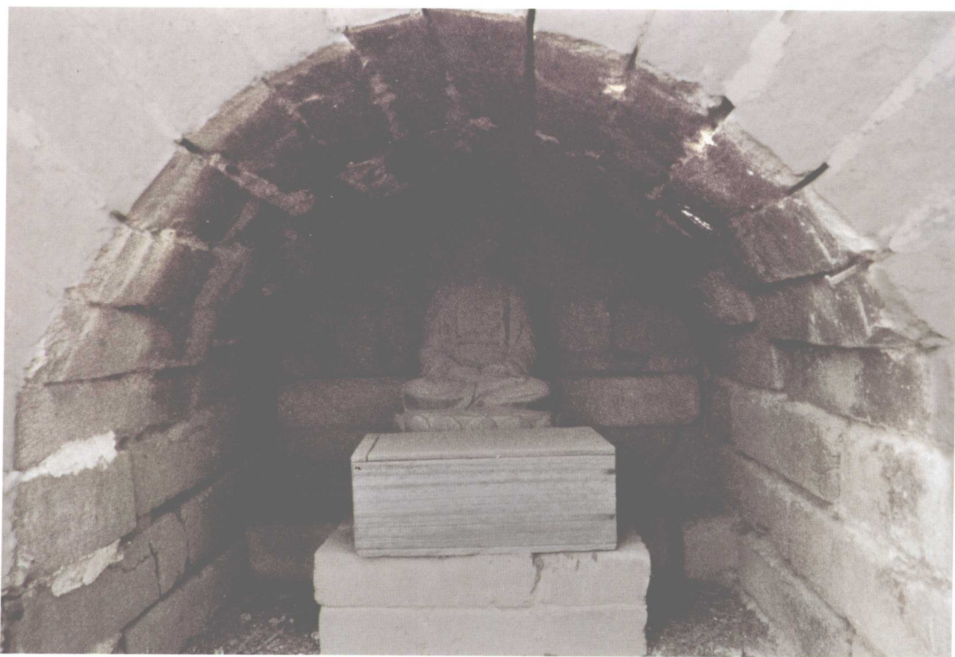
3. 明法门寺真身宝塔塔体龕内佛像佛经出土时放置情况