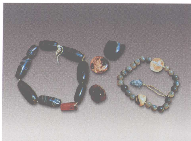
2. 明法门寺真身宝塔塔体龕内铜佛像内所藏珍珠、玛瑙串饰