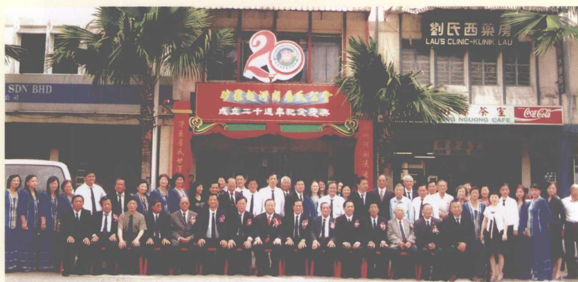
做客马来西亚 (前排左三为作者)