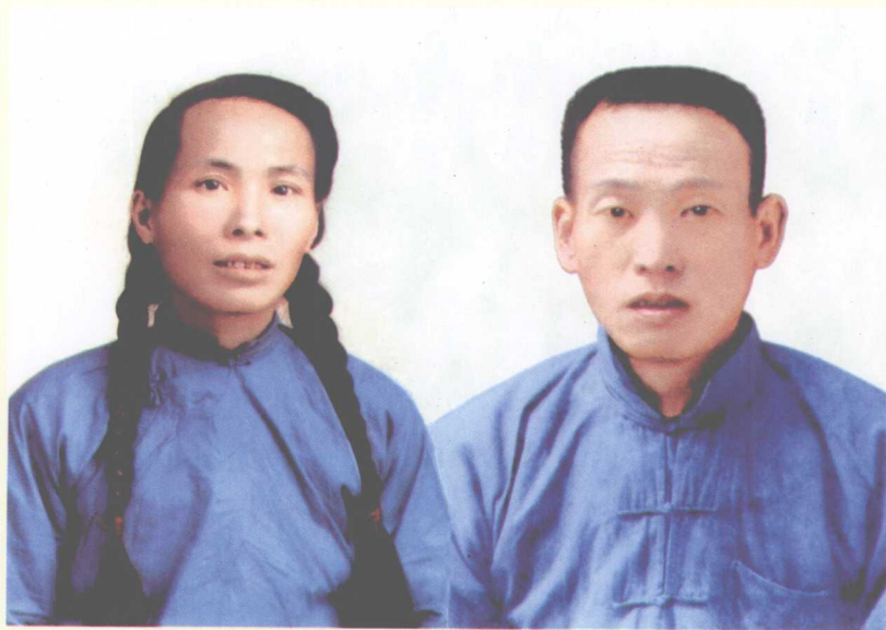
20世纪40年代父母照片