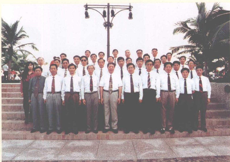
1993年新加坡行政监督高级研讨班合影 (前排右二为作者)