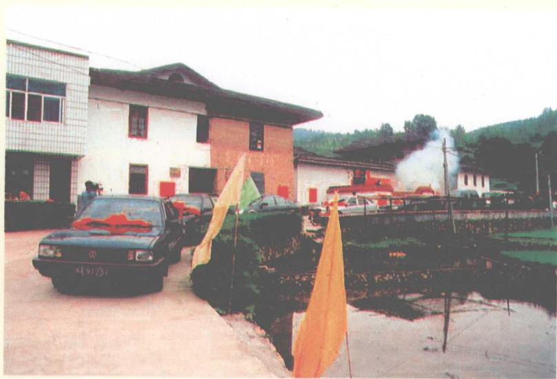
新世纪新村貌(汽车开到家门口)