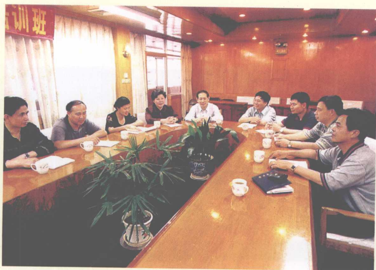
厦门湖里“三讲”工作照