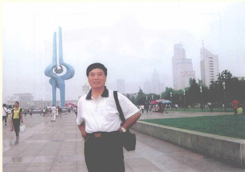
作者近照 (济南广场)