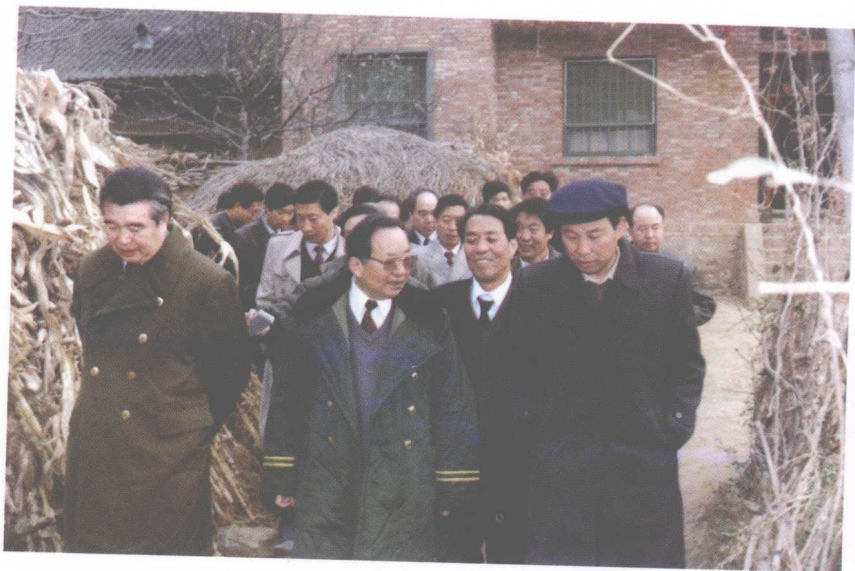
7. 1990年陪同田纪云副总理、白清才省长在商州视察工作