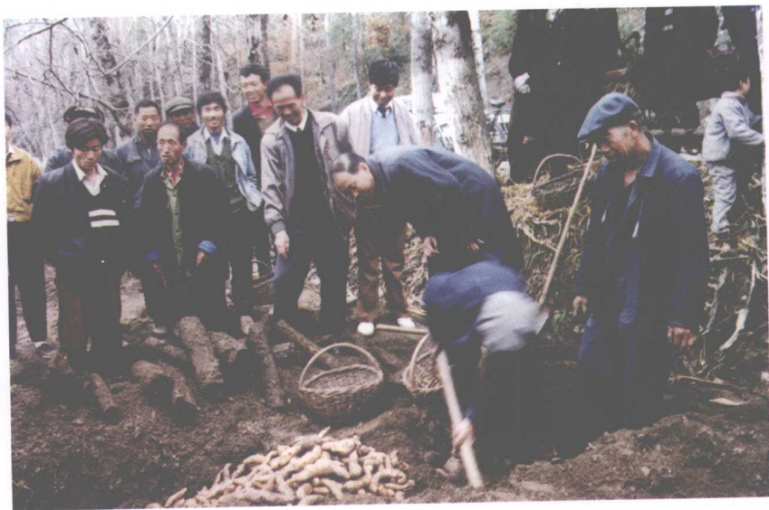
9. 1990年在商州基层调查研究