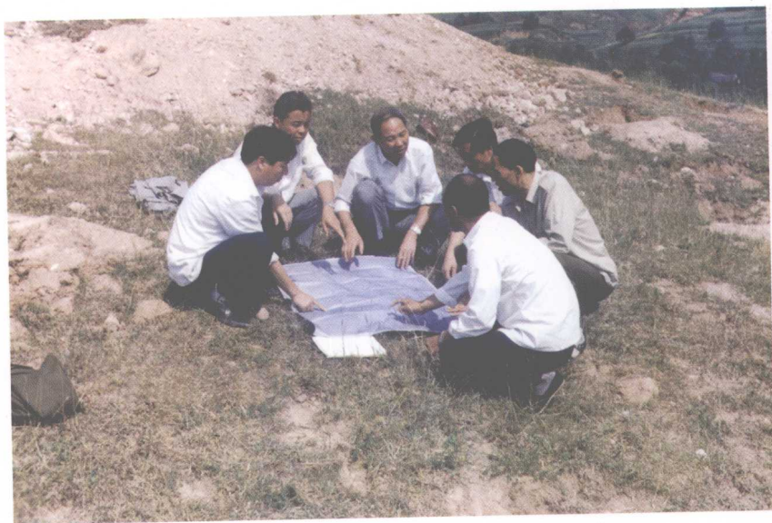
10. 1991年在商州现场规划植树造林