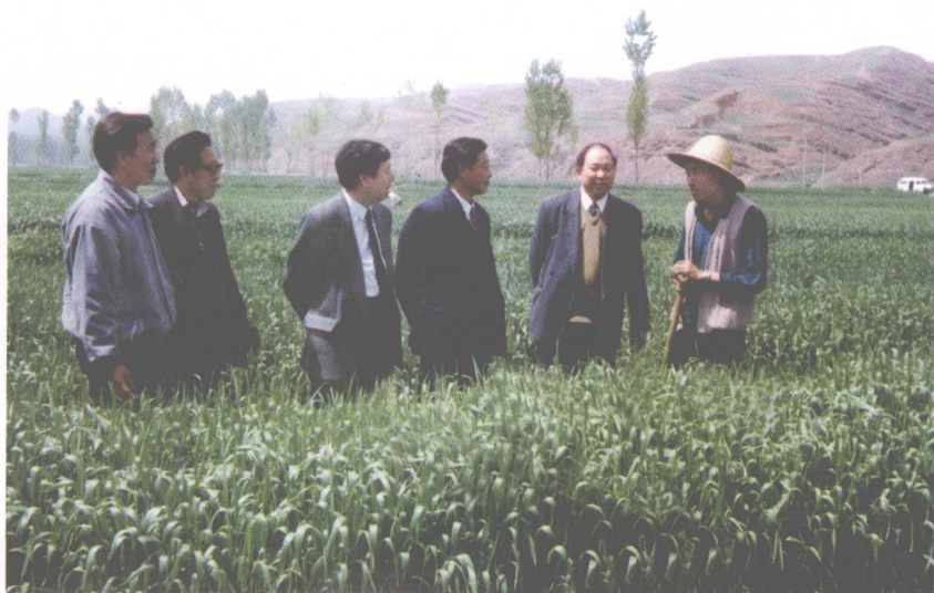
14. 1994年在商州的田间地头调研