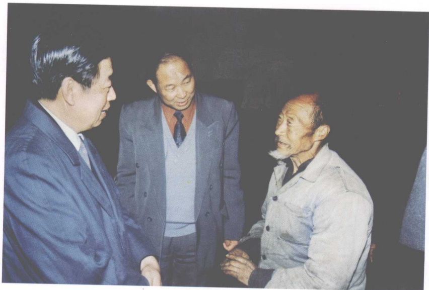
12. 1992年在商州和群众在一起