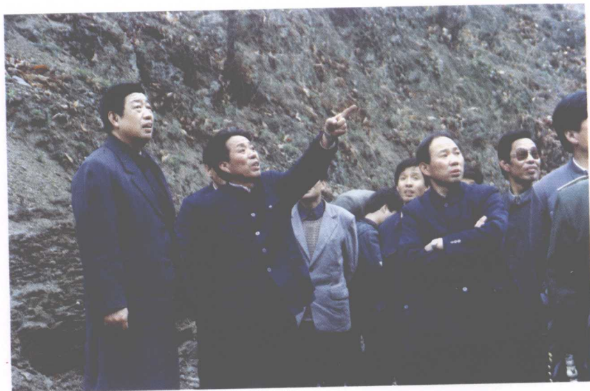
5. 1989年与商洛地委书记杨永年同志陪同省委书记张勃兴在商洛视察工作