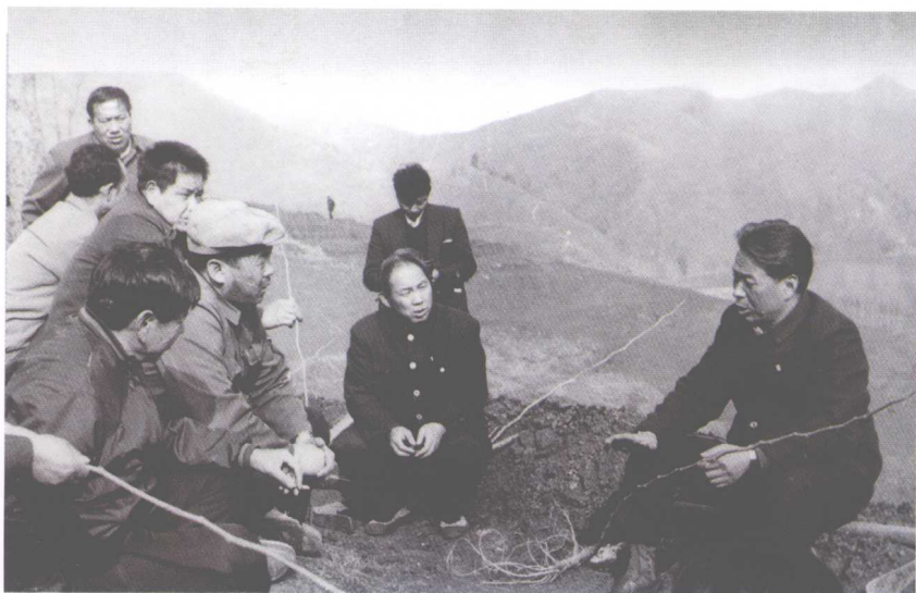
13. 1993年在商州现场研究植树造林