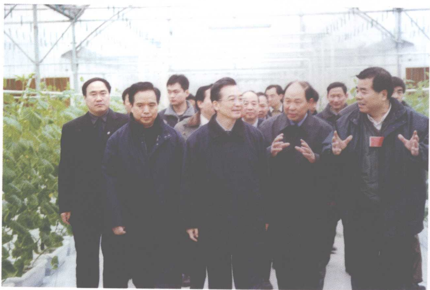
16. 2001年与省委书记李建国陪同温家宝副总理在杨凌视察工作