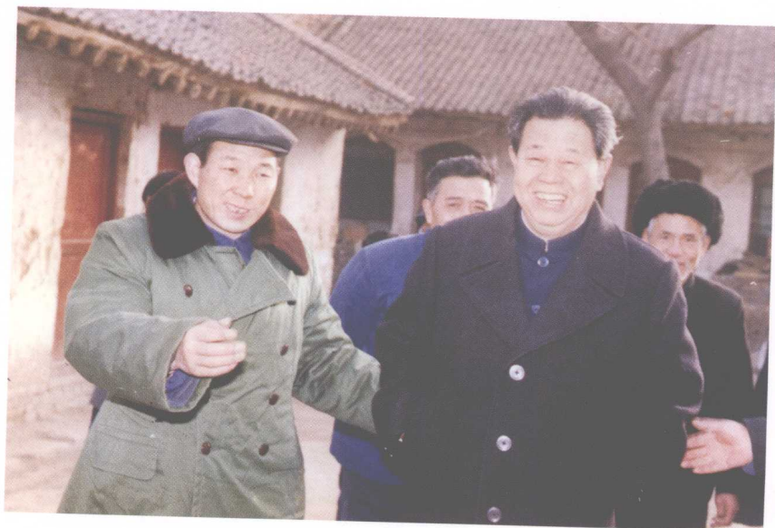
8. 1990年陪同中共中央统战部副部长江平在商州