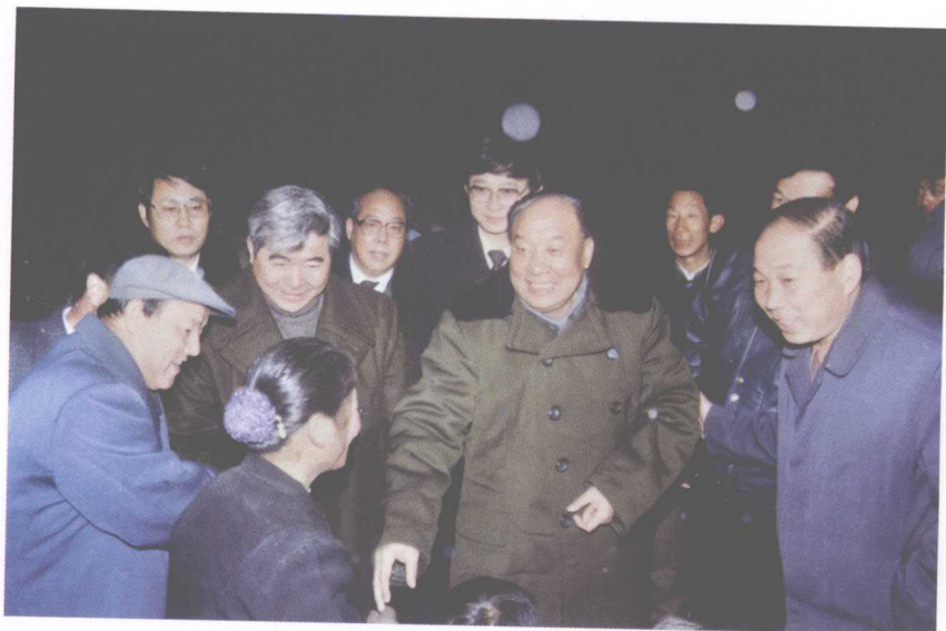
11. 1992年与商洛地委书记陈再生陪同省委书记安启元省长程安东视察工作