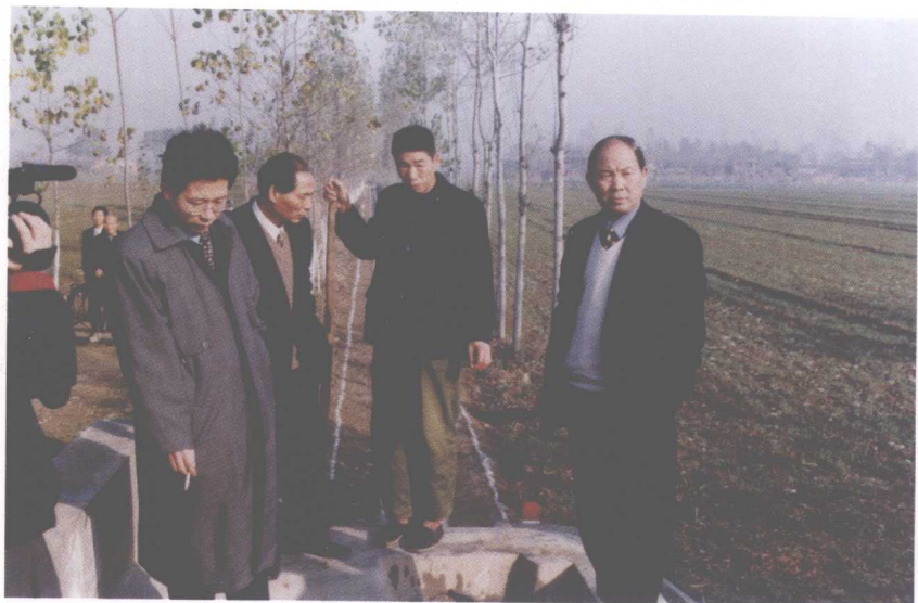
15. 1999年陪同国家农业综合开发验收组在蒲城验收农业综合开发项目