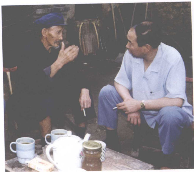
6. 1989年在商州访贫问苦