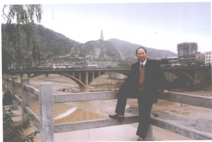
1. 1997年在调研农业产业化时在延安留影