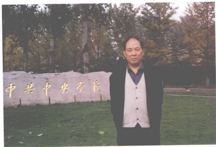
2. 2001年冬在中央党校学习时留影