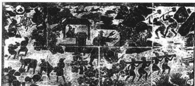
大禹治水《大禹陵砖雕》

聪明的人都是善于学习和总结的人，看到自己的父亲因治水而死，有抱负的夏禹开始总结前人及其父亲治水的经验教训。他不辞劳苦，日夜思考治理洪水的方案，操劳试验，苍天不负有心人，夏禹终于从中得到治水的好方法，即改变“水来土掩”的旧法，而采用了“凿山导流，疏通壅塞，引江河洪水入沧海”的疏导方法，从而，夏禹同他的助手契、后稷、皋陶、伯益等人带领人众，从四川的岷江开始治水，随即治理湔江、通口河（四川北川县境内）、嘉陵江（四川境内），又转向黄河、淮河、长江及富春江、钱塘江等大江流域，特别是“凿龙门”（今山河津和陕西韩城之间的龙门山，即“晋陕峡谷”）、“辟伊阙”（今河南洛阳市南12.5公里处，两山相峙如阙门，伊水径流其间）。