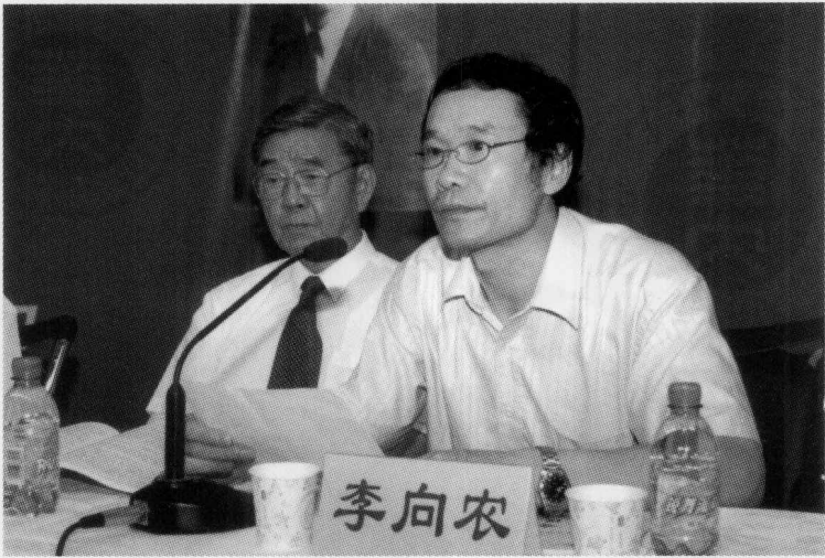
华中师范大学副校长李向农教授致开幕词