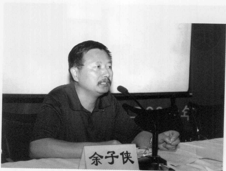
华中师范大学教育学院教育史暨比较教育所所长余子侠教授作主题发言