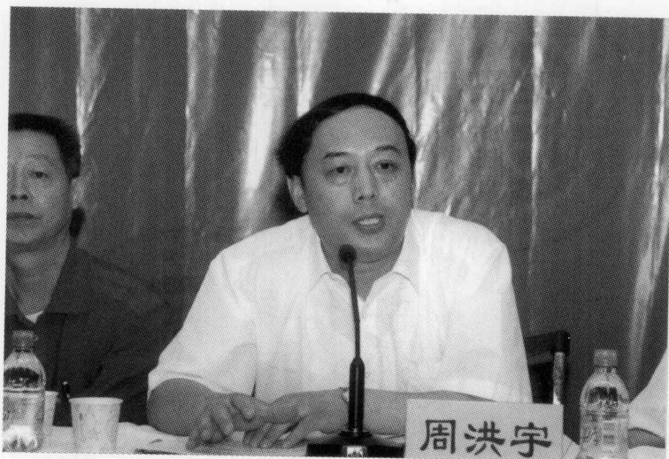
湖北省教育厅副厅长周洪宇教授讲话