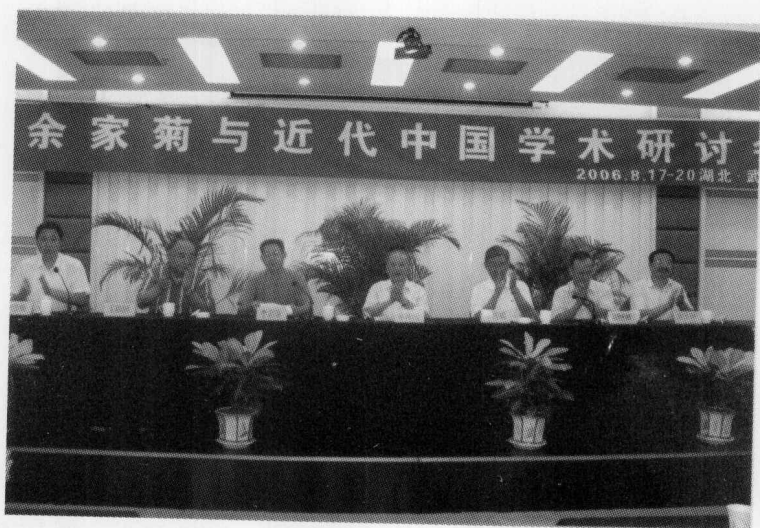
学术研讨会闭幕式主席台