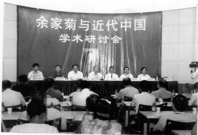
学术研讨会开幕式主席台