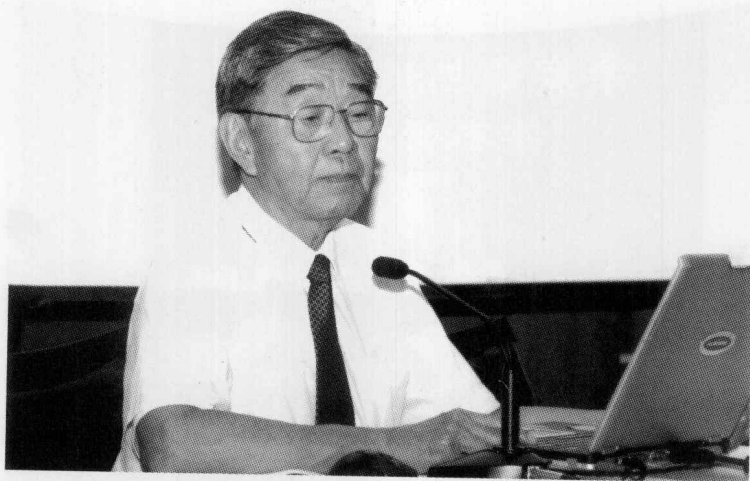
余家菊先生哲嗣台湾中央大学前校长 余传韬教授在作主题发言