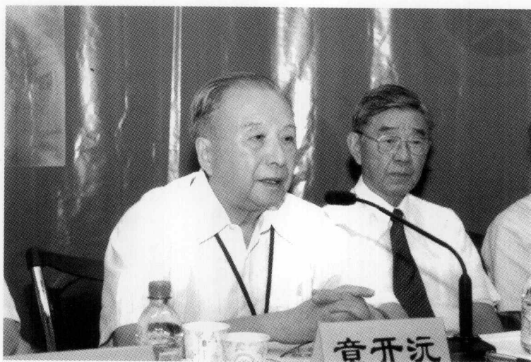
华中师范大学前校长章开沅教授讲话