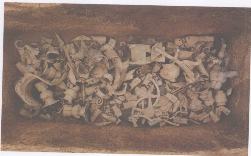
二号祭祀坑出土情况全景之二

从世界范围来看,古代对玉的使用主要在太平洋盆地的四周,最早大约在旧石器时代的晚期,但最终将玉