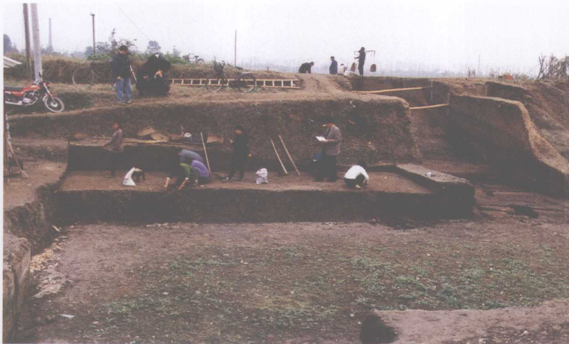
月亮湾西城墙发掘工地外景

二号坑出土的各种器物、饰品、神像、面具也经火焚烧过，但没有发现一号坑那样的烧骨渣，甚至连经火烧过的灰烬也极少。这些器物、饰品和神像除经火烧变形外，还有人为砸击毁坏的痕迹。这些气势非凡的神像和面具，庄重典雅的青铜祭器，温润精美的玉石礼器为什么会有如此的遭遇？这是迄今为止尚未完全解开的谜。