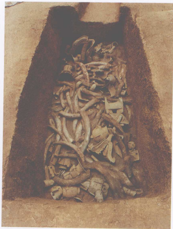
二号祭祀坑出土情况全景之一

在三星堆遗址出土的相当于商代早期的铜牌饰上有镂空的眼睛纹样，其形状和二号祭祀坑出土的菱形眼形器十分相似，上下眼眶之间有眼睫毛。出土的眼形器有菱形、两件等腰三角形组合成菱形、四件直角三角形组合成菱形等三种形式，在陶高柄豆的圈足上也刻划有眼睛的符号。另外，还出土了数件近似纵目面具眼睛的眼泡。可见，在三星堆出土的文物中有关眼睛崇拜的题材较多。蚕丛为何纵目以及有关眼睛崇拜的内涵是什么？从现代生物学的观点看，动物的眼睛长得平与凸，是与动物所处环境的光线强弱相关的。如海洋中的鱼类，生长在浅水处的鱼，眼睛平凹，而深水处的鱼，眼睛凸出。其原因在于浅水处光线较强，深水处的光线较弱，鱼类不得不通过“调焦”来分辨方向和看清物体。“蚕丛纵目”应和蜀人居住在成都平原多雨多雾的自然环境有关。蜀地夏天雨多，冬天雾大，一年四季晴朗天较少，固有“蜀犬吠日”之说。在《山海经·大荒北经》中记载有一种掌管光明之神“烛九阴”(又称“烛龙”)，其特征是“人面蛇身而赤，直目(纵目)正乘，其瞑乃晦(闭着眼睛