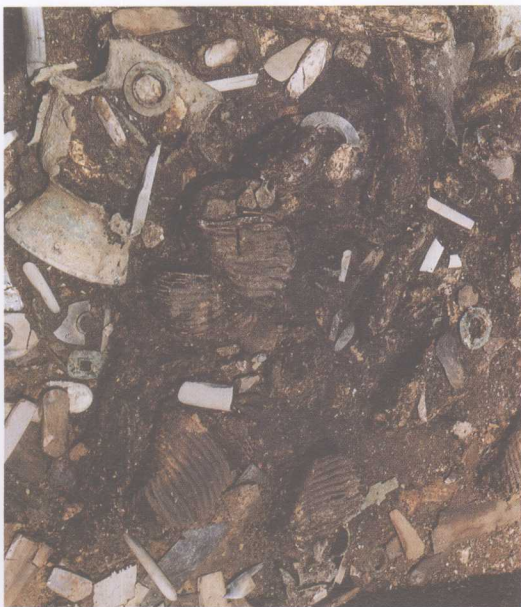
一号祭祀坑出土情况全景之一