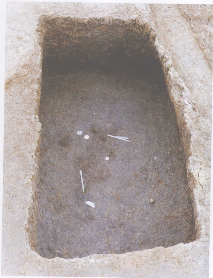
三星堆遗址仁胜村墓葬玉器出土情况

石器中很难将其截然区分开，如二号坑出土的这类器物的直径由大到小呈递减趋势，好孔直径大小相等，只是肉的宽度不同。这一方面说明在商代制作这类器物还无严格的定制，好孔直径和肉的宽度的大小应和管钻的直径有关；另一方面说明这类器物的肉宽呈递变趋势，可能和使用这类礼器与按大小顺序摆放有关。琮是古代的祭器，外方内圆，中有圆柱状穿孔，两端孔缘外凸部分，被称作“射”。琮与璧在祭祀天地中互相配合使用，故有“苍璧礼天，黄琮礼地”之说，即璧象征天空，琮象征地母(或象征女阴)。三星堆遗址出土的玉琮，较早者器身方直，射为八棱；稍晚者为圆射，或射身方圆委角。琮和其他祭祀山川的玉石礼器成组同出，可见琮同样有祭祀山川的功能。1929年出土的一件玉琮，侧面刻有三条平行线和两个类似人眼的圆圈，其形象颇似分布在以太湖流域为中心的良渚文化玉琮上的兽面纹。说明早期蜀国玉琮的文化内涵比我们想象的复杂得多。祭祀山神用玉石器作为供物，这可能是渊源于原始的自然崇拜。在古人看来，高大的山峰直耸云天，不仅是神灵上天达地的必经之路，也是神灵经常居住的地方。山上的珍禽猛兽、奇花异草、树木瓜果以及金玉石水等自然物，也归这些神灵管辖或为神灵所有。人们所获取的自然物，是神灵赐予的一