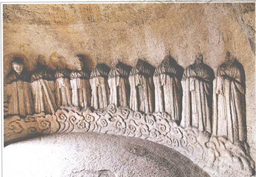
第1窟 西壁天尊群像