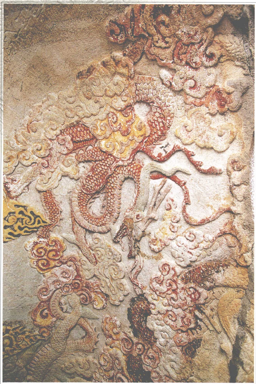
第2窟 漢井五龙祥云(局部)