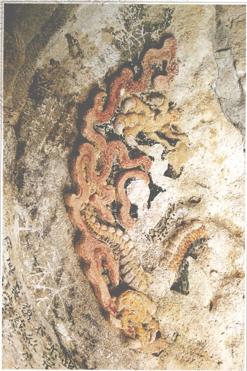
第一窟 藻井云龙纹遗迹