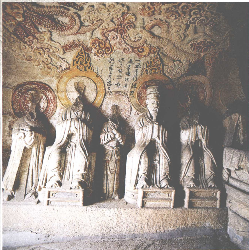
第2窟 西壁真人与侍者像