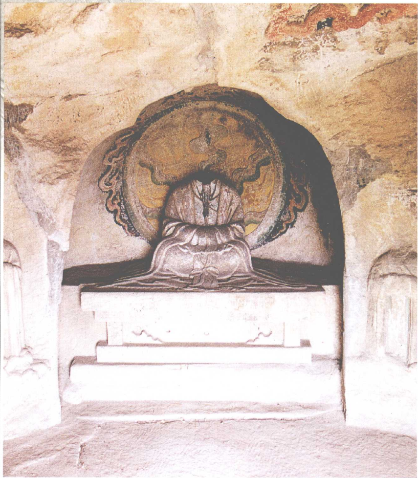
第1窟 正壁(北壁)天尊像