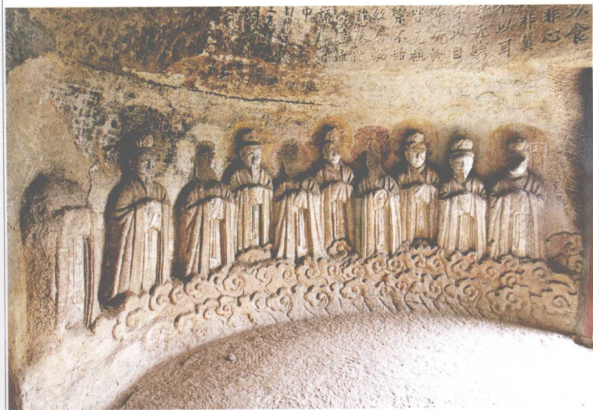
第1窟 东壁天尊群像