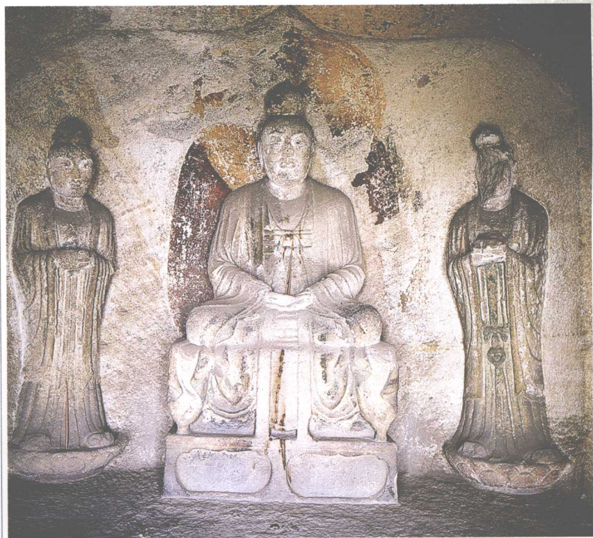
第5窟 正壁(北壁)天尊与真人像