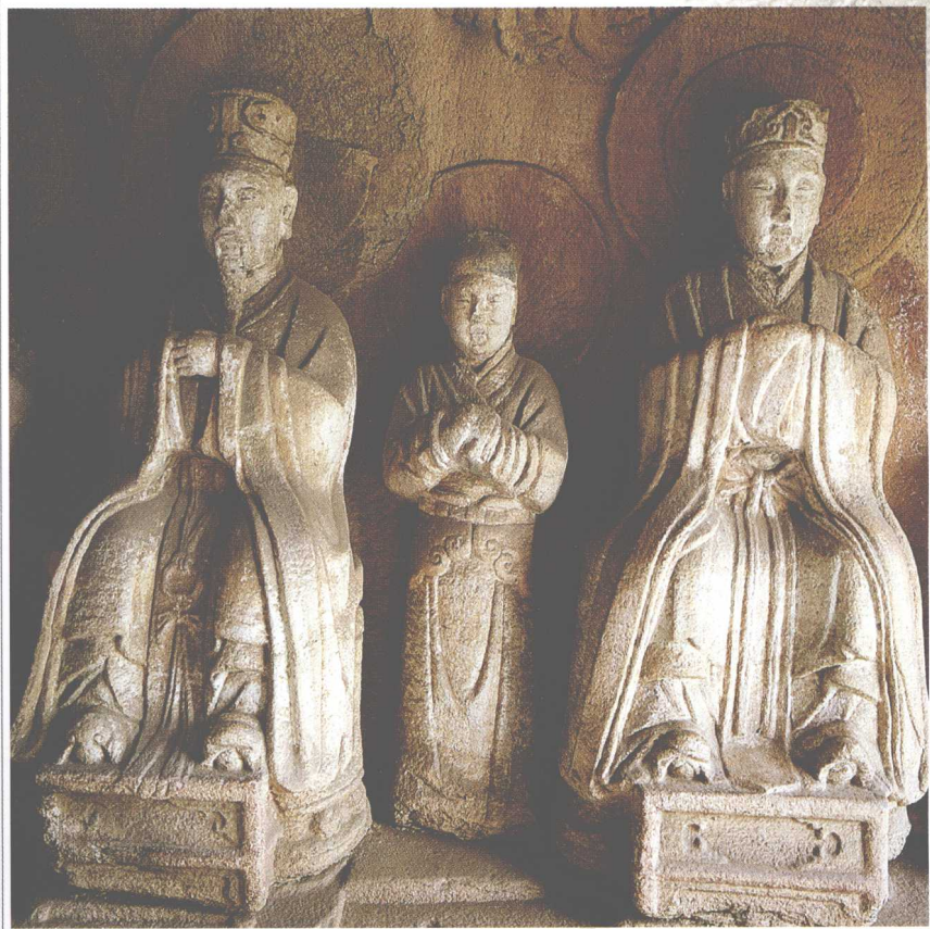
第2窟 东壁真人与侍者像(局部)