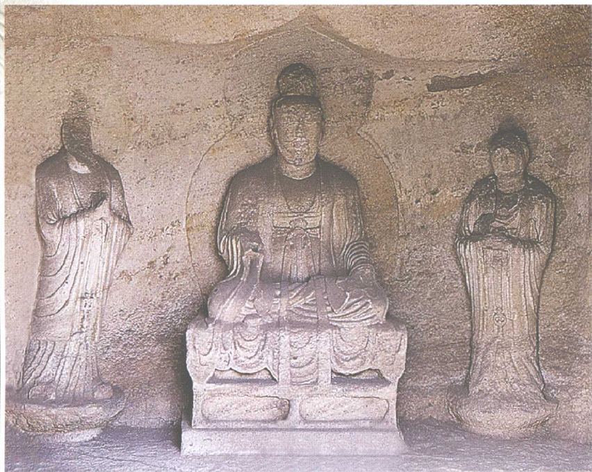
第4窟 正壁(北壁)天尊与真人像