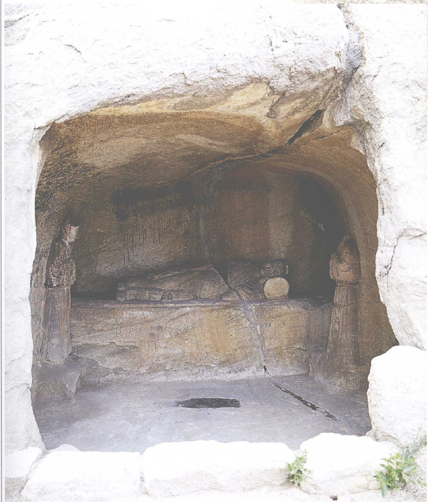
第3窟 睡卧真人与侍者像