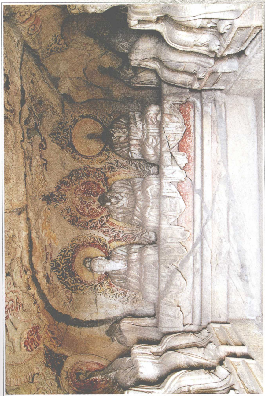
第2窟 正壁(北壁)三清像