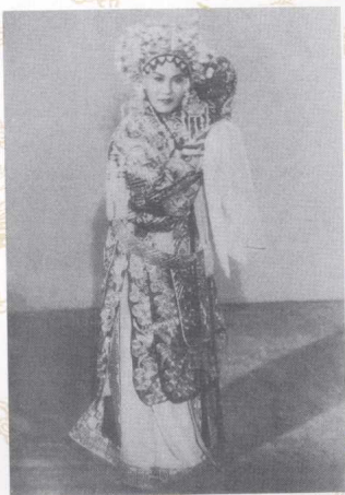
李桂云演《大登殿》剧照