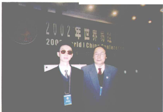
作者作者与南京大学哲学系教授、博士生导师、南京大学易学研究所所长李书有先生合影。