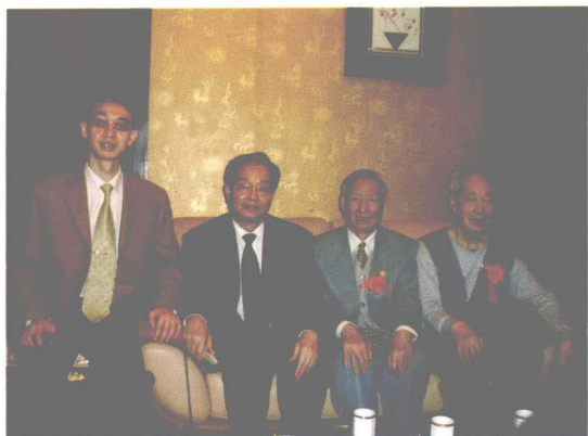
作者与武汉大学哲学学院博士生导师、教授、中国首届周易学会会长唐明邦（右二），中央党校教授邓光荣（左一），西北大学教授高亚勋（左二）合影。