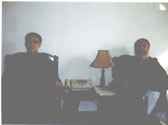
作者与中国道教协会会长、全国政协委员、 中国民族宗教事务委员会副主任 任法融先生（右）合影。