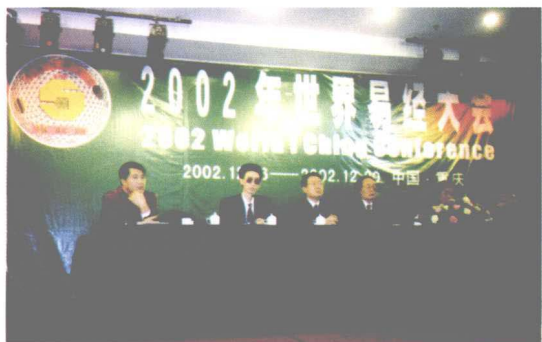
作者于二00二年在重庆涪陵区人民政府、南京大学易学研究所等单位举办的世界易经大会主席台上宣讲学术论文。