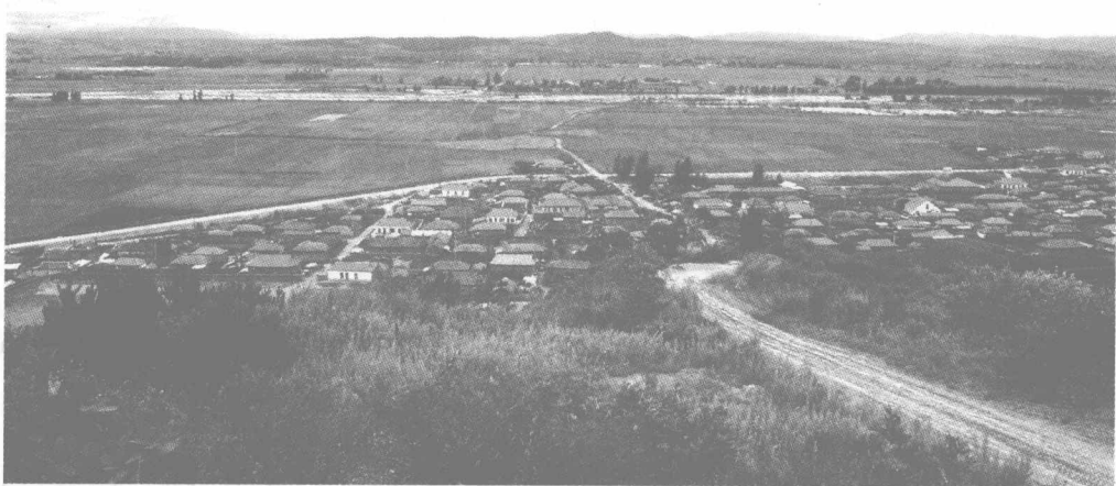
吉林省延边朝鲜族自治州龙井市龙山村村落全景（夏季）