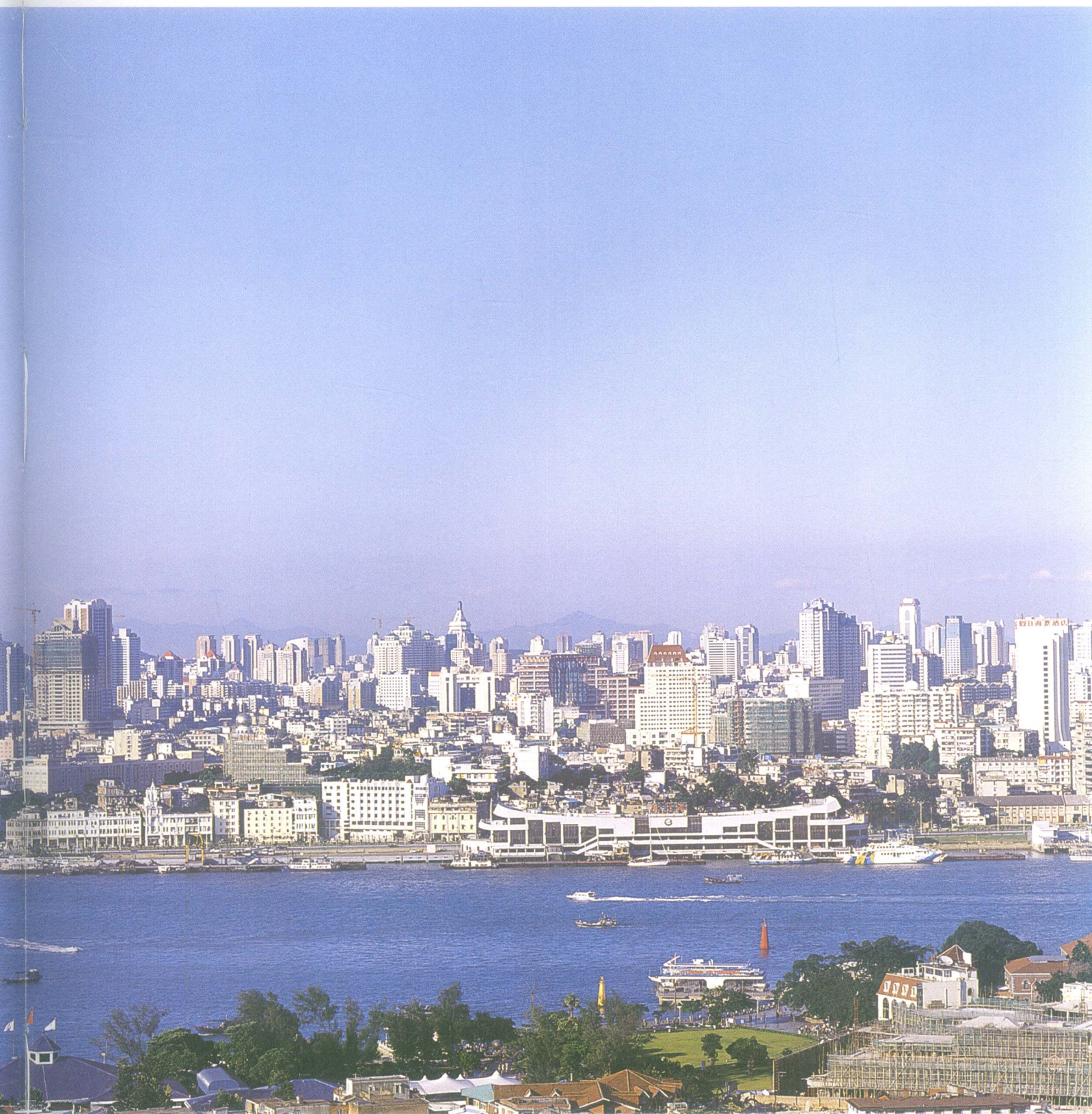
海中有城，城中有海