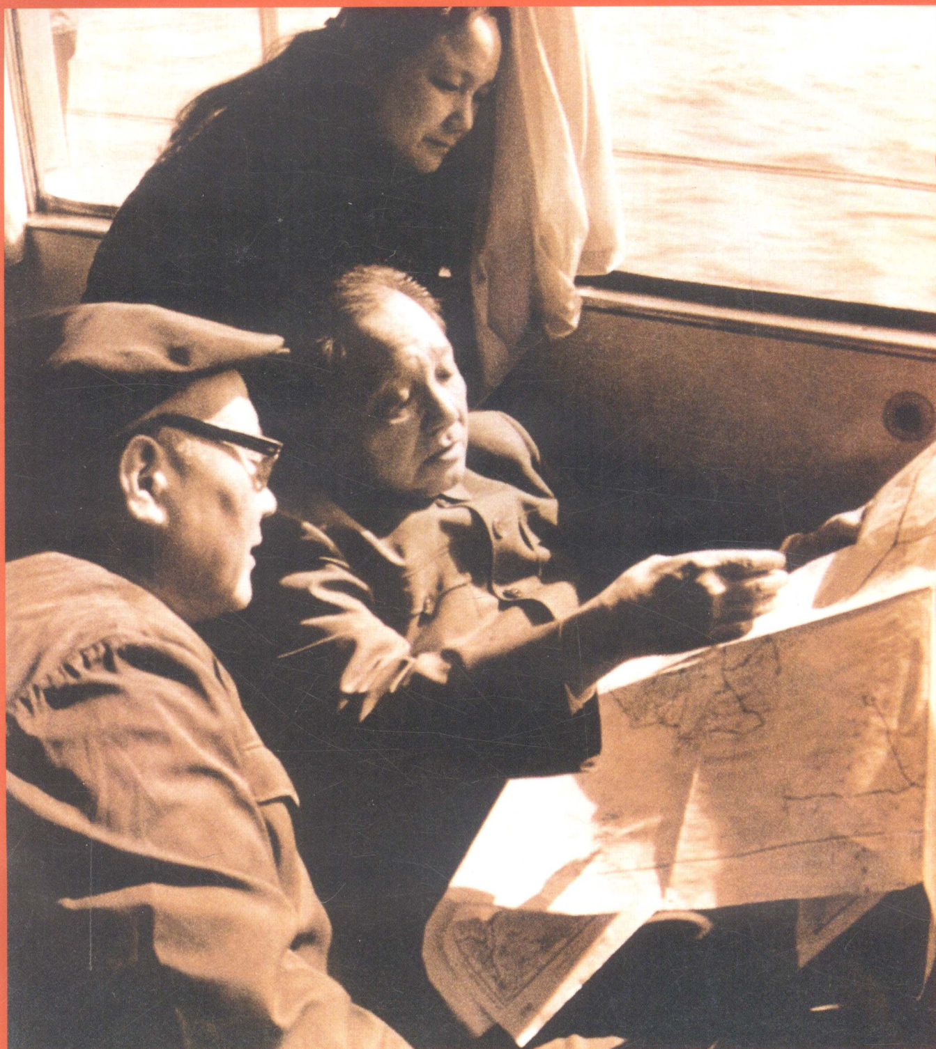
邓小平同志在厦门“鹭江”号船上，听取省、市领导汇报，研究特区范围扩大到全岛问题