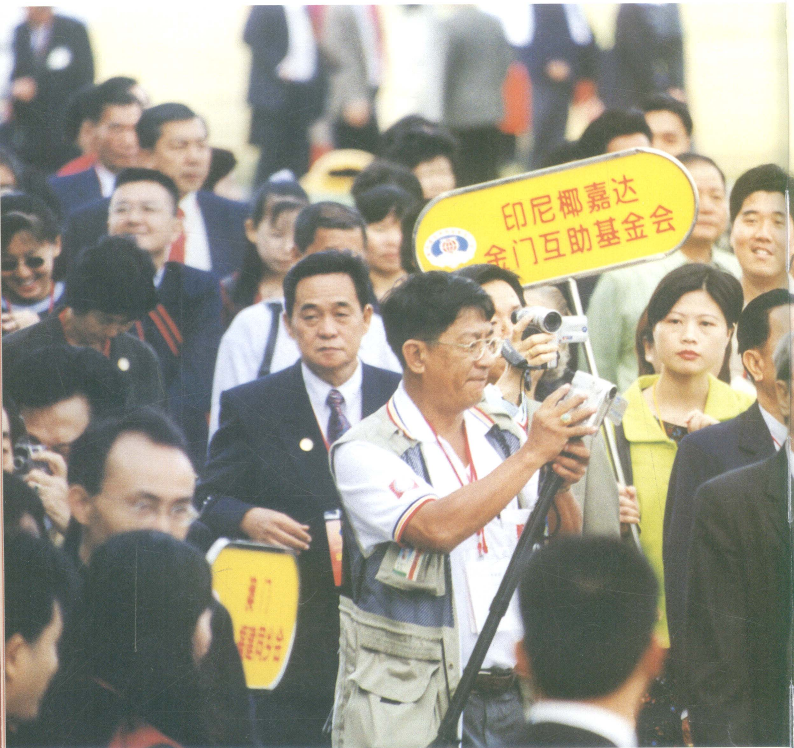
海外乡亲，厦门乡情