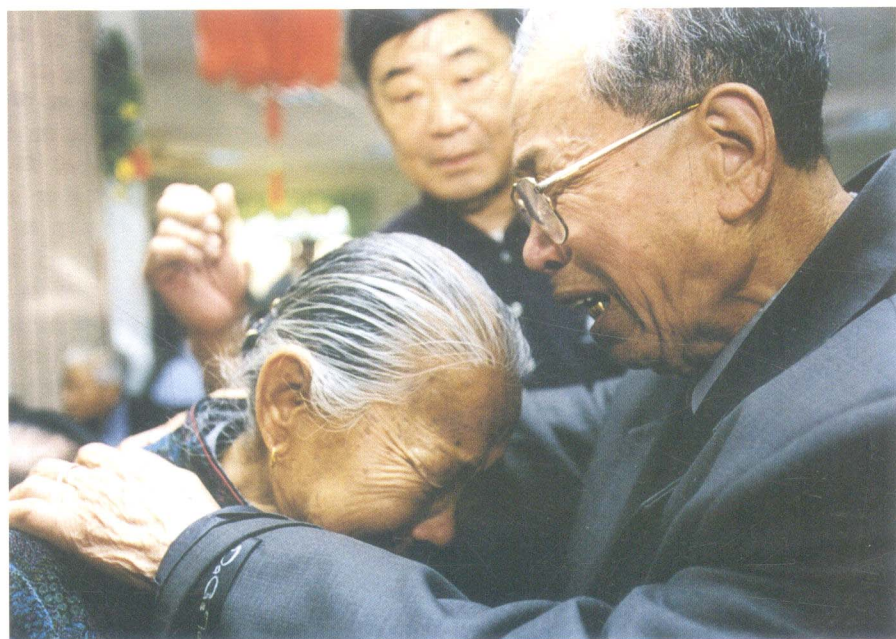
隔不断的两岸情