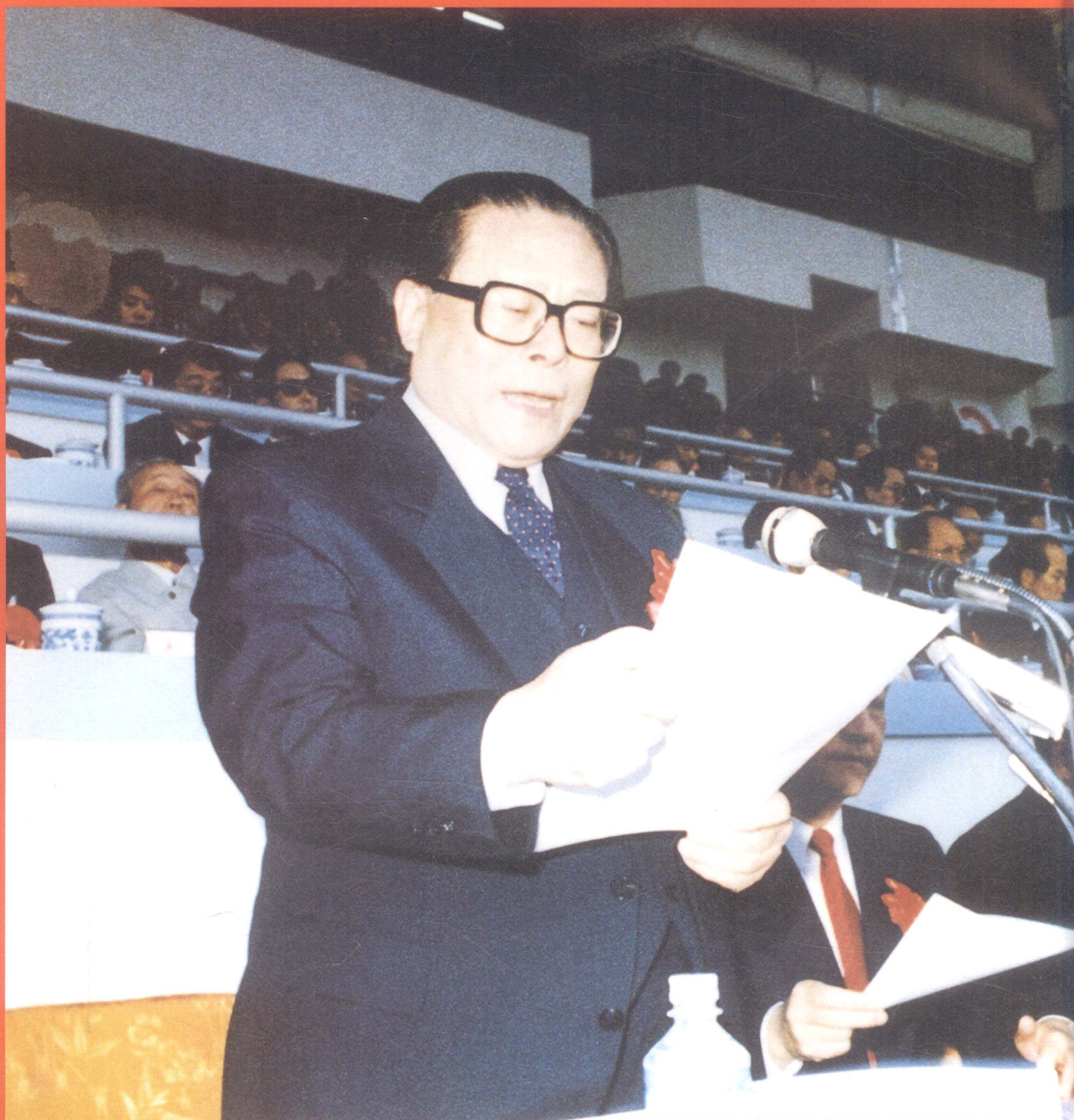
江泽民同志在厦门经济特区建设十周年庆祝大会上发表重要讲话