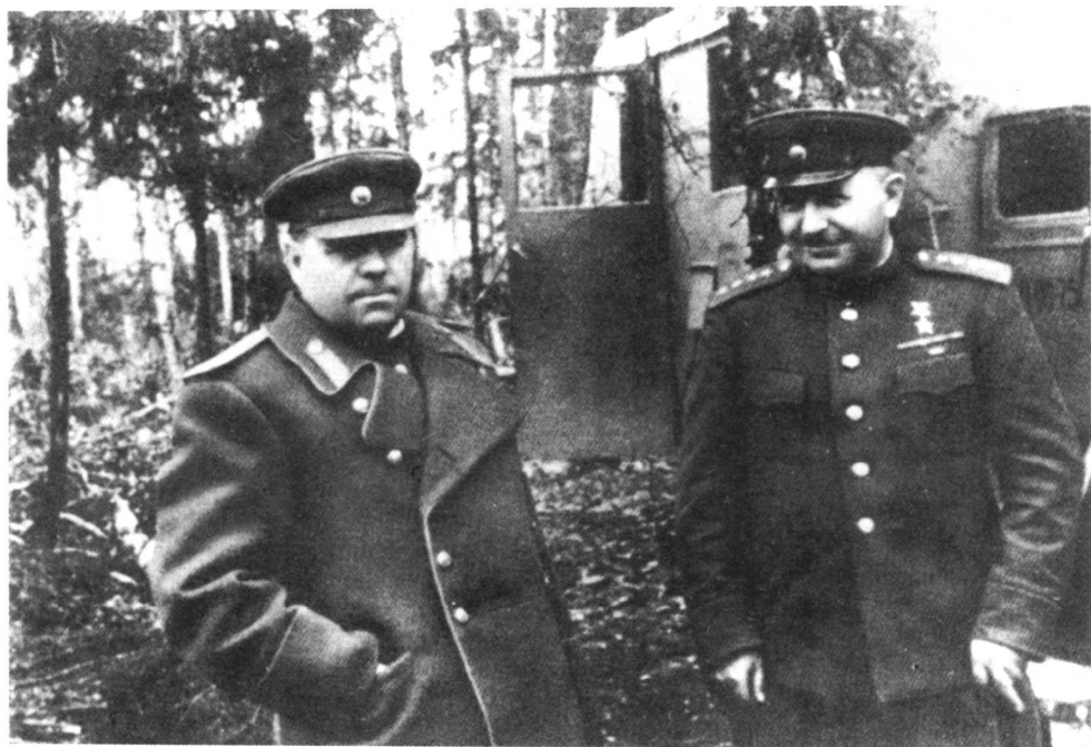
巴格拉米扬与华西列夫斯基元帅