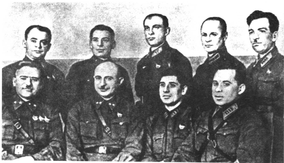
西南方面军司令部部分参谋人员(前排左二为巴格拉米扬)1941年