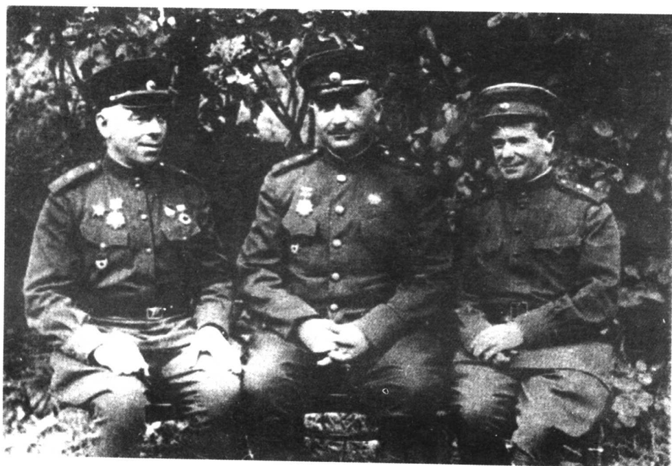
从左至右, 近卫第11集团军军事委员会委员库里克委近卫第11集团军司令员巴格拉米扬, 近卫第11集团军副司令员拉扎列维奇