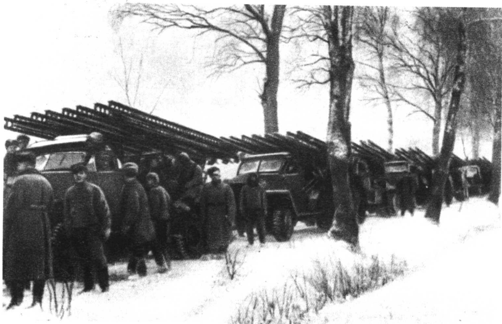
“卡秋沙”向前线开进