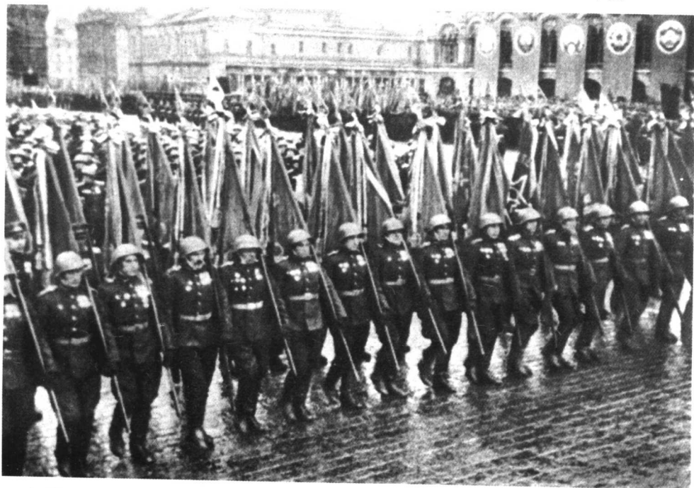
胜利阅兵式。旗手在前进