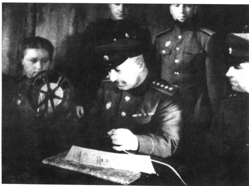
巴格拉米扬(中)在方面军司令部阅读电文