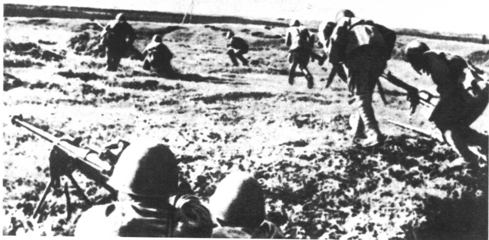
坦克歼击手向战斗阵地前进。西南方面军。1942年6月