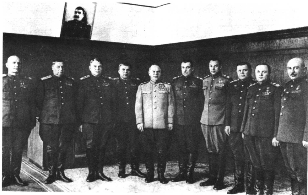
方面军司令员(从左至右): 科涅夫、托尔布欣、华西列夫斯基、马利诺夫斯基、朱可夫、戈沃罗夫、罗科索夫斯基、叶廖缅科、梅列茨科夫、巴格拉米扬