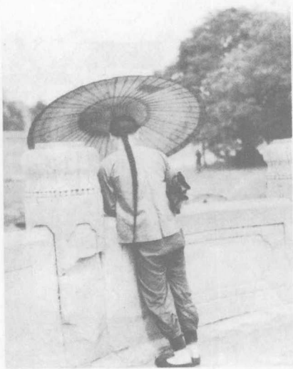
晚清下层社会男子服装

老北京男子特别是满族人，无论长幼一年四季都戴帽子。老北京人的帽子，可以分为礼帽、便帽、毡帽、风帽等几种。礼帽可分为暖帽和凉帽两种。暖帽是深秋以后戴的帽子，由缎子、呢绒或毡子制成，圆形，周围翻卷起两寸多宽的帽檐，上仰形的帽