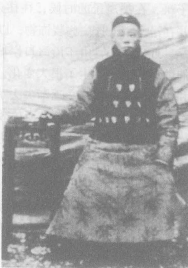
头戴瓜皮小帽、身穿长袍马褂的著名京剧演员谭鑫培。

檐可以镶上皮毛、呢子和青绒。北京不如东北那么冷，一般只镶青呢子或青绒就行了，但也有人镶貂皮、獭皮、狍皮、灰鼠皮的。凉帽一般在立夏以前换上，圆锥形，用藤、草、竹编成。一般社会上层富贵者用得勒苏草（或称玉草）编成，而一般人则用藤丝或竹丝编成凉帽。农民等下层劳动群众热天则戴一种笠帽，用藤、竹或麦秸编制，圆顶，周围有宽檐伸出。便帽，也叫小帽、瓜皮帽、帽头儿。便帽由六瓣上尖下宽的面料缝制而成，底片只用织金缎包个窄边或镶上一寸来宽的小檐。便帽一般多为黑色，根据季节