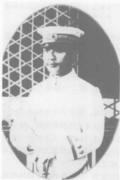
穿着洋装的晚清权贵良弼

西洋服饰的传入，改变了老北京的服装质地。早在清朝中期，西洋呢子已经悄悄进入了北京显贵人家，受到了他们的喜好，有诗云：“纱袍颜色米汤娇，褂面洋毡胜紫貂。”光绪中叶，北京的布店开始销售舶来纺织品，由于其价廉物美，日益为人们所喜爱。到1900年以后，据1932年北平社会局编《北平市工商业概况》介绍，当时“外贸风行，土布渐归淘汰，布商之兼营洋布者十有八九”。进口呢绒逐