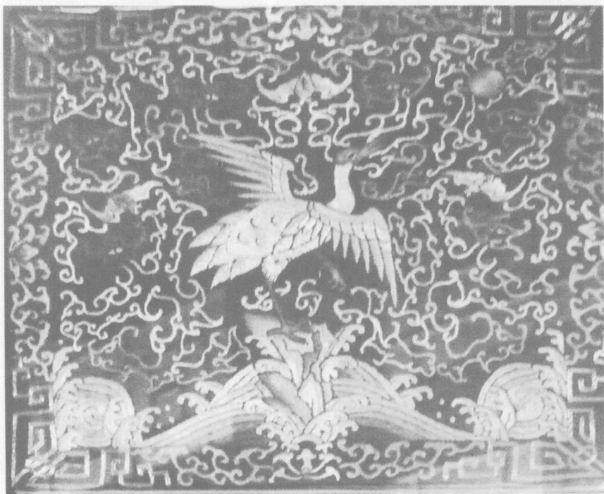
清朝一品文官的补服

历代官服都很重视等级尊卑，秩序井然，不得僭越。清代也不例外，最能体现此特点的便是顶戴和补服。顶戴，俗称“顶子”，指品官所戴朝冠顶部镶嵌的宝石。按照清朝制度，从皇帝到官员均须在所戴冠顶安放一个表示本人品级的顶戴。皇帝本人采用大东珠，文武官员一品为红宝石，二品珊瑚，三品珊瑚（文）、蓝宝石（武），四品青金石，五品水晶，六品砗磲，七品素金等。补服，又称“补褂”、