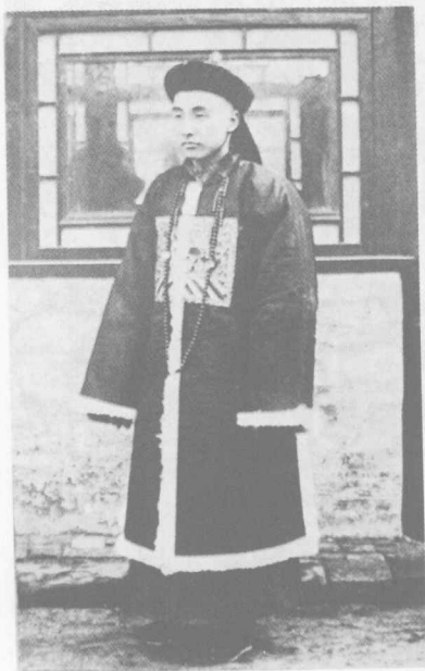
穿着冬季官服的清朝官员

受到了很大冲击。由于政治腐败，卖官鬻爵成风，各种僭越的事情在服饰方面层出不穷。过去只有有军功或爵位者才能佩戴的花翎，到清末只要肯花钱，多小的官都能戴上。香色、团蟒、金绣、彩绣、狐皮等禁止平民使用的物事，富有之家尽可随意采用。甚至只有宗室贵族才可以穿的四开叉长袍，也有人敢堂而皇之地穿到大街上去。如果被人发现，只要诡称是某个王爷所赏赐，由于难于稽查，官府只得听之任之。甲午战争后，社会上服满制者渐渐减少，从宫中、道府以上高官以至普通士兵，均不再讲究服用满洲服制。落后的满洲官服制度，已经处