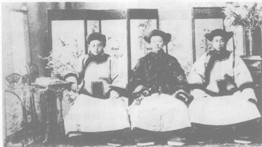
晚清上等家庭男子服饰