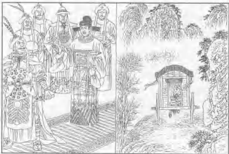
10. 徐麒，字木中，于洪武年间受郡中荐举，应皇帝颁发的命令文告，去蜀地（今四川省）劝说羌族人归顺大明王朝。功成还京，得到朝廷的赞赏，准备授予官职，但徐麒上章力辞，返回梧藤，隐居乡野。