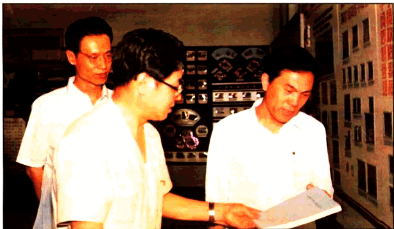
原共青团中央第一书记、全国政协副主席、中央统战部部长王兆国（左二）、原团中央第一书记、国家人事部部长宋德福（左一）与陕西青年管理干部学院院长郝玉琦（左三）谈教材建设。