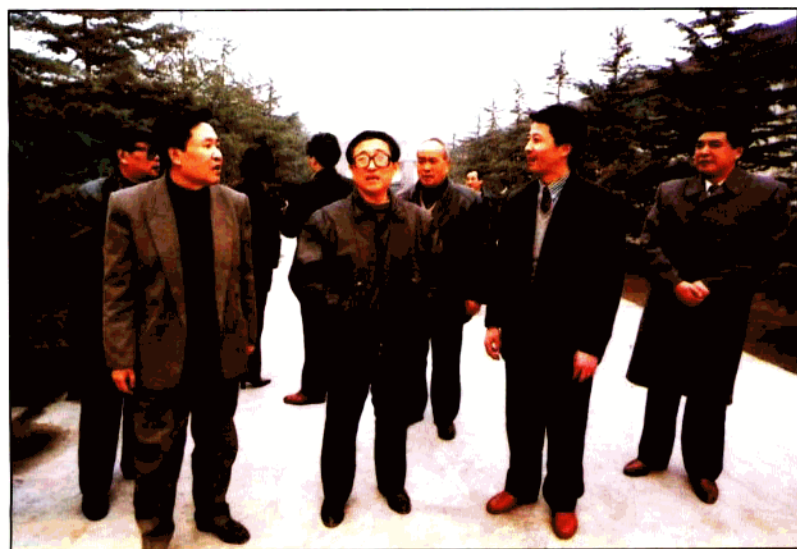
中共陕西省委副书记、陕西省人民政府常务副省长贾治邦（左三）在西安永德信企业集团考察时听取该公司董事长、总经理、省优秀青年企业家陕西青年管理干部学院毕业学员刘耀辉同志（右二）关于企业发展情况的汇报。