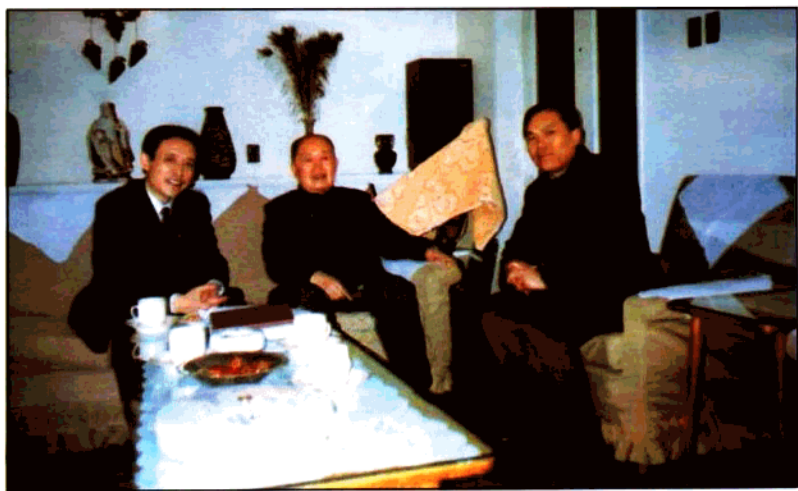
原全国政协副主席马文瑞（左二）在北京会见原共青团陕西省委书记蒲长城（左一）、陕西青年管理干部学院院长郝玉琦（左三），听取陕西团的工作和学院工作汇报并作重要指示。