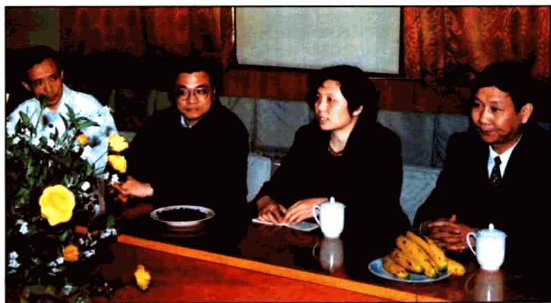
原共青团中央第一书记李克强（左二）在共青团陕西省委书记蒲长城（左一）、陕西青年管理干部学院副院长沈波（左三）、张嘉林（左四）陪同下检查指导学院工作。