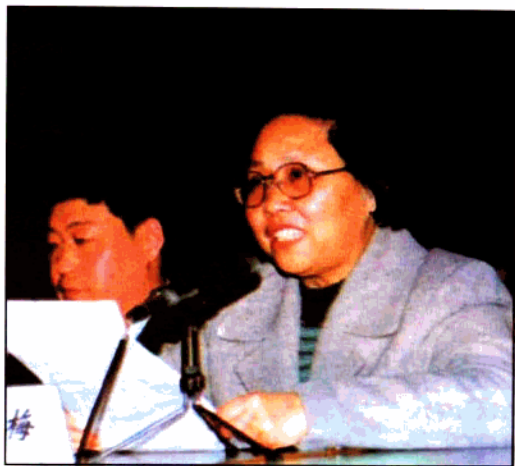
中共陕西省委副书记范肖梅在共青团陕西省第九次代表大会上讲话。