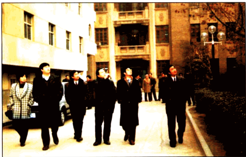
共青团中央第一书记周强（左五）、组织部长乔保平（左六）在团陕西省委书记田杰（左二）、陕西青年管理干部学院院长郝玉琦（左四）、副院长沈波（左一）、张嘉林（左三）陪同下检查指导学院工作。