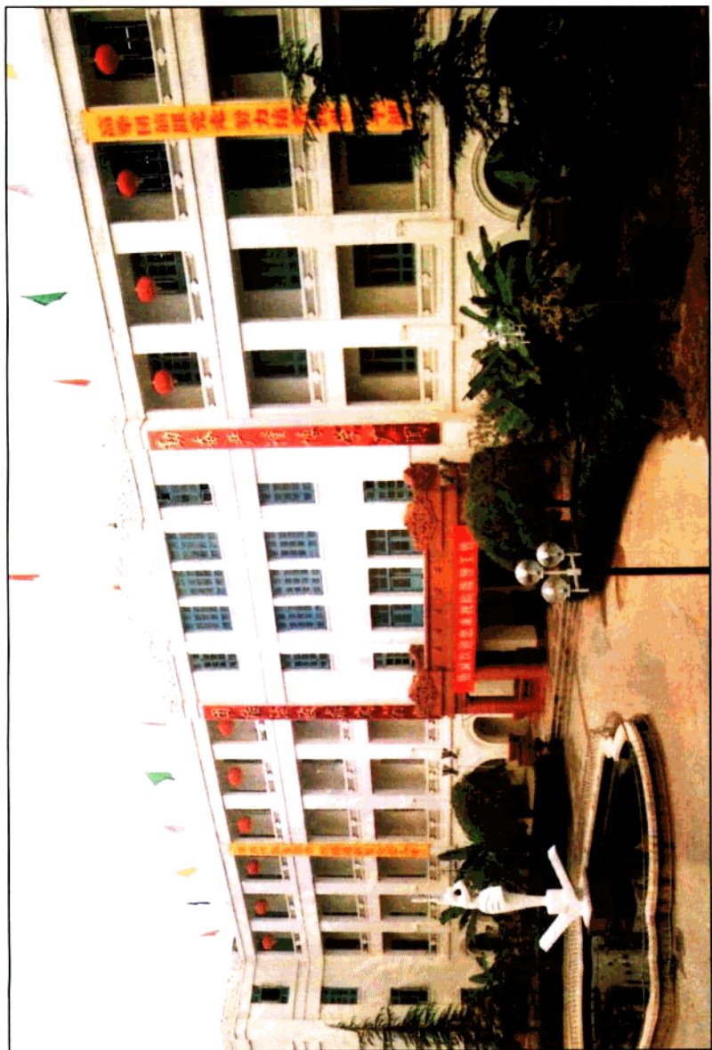
陕西青年管理干部学院教学大楼