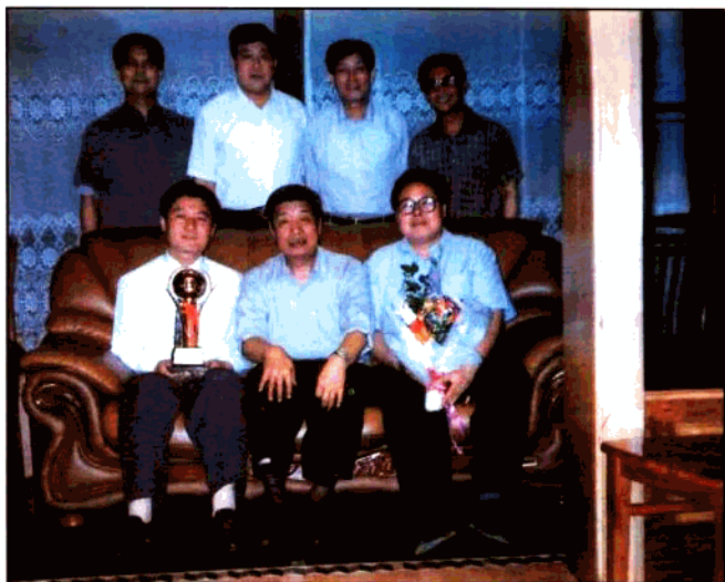
全国政协常委、原中共陕西省委书记、省人大常委会主任张勃兴（前排中）接见陕西青年管理干部学院毕业学员、核工业部21公司党委书记、1998年省十届“十大杰出青年”李清堂（前排左一），参加接见的有省人大办公厅副主任王晓福（后排左一）、团省委书记田杰（后排左二）、国防科工委书记张涛（后排左三）等。