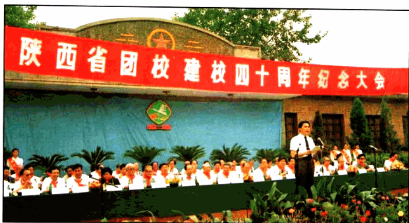
陕西省团校建校40周年纪念大会盛况。主席团成员有省委、省人大、省政府、省政协领导，历任团省委书记，省团校校长，学院客座教授，有关厅局领导和社会知名人士等。