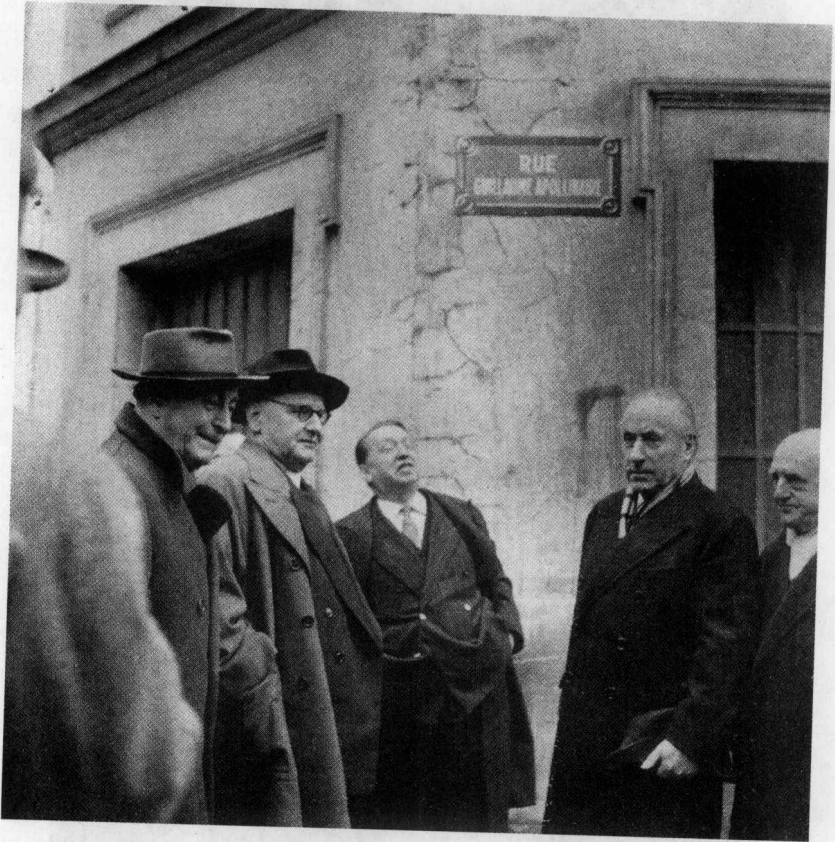
吉约姆·阿波利奈尔街，老友缅怀（1951年11月9日）