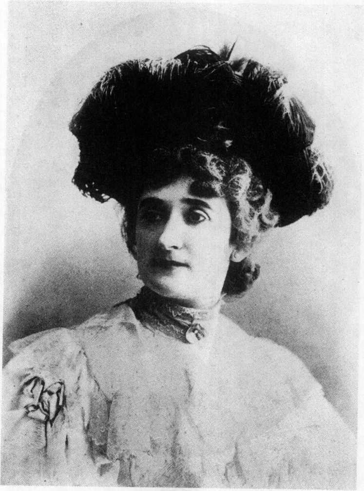
阿波利奈尔的母亲安棋莉卡·德·科斯特罗维斯基