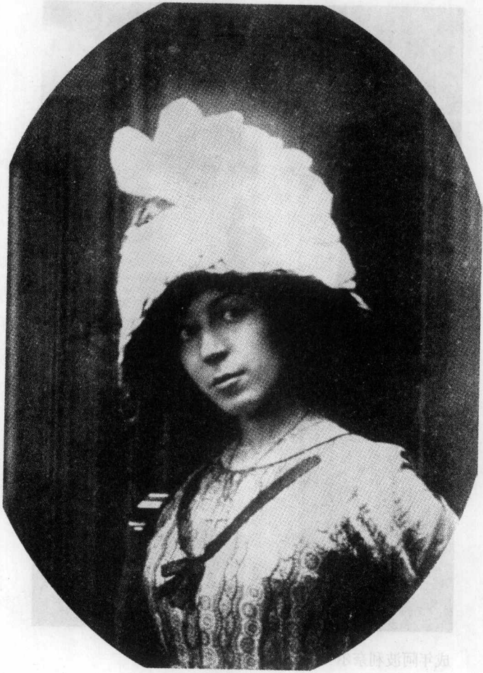
玛利亚·洛朗辛，画家，阿波利奈尔的女友