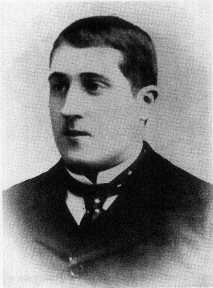
青年阿波利奈尔 (1900年)