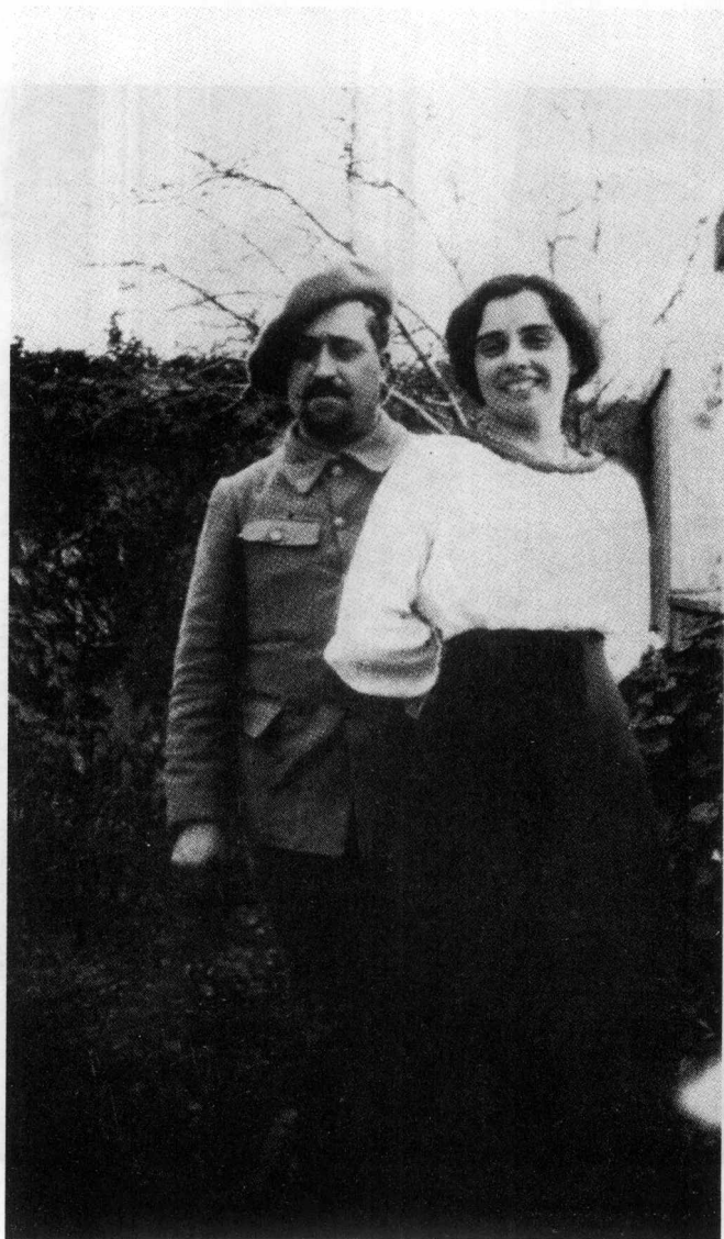
阿波利奈尔和女友玛德莱娜（1915年）