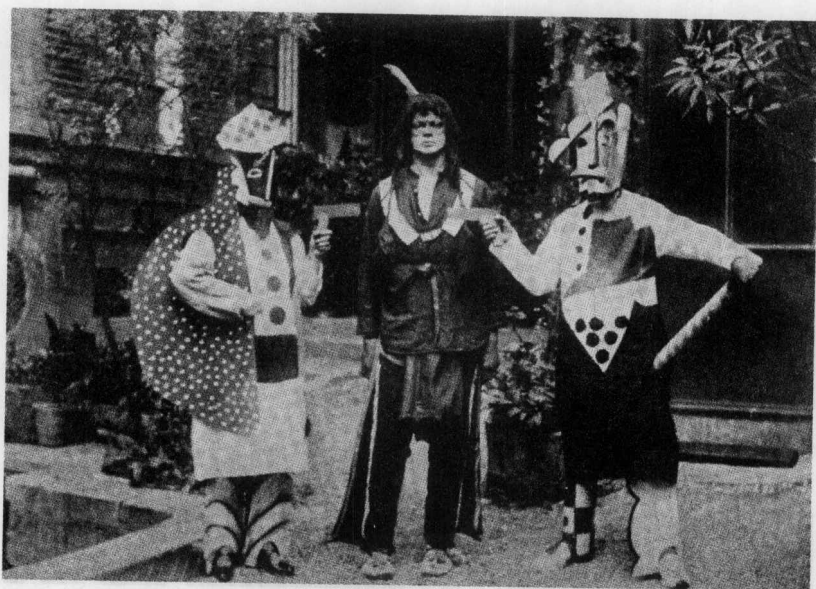
超现实主义第一部剧作《蒂蕾齐娅的乳房》剧照