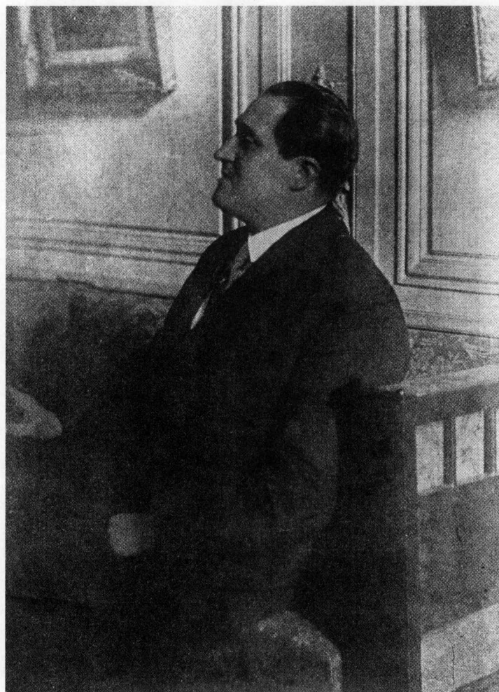
在文学和艺术界确立地位的阿波利奈尔（1914年）