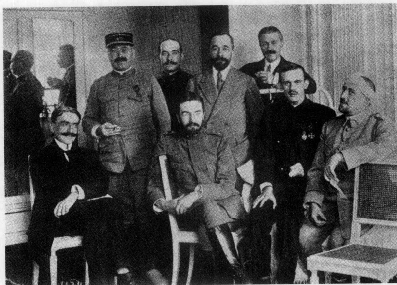
阿波利奈尔和他的伙伴在医院（1916年）