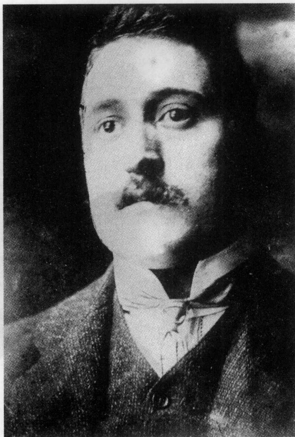
成年阿波利奈尔 (1906 年)