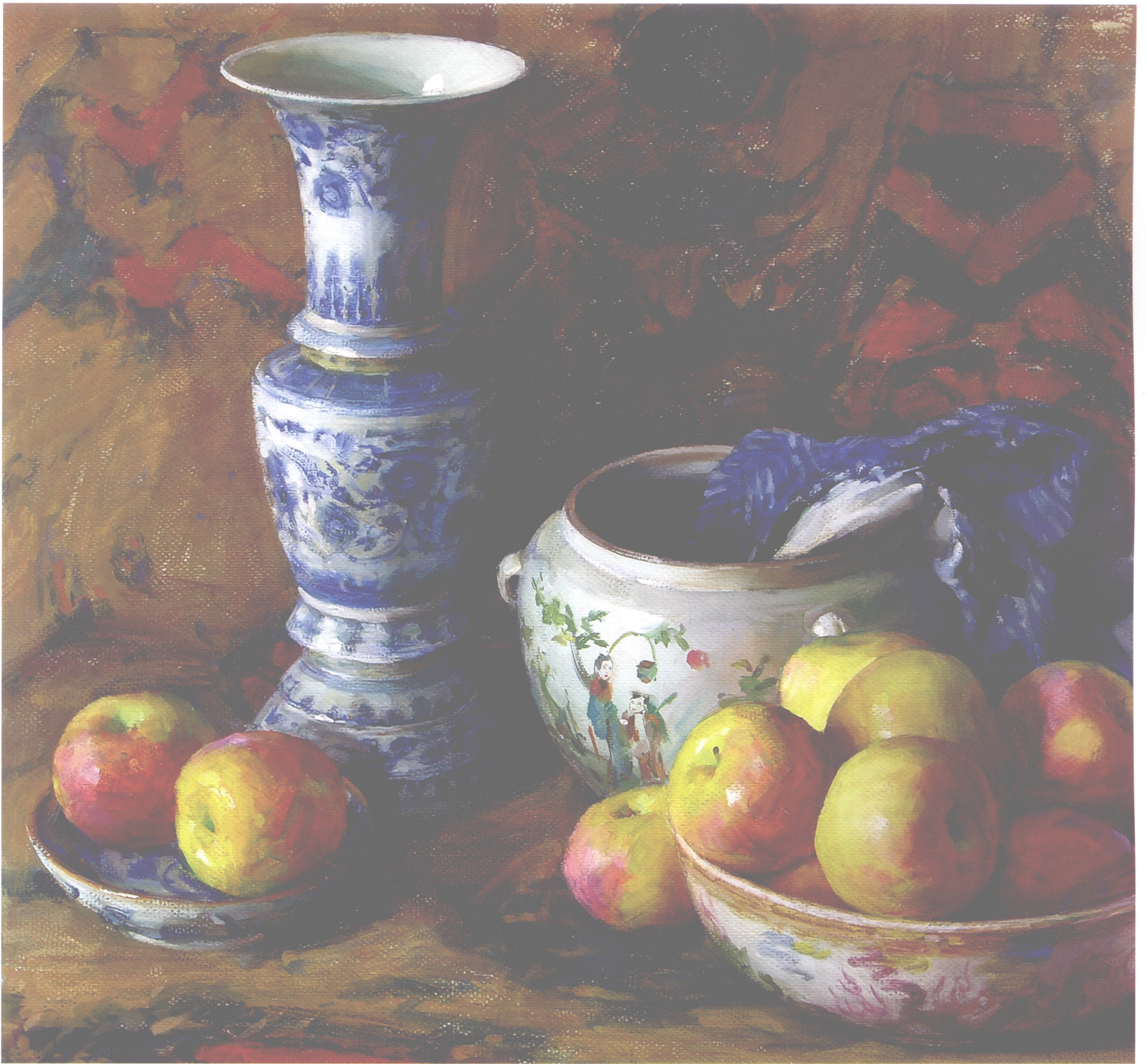
有瓷瓶和苹果的静物