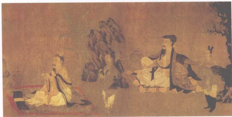
唐·孙俭·高逸图（《竹林七贤图》残卷，下幅）