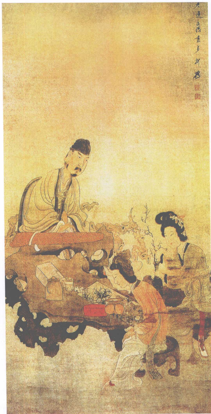
明·陈洪绶·授徒图(表现学士向女弟子传授技艺的情景)