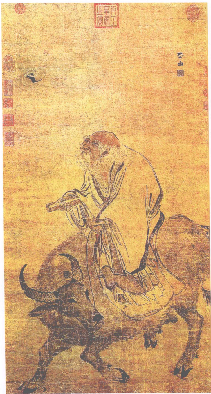
明·张路·老子骑牛图