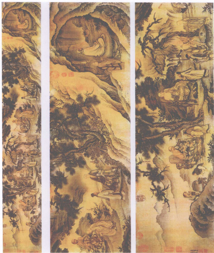
明·丁云鹏·六祖像 图(表现禅宗六祖慧 能诵经及其他僧人 论辩的场景)