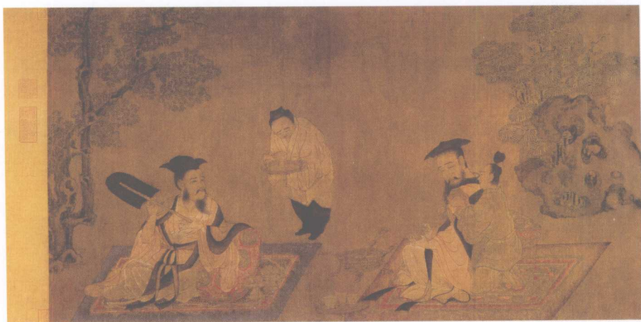
唐·孙俭·高逸图（《竹林七贤图》残卷，上幅）