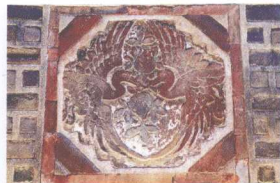
熙政堂前烟囱上装饰的凤凰图案