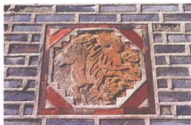
熙政堂前烟囱上装饰的马图案