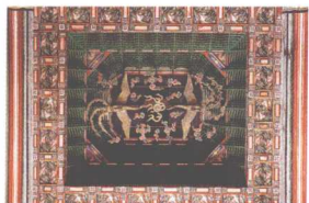
昌德宫仁政殿藻井

它是与景福宫的勤政殿、昌庆宫的明政殿、德寿宫的中和殿一道反映出朝鲜时期宫廷建筑最高成就的建筑，是韩国的国宝第225号。