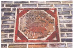
熙政堂前烟囱上装饰的鹿图案