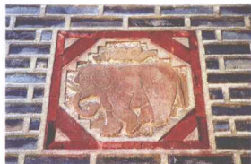
熙政堂前烟囱上装饰的大象图案