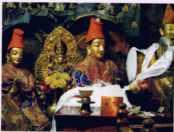
布达拉宫法王洞中 供奉的松赞干布