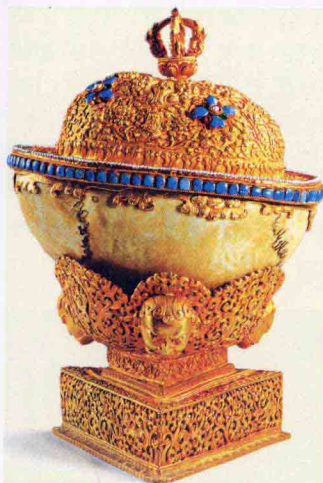
布达拉宫珍藏的法器——嘎布拉碗