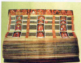
布达拉宫珍藏的贝叶经

宫(佛殿及历代达赖喇嘛灵塔殿)组成。红宫前面有一白色高耸的墙面为晒佛台，在佛教的节日用来悬挂大幅佛像挂毯。