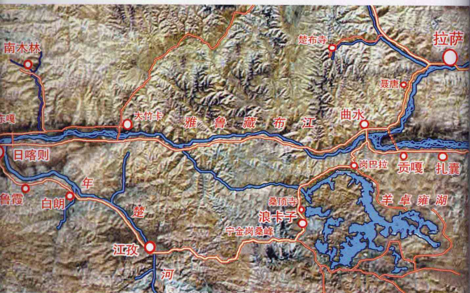
拉萨至日喀则线路图

旅游途中，南线道路条件略显逊色，大都是砂石路，但沿途自然景观和人文景观十分丰富，不能不走。北线则是中尼公路，近年这条路不断升级，柏油路面，距离短、路况好、不翻高山，沿途亦可饱览雅鲁藏布江中上游风光，另外也可以满足后藏旅游结束后归心似箭的需求。