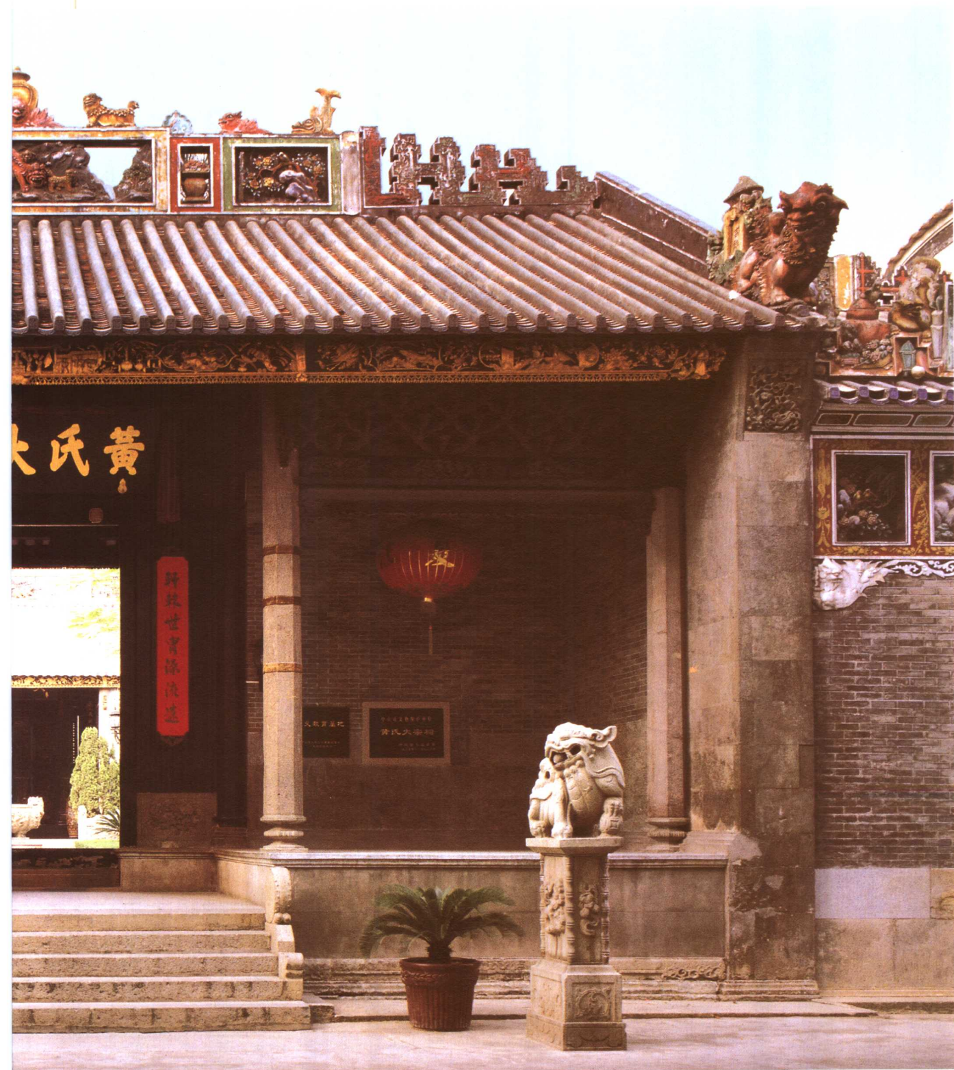
黄氏大宗祠位于西区长洲村，建于明万历年间（公元1573~1620年），面积约1600平方米。1990年被公布为中山市文物保护单位