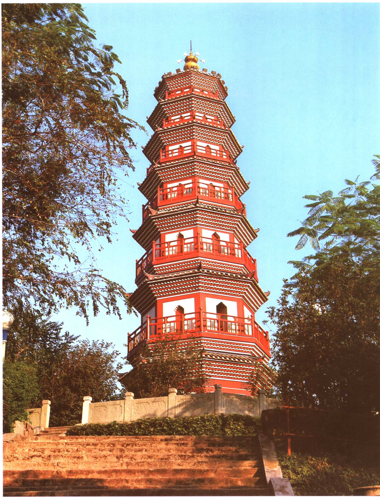
① 烟墩山塔位于石岐区烟墩山，建于明万历三十六年（公元1608年），塔高24.5米。1990年被公布为中山市文物保护单位