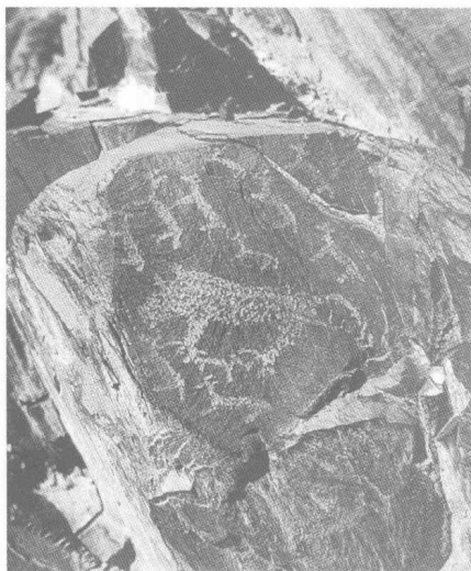
图1 东方黑山岩画 猛虎捕食图

如果从艺术的本体来考察原始艺术不能称之为艺术，之所以今天我们称其为“原始艺术”这中间存在一个长期的认识论的转换过程。因为原始社会艺术还没有达到真正的自觉，对于原始先民艺术乃是一种无意识的存在。我们今天称之为的原始艺术就其内容而言，大多表现了原始人类对生存、狩猎等原始活动的某种祭祀或崇拜。就其形式而言，他们大多采用写实的手法（东方艺术当中也包括一种有规律的抽象造型），即对被造型之物的简单再现。在此，东西方原始艺术有着很多共通之处。