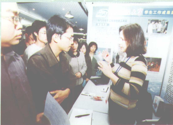
4月10日，在华法资企业在我校举办招聘会，前来应聘的学生络绎不绝