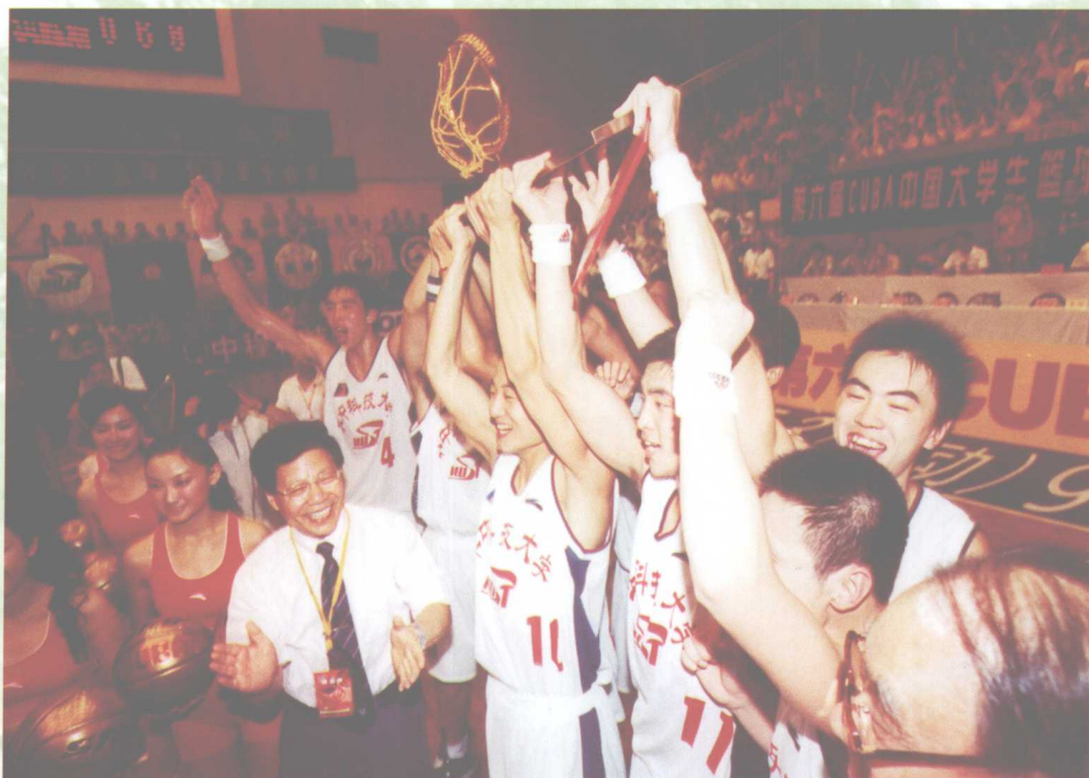
我校男篮获CUBA总冠军。图为队员们高举CUBA总冠军金篮板