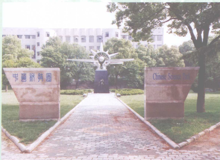
电气学院校友捐资建成的中华科技园由主体雕塑“明天”及四大发明雕塑组成