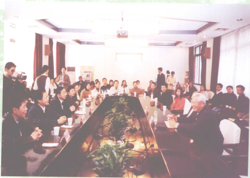
11月20日，全国政协副主席罗豪才来我校视察并受聘为我校名誉教授。图为罗豪才（右一）与师生座谈