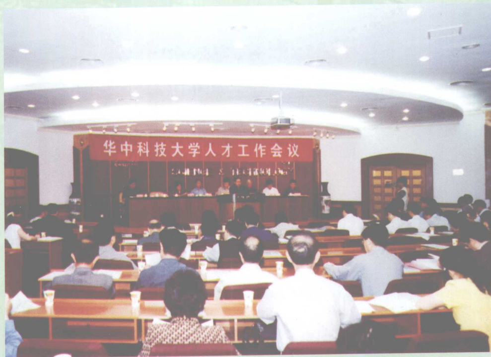
5月14日，我校召开人才工作会议，提出了创新人才工作的新思路及新措施