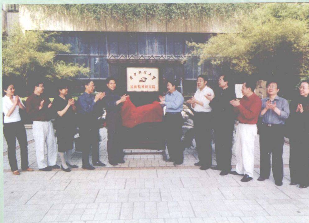
5月13日，我校民族精神研究院挂牌成立。作为国内高校首家民族精神研究院，该院承担了教育部哲学与社会科学重大课题攻关项目——“弘扬与培育民族精神研究”