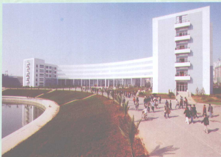
投资1.2亿元的东九教学楼于9月1日正式启用。教学楼建筑面积45000平方米，能同时容纳18400余名学生上课