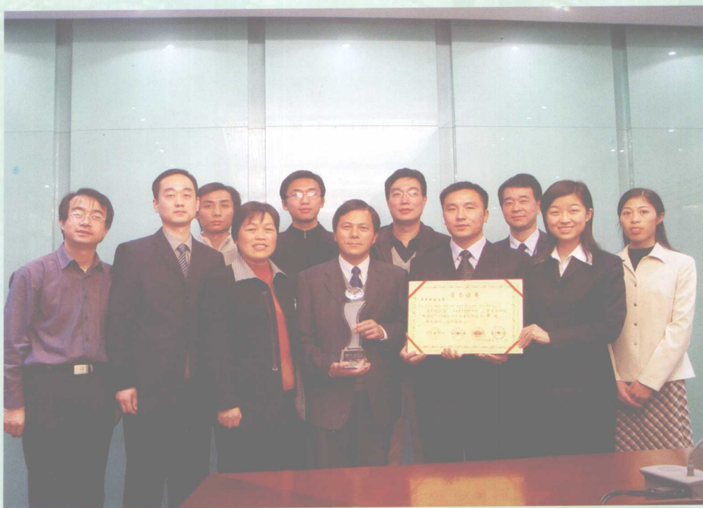
11月11日，我校参加第四届“挑战杯”中国大学生创业计划竞赛决赛的创源联盟创业团队凭借“环保型真空厕所系统”创业计划获金奖，夺得“挑战杯”