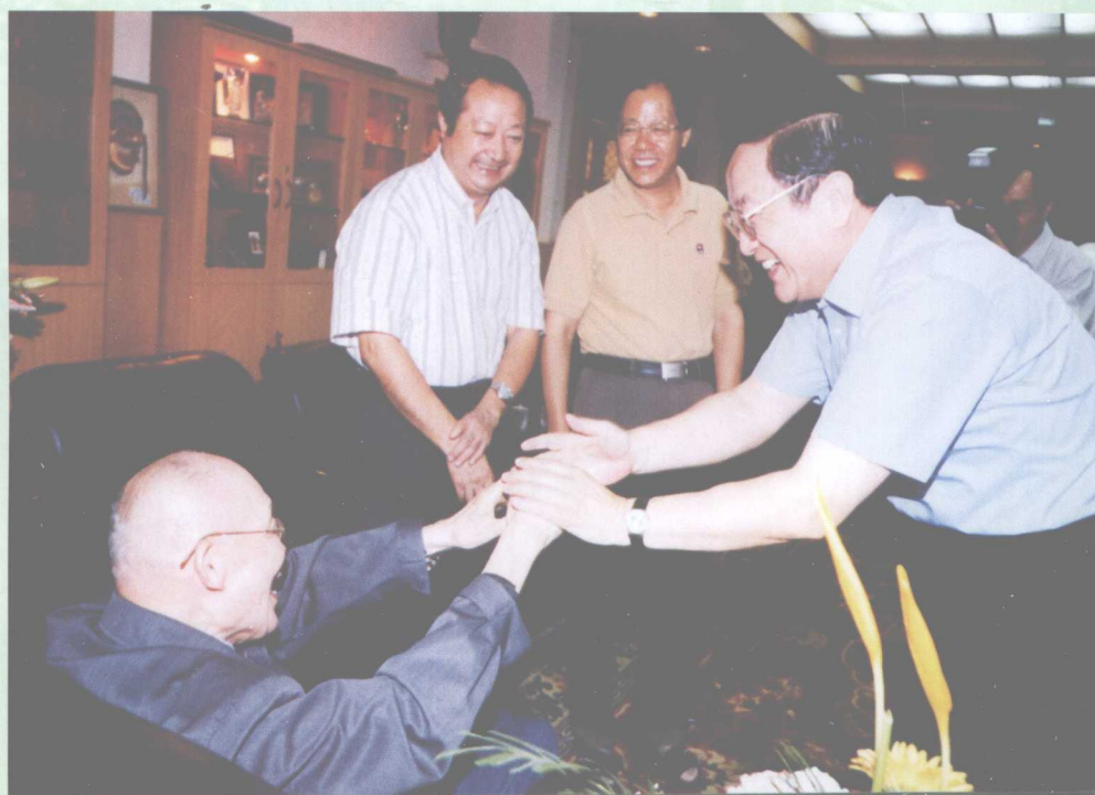
9月10日，中共中央政治局委员、湖北省委书记俞正声在校领导朱玉泉、樊明武陪同下看望我校经济学院教授张培刚并向他致以节日的问候