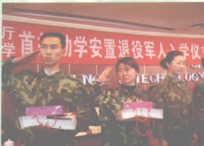
2月20日，学校为首批进入我校学习的26名退役士兵举行入学仪式