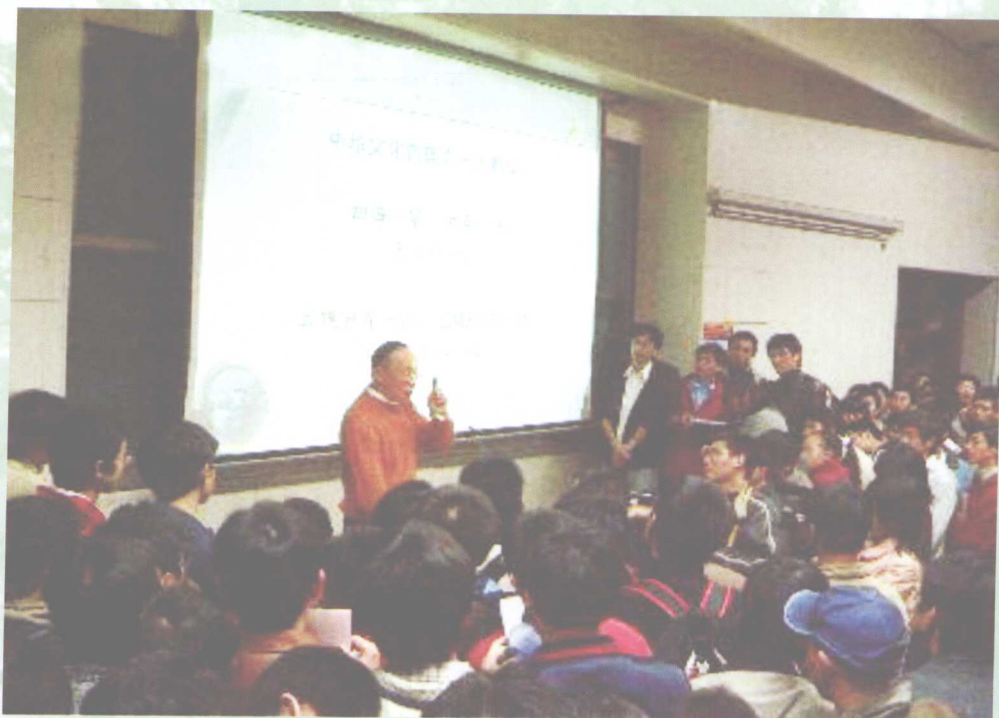
11月15日，我校举办第1000期人文讲座。杨叔子院士作题为“民族精神：中华民族文化哲理的凝现”的演讲