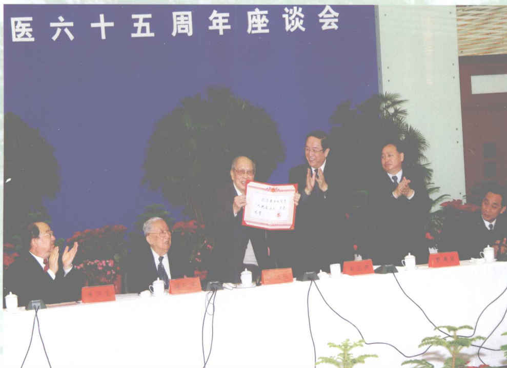
12月6日，湖北省人民政府授予裘法祖院士“人民医学家”荣誉称号