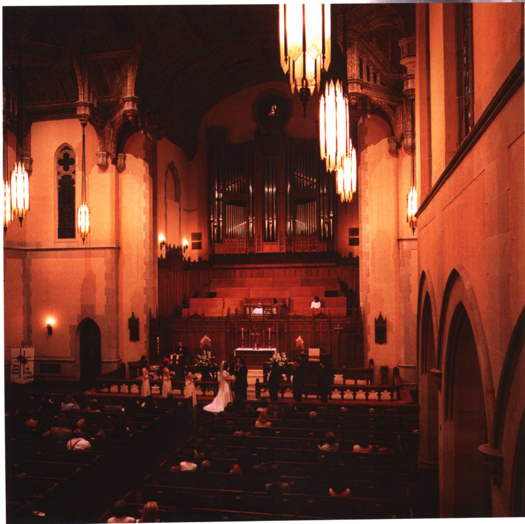
教堂里，结婚仪式正在进行，摄影师站在教堂二层楼上从高处俯拍，教堂结婚仪式的庄严场面尽收眼底。