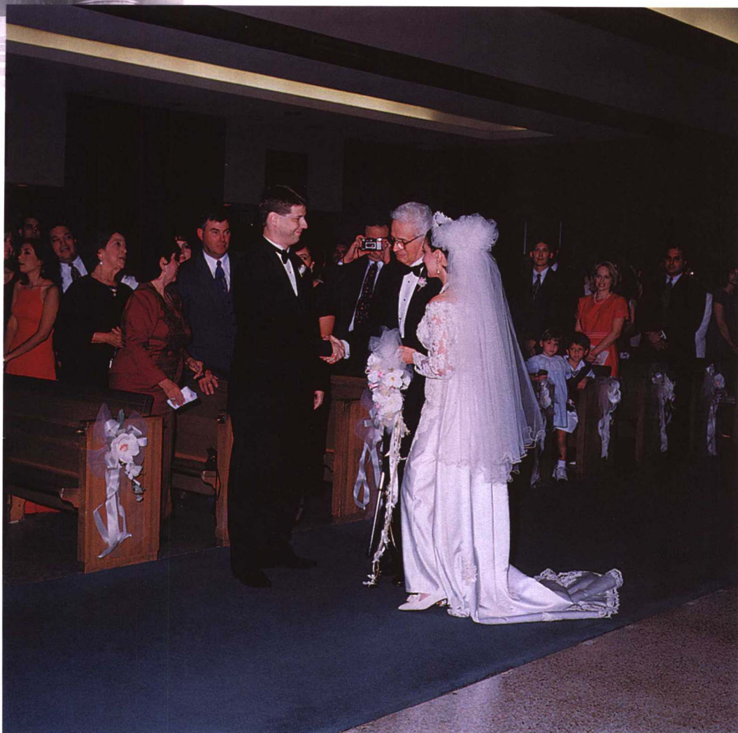
新娘在父亲的带引下走进教堂，新郎迎上前去，来宾站起来迎接以示礼貌，拍摄时要尽可能把来宾摄入。