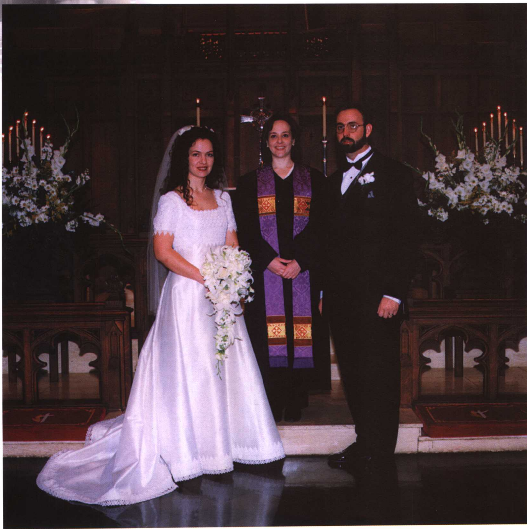
在教堂里，由女牧师主持证婚。在“上帝”面前，由牧师提问，新娘和新郎回答，在对婚姻作出庄严的承诺后，女牧师居中，新娘和新郎分列两边，面对镜头，拍下了这张具有纪念意义的照片。