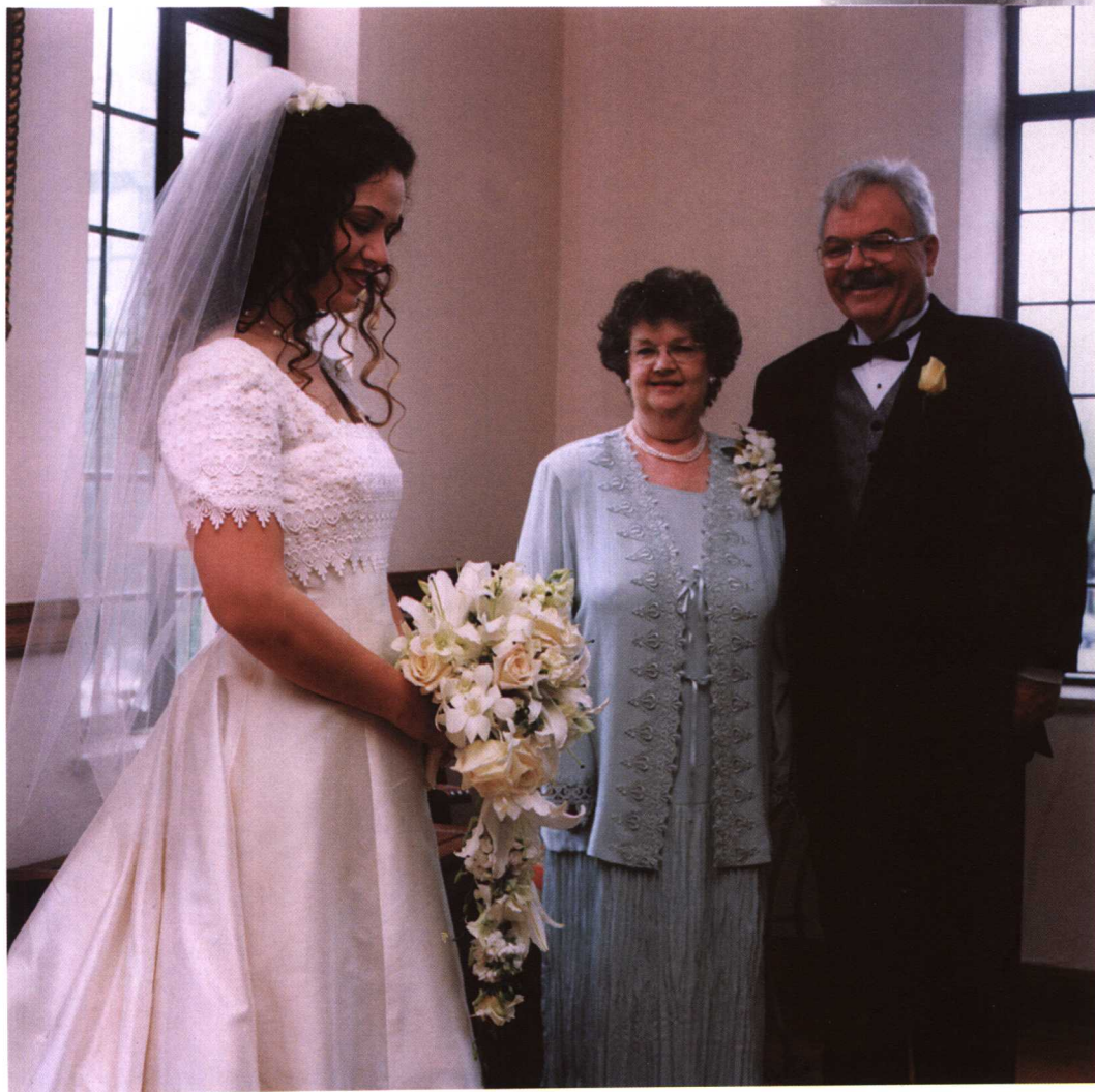
在结婚仪式举行之际,新娘在父母的陪伴下整装待发,新娘的脸庞洋溢着幸福的羞涩,父母站在一旁看着心爱的女儿,由衷的高兴。画面构图突出新娘的位置,父母在焦点之外。