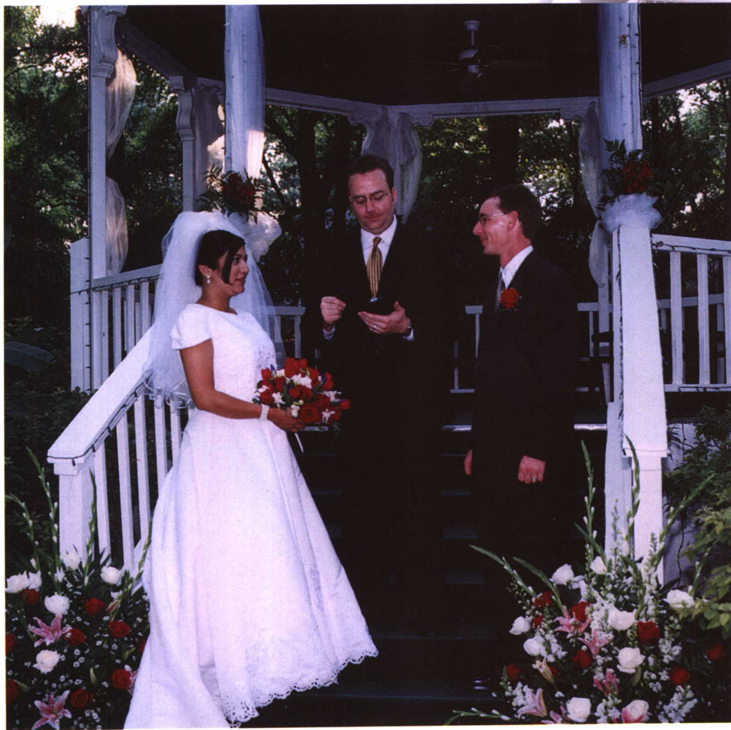
在亭子的台阶上，牧师手捧证婚词主持证婚仪式，新娘和新郎凝视对方正在相互作答。