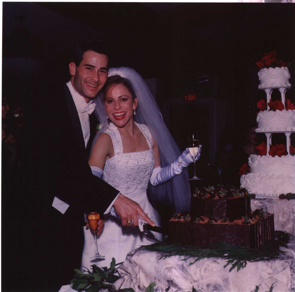
新人切蛋糕是婚宴中重要的一幕，新娘新郎一起切下第一块结婚蛋糕，近处的巧克力双层蛋糕是新郎蛋糕，远处多层的草莓奶油蛋糕是新娘蛋糕。一对新人面对镜头，神采飞扬，洋溢着幸福。