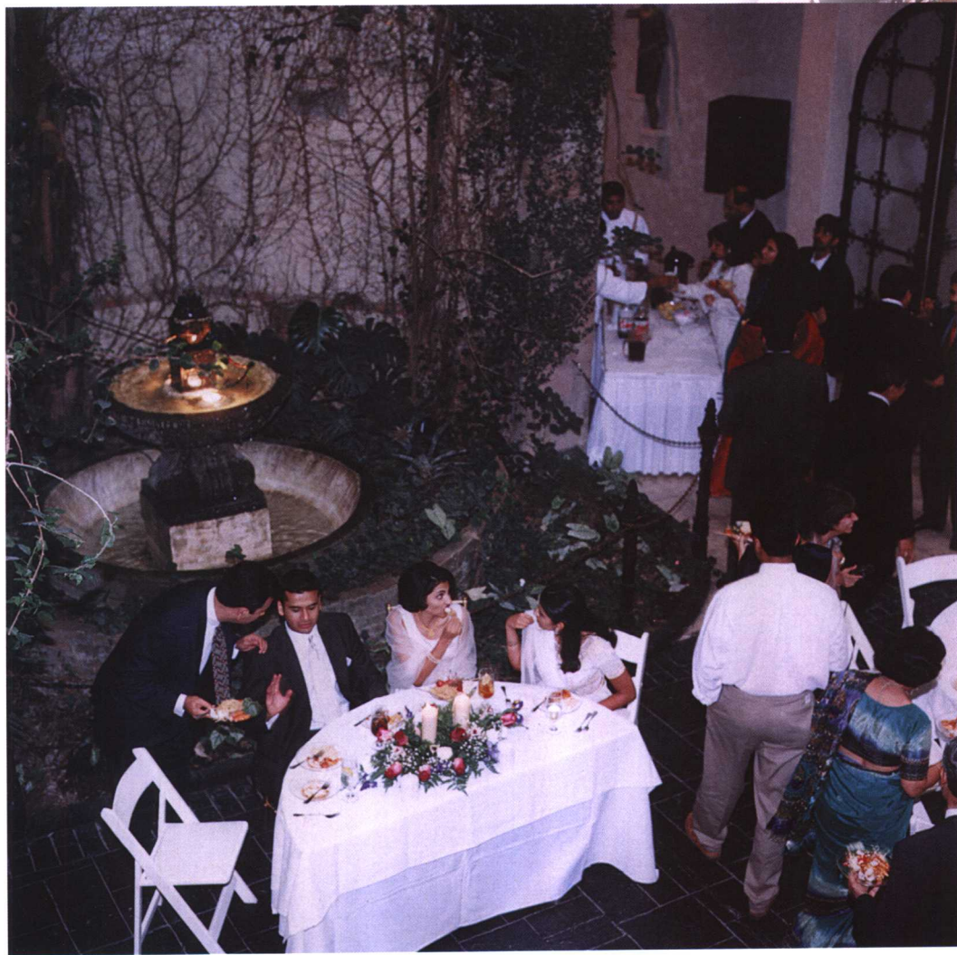
这幅照片运用俯视拍摄，焦点是新娘和新郎，宾客鱼贯而入，画面独特有趣。