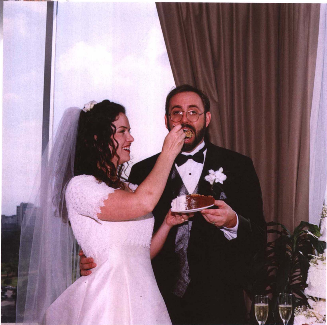
切下的第一块蛋糕由新娘吃第一口，再由新娘给新郎喂第二口，这是西方婚宴中的一项习俗。新郎右手相拥新娘，正面对着镜头，新娘虽侧身但脸部表情自然生动。