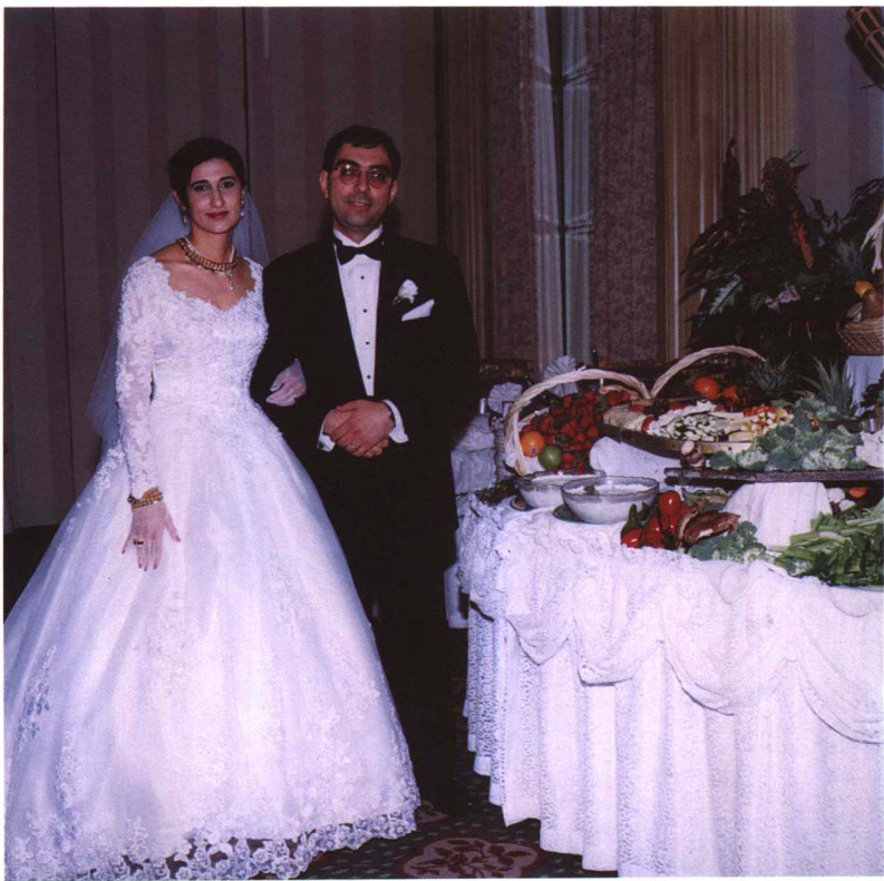
婚宴开始前，新娘新郎相依在丰盛的菜肴边合照纪念。

结婚仪式结束后，要举行结婚宴会招待来宾。婚宴可以设传统的座席宴会，也可以设自助餐，地点可在酒店、俱乐部、宾馆，也可在家庭或有特别意义的地方。