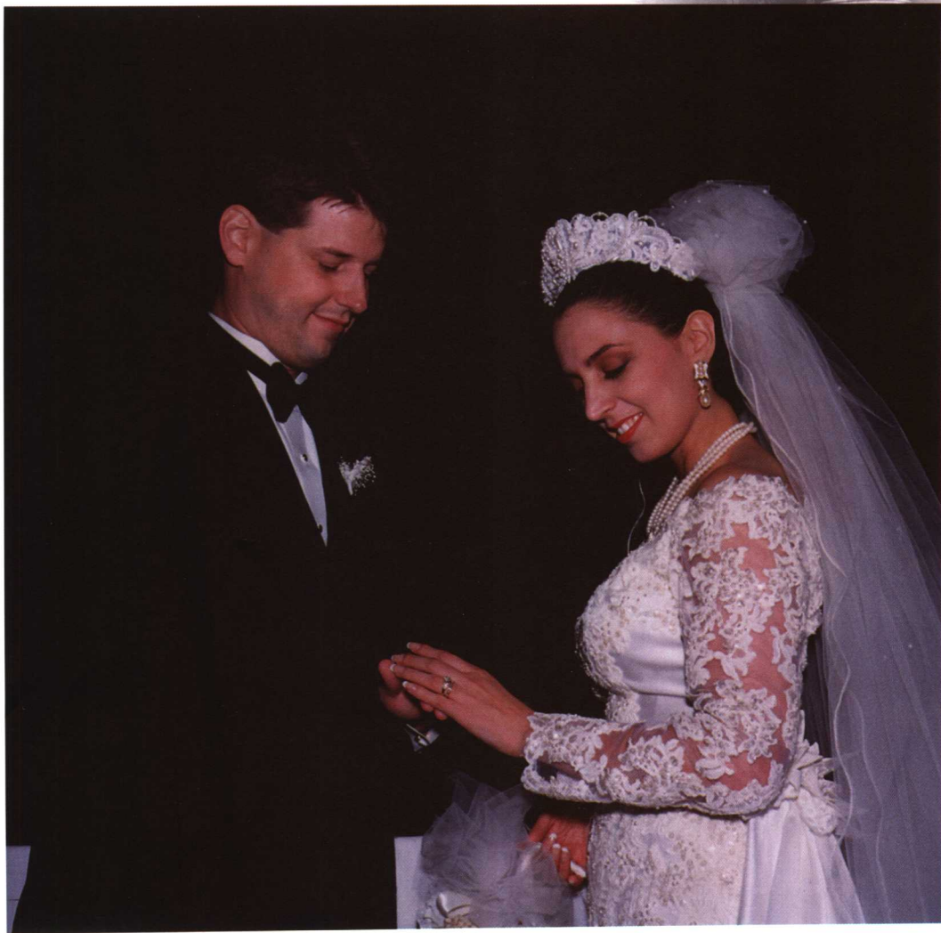
新娘与新郎互赠结婚戒指。画面上新郎在为新娘戴好戒指后，一对新人凝视着新娘手上的戒指，脸上洋溢着幸福的微笑。摄影师从低角度抓拍，新人的脸部表情才能自然和清晰。