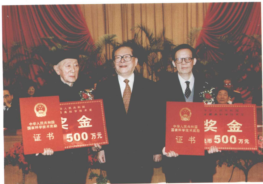
▲ 2002年2月1日,在北京人民大会堂隆重举行的国家科学技术奖励大会上,国家主席江泽民与2001年度国家最高科学技术奖获奖者黄昆和王选合影