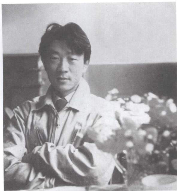
▶ 1950年在英国做博士后