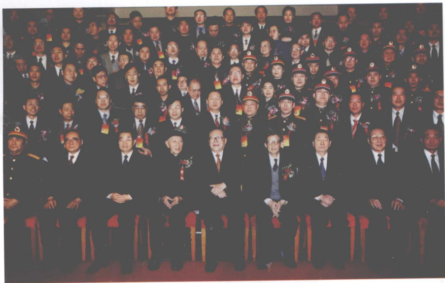
▲ 2002年2月1日,国家科学技术奖励大会上,国家领导人与获奖者合影