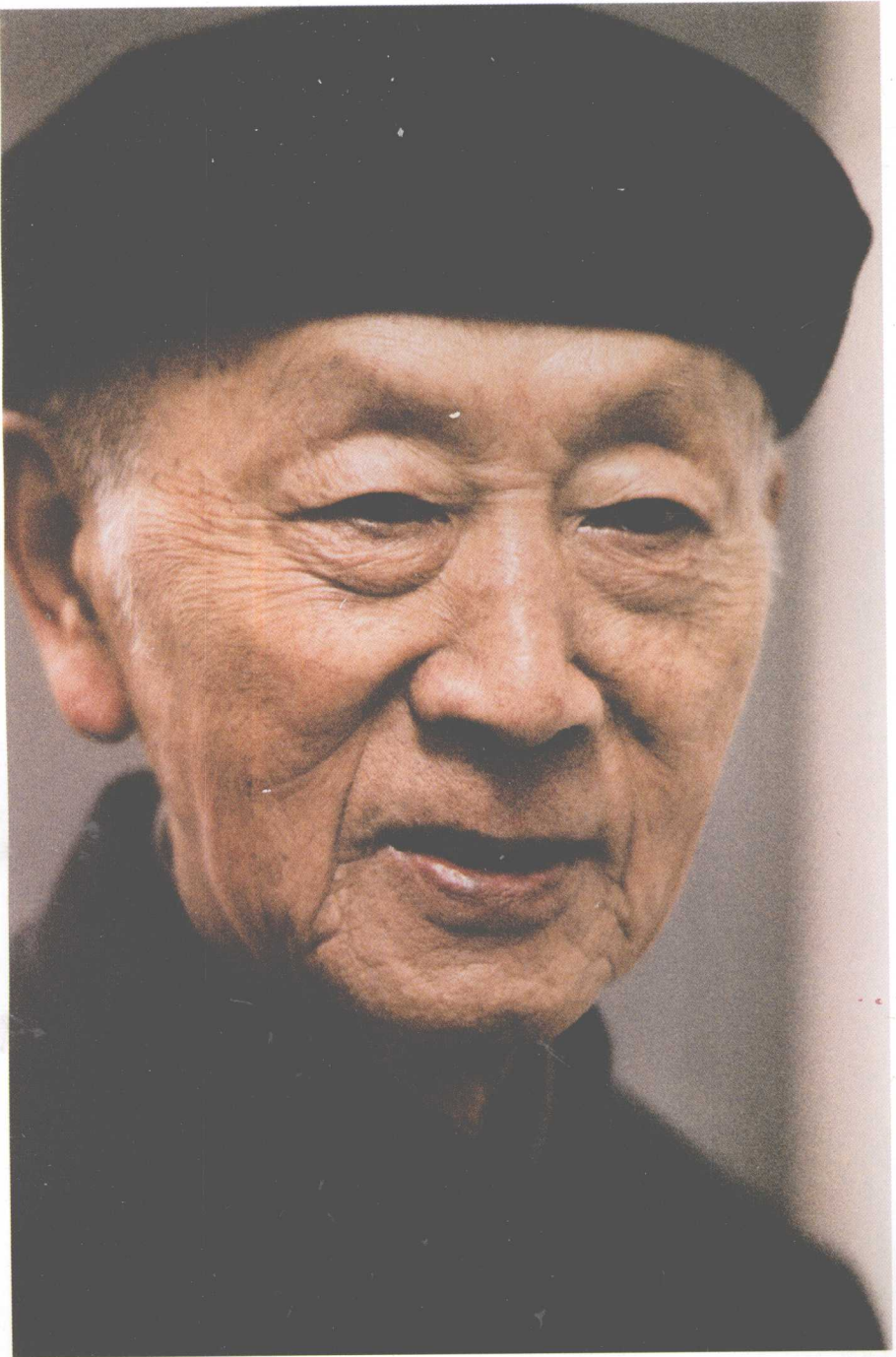
黄 昆 院 士