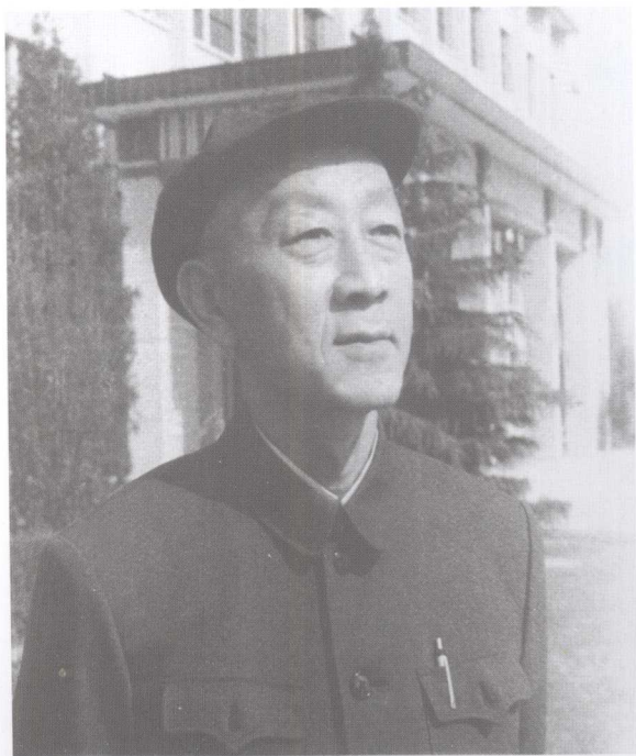
▶ 1987年作学术 报告