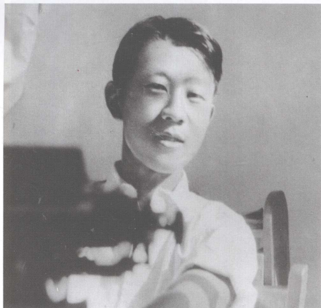
▶ 在燕京大学物理 实验室