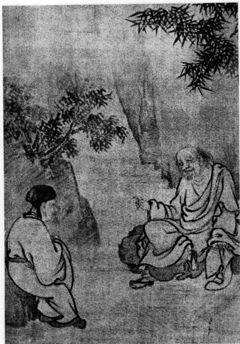
马祖庞居士问答图（天宁寺藏）